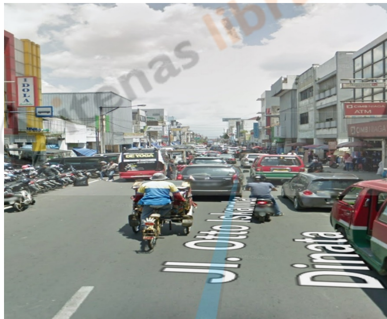
Gambar 1.1 Peta Lokasi