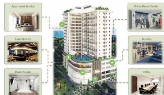
Gambar 2. 4 The Green Kosambi

kamar yang dapat menjadi pilihan bagi mahasiswa, profesional muda, dan keluarga.