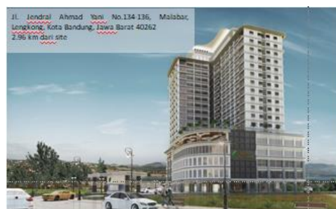
Gambar 2. 3 The Green Kosambi

The Green Kosambi terdiri dari Green Kosambi Trade Mall dan Apartemen dengan total 20 lantai (12 lantai untuk apartemen). Apartemen ini adalah sebuah proyek terbaru tepat di pusat Kota Bandung dengan konsep Green Living . Green Kosambi Berlokasi di Jl.A.Yani, di dekat dengan simpang lima Bandung yang merupakan titik pusat kota alun-alun Bandung dan Jln Asia Afrika Bandung. Selain itu, apartemen ini juga dekat dengan kompleks perkantoran dan perbankan serta berada di seberang pasar tradisional dan pusat perbelanjaan Kosambi. Apartemen ini juga dekat dengan Pusat Factory Outlet sepanjang jalan Riau dan beberapa sekolah & universitas swasta ternama di Bandung. Dapat dilihat pada Gambar 2.3 dan Gambar 2.4 .