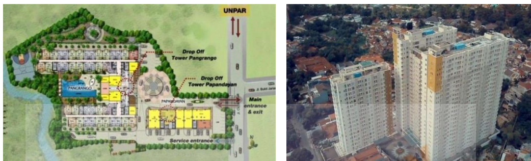
Gambar 2.1 Apartemen Parahyangan Residence

Merupakan Apartemen dengan kelas menengah ke atas. Apartemen yang berlokasi di Jalan Ciumbukeuit ini merupakan gagasan yang menyediakan dan mengakomodasi penghuninya yang hidup untuk lokasi strategis dekat banyak lembaga pendidikan dan universitas, salah satunya Universitas Parahyangan. Massa Bangunan dibuat dengan tiga volume vertikal yang terhubung satu sama lain. dapat dilihat pada Gambar 2.1 dan Gambar 2.2 .