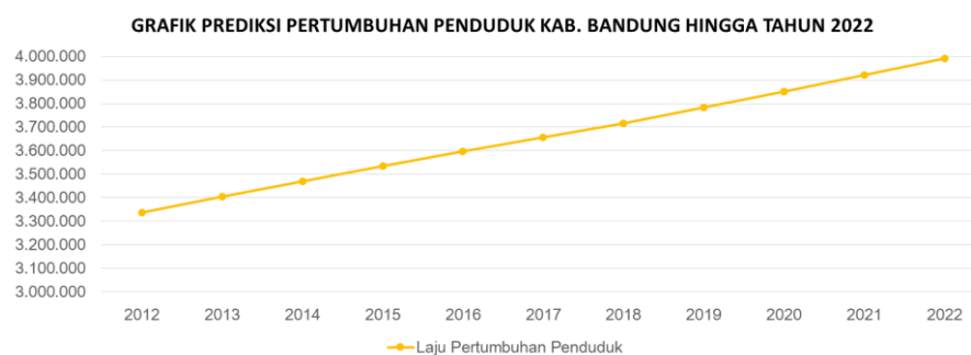
Gambar 1. 1 Kenaikan Penduduk Tahun 2012-2017 & Prediksi Kenaikan Penduduk Tahun 2017-2022

Berdasarkan Tabel 1.1 diatas, jumlah penduduk kabupaten bandung mengalami peningkatan dari setiap tahun ke tahun dengan rata-rata presentase 1.80 % hal ini menandakan bahwa penduduk Kabupaten Bandung terus menerus mengalami pertumbuhan dalam jumlah penduduk tentunya, kondisi tersebut menjadi salah satu faktor dalam pembangunan sebuah apartemen atau hunian vertikal di wilayah perkotaan demi menunjang kebutuhan masyarakat akan hunian. Berikut Gambar 1.1 yang merupakan prediksi jumlah penduduk Kabupaten Bandung pada tahun 2022