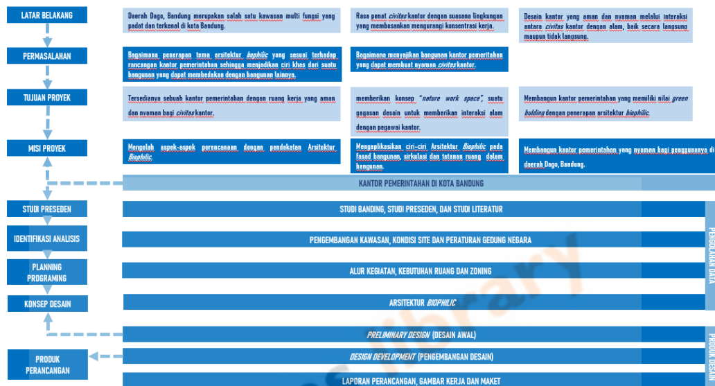
Bagan 1.1. Skema Pemikiran

Skema pemikiran seperti pada Bagan 1.1 memperlihatkan alur dari rancangan Kantor BAPPEDA Provinsi Jawa Barat yang dimulai dari latar belakang, permasalahan, tujuan dari perancangan Kantor BAPPEDA Provinsi Jawa Barat hingga desain konsep sehingga dapat dihasilkan produk dari rancangan.