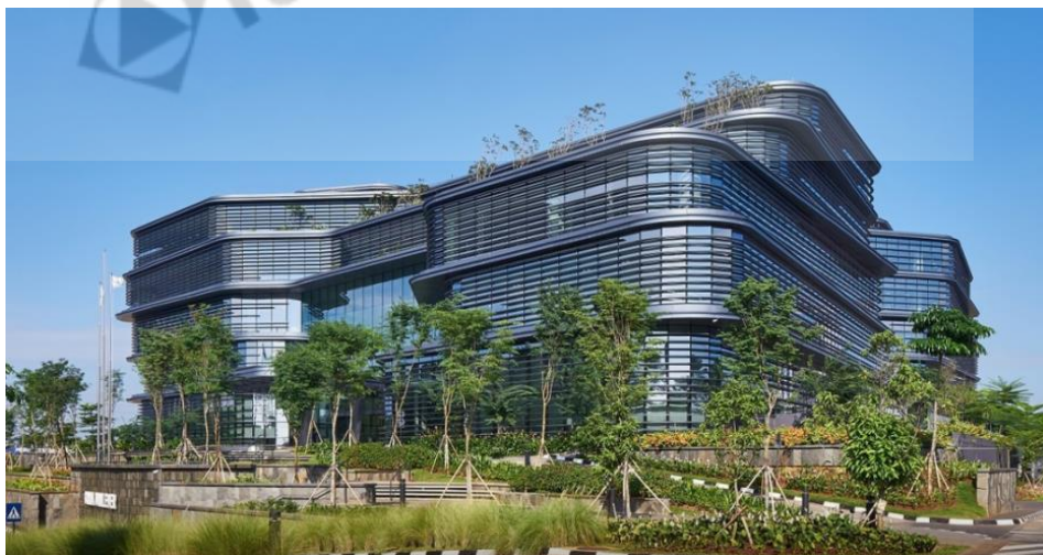
Gambar 2.3 Aedas, Jakarta

kantor Aedas yang terletak di Jakarta, Indonesia dengan luasan 50477.0 m 2 dibangun pada tahun 2017, dapat dilihat pada Gambar 2.3 .