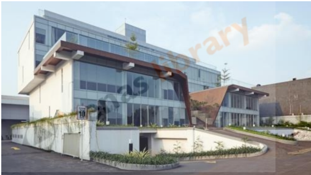
Gambar 2.1 Graha Adi Media, Jakarta