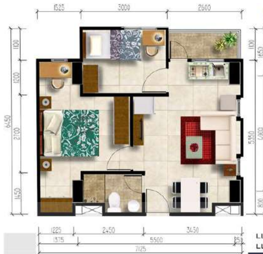
Gambar 2. 9 Gambar Kamar 2 Bedroom + Corner

tersebut. Untuk kamar jenis 2 bedroom + corner ini adalah 49 meter persegi.