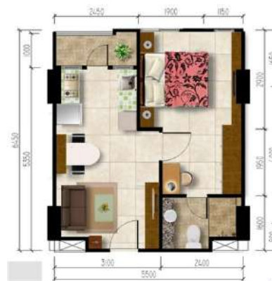
Gambar 2. 10 Kamar Tipe Grand

Tipe ini adalah tipe kamar yang memiliki 1 kamar dan 1 ruang keluarga dengan 1 tempat sofa, 1 ruang dapur dan 1 balkon. Luas kamar tersebut yaitu berukuran 39 meter persegi.