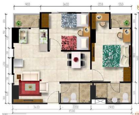
Gambar 2. 13 Gambar Kamar Grand 2 Bedroom Corner

Tipe ini adalah tipe yang sama seperti Grand 2 Bedroom . Namun yang membedakannya adalah dari segi luas kamar yang memiliki luas 62 meter persegi.