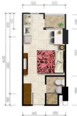
Gambar 2. 5 Kamar Tipe Studio + K

Tipe ini adalah tipe diatas studio dengan perbedaannya terdapat ruang dapur didalam kamar tersebut. Juga yang membedakan antara kamar studio adalah ukuran kamarnya yaitu 28 meter persegi.