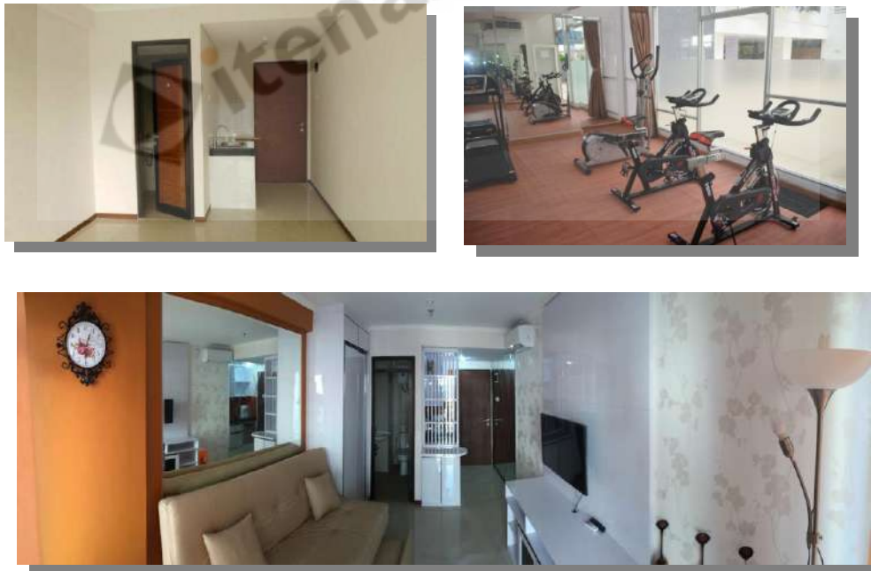
Gambar 2. 2 Tipe Kamar di Apartemen Gateway beserta Fasilitas Apartemen

Dapat dilihat pada Gambar 2.2 mengenai tipe kamar pada Apartemen Gateway.