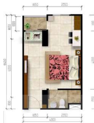
Gambar 2. 4 Kamar Tipe Studio

Tipe ini adalah tipe terendah di studio dengan menawarkan single bed , balcon dan 1 kamar mandi, dengan ukuran luas kamarnya adalah 21 meter persegi.