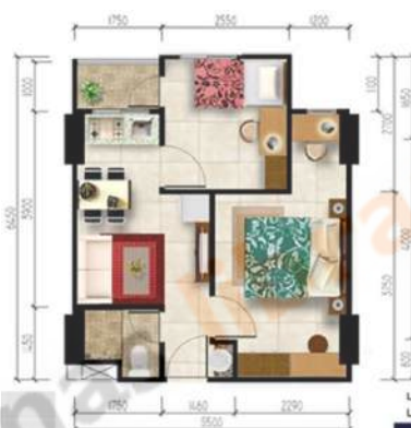
Gambar 2. 8 Gambar Kamar 2 Bedroom

Jadi jenis kamar ini adalah jenis kamar sederhana yang memiliki fasilitas terutama 2 kamar dengan 1 kamarnya terdiri atas balkon ( yang terdiri atas 1 kamar double bed dan single bed ), 1 ruang keluarga yang menyatu dengan ruang dapur, dan terakhir adalah toilet.