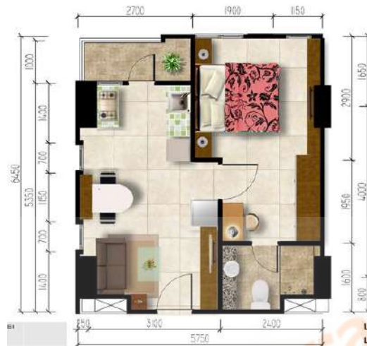
Gambar 2. 11 Gambar Kamar Grand 1 Bedroom Corner

Tipe ini adalah tipe kamar yang sama seperti Grand 1 Bedroom , namun yang membedakan adalah terlihat pada ukuran luas nya yang bertambah menjadi 41 meter persegi.