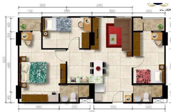
Gambar 2. 14 Gambar Kamar Grand 3 Bedroom

Tipe ini adalah tipe kamar yang memiliki 3 kamar tidur dan ruang keluarga yang menyatu dengan ruang dapur. Sama seperti Grand 2 Bedroom , karakteristik kamar yang dimiliki dengan 1 kamar terdapat 1 toilet khusus. Untuk luas kamar Grand 3 Bedroom ini adalah 79 meter persegi.