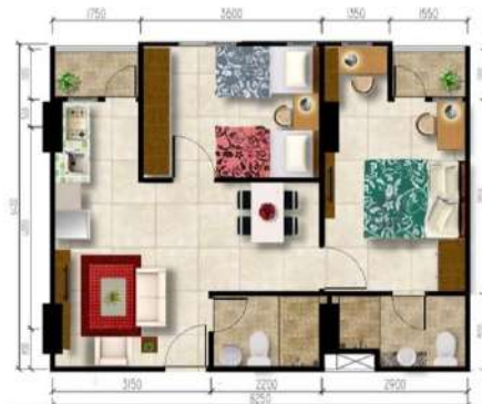
Gambar 2. 12 Gambar Kamar Grand 2 Bedroom

Tipe ini adalah tipe kamar yang memiliki 2 kamar tidur dan 1 ruang keluarga menyatu dengan ruang makan, 1 tempat sofa dan 1 meja makan. Akan tetapi 2 kamar di tipe Grand 2 Bedroom ini memiliki 1 kamar dengan 1 kamar mandi, dan juga 1 kamar dengan non atau tidak ada kamar mandi. Luas kamar Grand 2 Bedroom adalah 59 meter persegi.