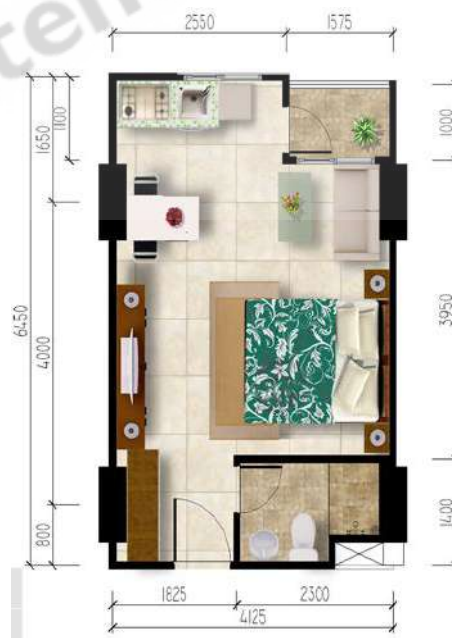
Gambar 2. 7 Gambar Kamar Studio +

Tipe ini adalah tipe di atas tipe studio + k. Sama dengan tipe studio + K yang memiliki single bed , balcon , Ruang Dapur, Sofa dan 1 kamar mandi, namun yang membedakannya adalah luas lahannya yaitu 29 meter persegi.