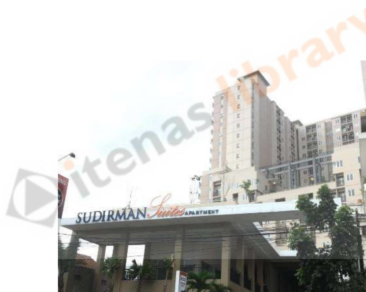
Gambar 2. 3 Apartemen Sudirman Suites 1

Berdiri diatas lahan sebesar \pm 7.000 m 2 , Sudirman Suites Apartment memiliki 785 unit SIAP HUNI. Sudirman Suites Apartment sangat mudah diakses karena terletak di jalan utama kota Bandung yaitu Jalan Jendral Sudirman, yang dekat dengan berbagai sarana umum seperti mall, pasar, jalan tol, bandara, sekolah, dan rumah sakit.