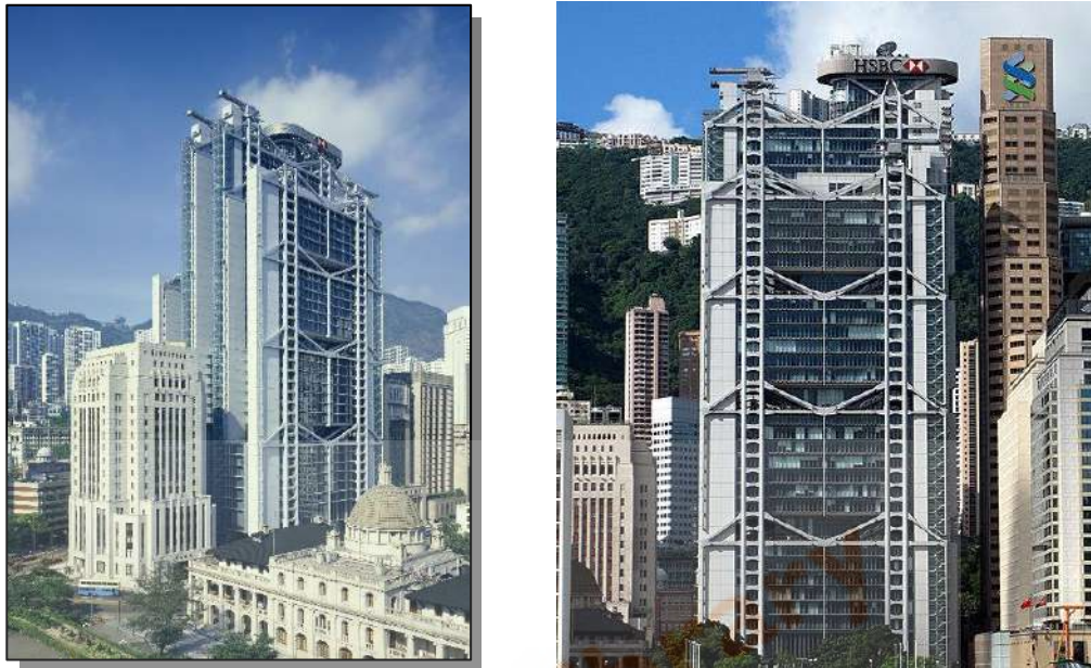
Gambar 2. 16 Gambar Perspektif Hongkong HSBC Building