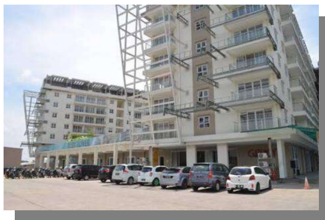
Gambar 2. 1 Gambar Apartemen Gateway Pasteur 1

Sumber : www.sudirmansuitesapartmentbandung.wordpress.com , diakses pada April 2019