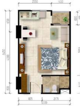
Gambar 2. 6 Gambar Kamar Studio + Star

tempat kursi sofa yang dikhususkan untuk keluarga duduk di samping single bed .