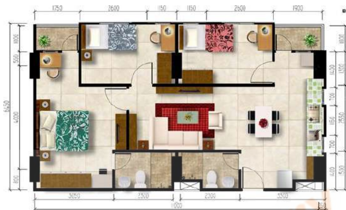
Gambar 2. 15 Gambar Kamar Grand 3 Bedroom Corner

Tipe ini adalah tipe yang sama seperti Grand 3 Bedroom Corner . Namun yang membedakan antara Grand 3 Bedroom yang biasa adalah luas kamarnya dengan 81 meter persegi.