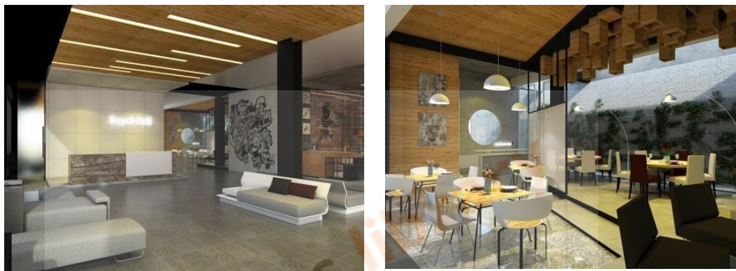
Gambar 2.6 Interior Royal Hotel Bali