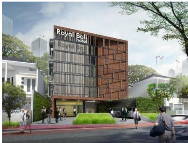
Gambar 2.5 Royal Bali Hotel