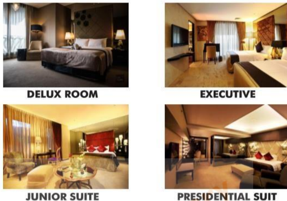
Gambar 2.4 Kamar Amaroossa Hotel Bandung

Suasana yang diterapkan pada tiap-tiap jenis kamar di hotel Amaroossa Bandung di buat dengan suasana yang nyaman terkesan elegan. Suasana pada tiap Janis kamar hotel Amaroossa Bandung dapat dilihat pada Gambar 2.4