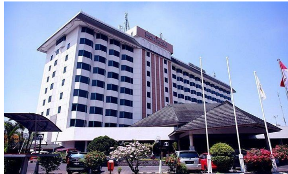
Gambar 2.1 Horison Ultima Bandung

Hotel Horison Ultima Bandung merupakan salah satu hotel di Bandung dengan klasifikasi bintang 4, hotel ini juga merupakan hotel bisnis sehingga cukup tepat untuk dijadikan studi banding. Hotel ini memiliki ballroom berukuran 35.5m x 23.4m dengan kapasitas 1200 orang. Hotel ini juga memiliki 26 meeting room dengan kapasitas yang berbeda-beda. Meeting room terbesar berukuran 24m x 22m dengan kapasitas 500 orang, sedangkan untuk meeting room terkecil berukuran 4m x 4m dengan kapasitas maksimal 20 orang. Luasan dan kapasitas masing-masing jenis meeting room dapat dilihat pada Tabel 2.3 .