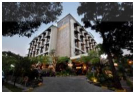
Gambar 2.3 Amaroossa Hotel Bandung

Amaroossa Hotel Bandung dapat dilihat pada Gambar 2.3 adalah hotel butik bintang-4. Hotel ini memiliki koleksi 92 kamar hotel yang dibagi menjadi empat jenis ( Deluxe , Executive , Junior Suite , dan Presidential Suite ), serta berbagai layanan termasuk restoran luar ruangan, bar, toko roti, spa, pusat kebugaran, kedai kopi, kolam renang dan salon. Hotel ini terletak di jalan Jl. Aceh No. 71A.