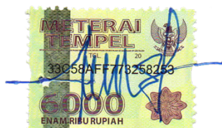
Deni Puji Nurwanto