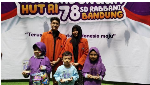
Gambar 4.11 Dokumentasi Penyerahan Hadiah Lomba Mewarnai