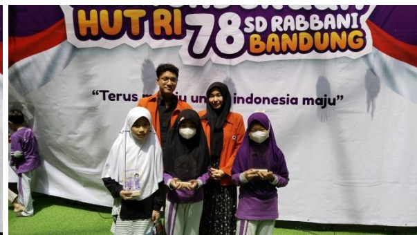
Gambar 4.12 Dokumentasi Penyerahan Hadiah Lomba Membuat Kolase