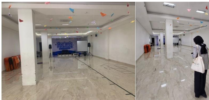
Gambar 3.2 Survey Lokasi

Survey lokasi dilakukan untuk mengetahui dan mengumpulkan data mengenai kondisi tempat yang akan dilaksanakan perlombaan. Dilakukan bersamaan pada hari pertemuan dengan pihak SD Rabbani. Ruang yang akan dijadikan tempat perlombaan adalah Aula Lantai 4 SD Rabbani.