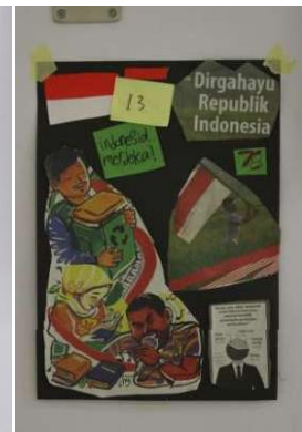
Gambar 4.10 Hasil Karya Juara 3 Lomba Membuat Kolase : Senja Salama