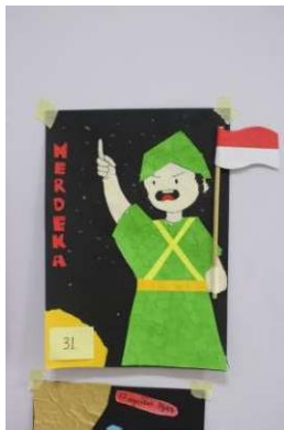
Gambar 4.8 Hasil Karya Juara 1 Lomba Membuat Kolase : Aila Maryam N