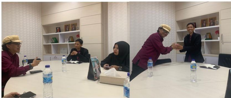
Gambar 3.1 Pertemuan dan Pembahasan Mengenai Lomba

Pertemuan dilakukan pada tanggal 8 Agustus 2023 di Ruang Meeting Sekolah, untuk membahas mengenai pengajuan jenis lomba yang akan diadakan serta teknis, jadwal dan ketentuan yang berlaku di sekolah. Ketua pelaksana dan panitia mengajukan beberapa jenis lomba, dan lomba yang disepakati adalah Lomba Mewarnai untuk kelas 1 - 3, dan Lomba Membuat Kolase untuk kelas 4 - 6.