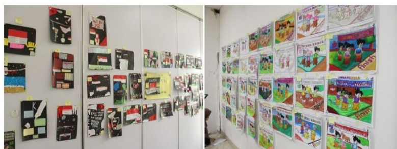
Gambar 3.6 Hasil Karya Peserta

Dari hasil karya para murid kemudian ditampilkan dengan menempelkan karya pada dinding untuk dapat dipamerkan juga dan untuk memudahkan proses penilaian. Untuk penilaiannya sendiri dilakukan oleh ketua tim pengusul dan juga salah satu perwakilan dari guru SD Rabbani.