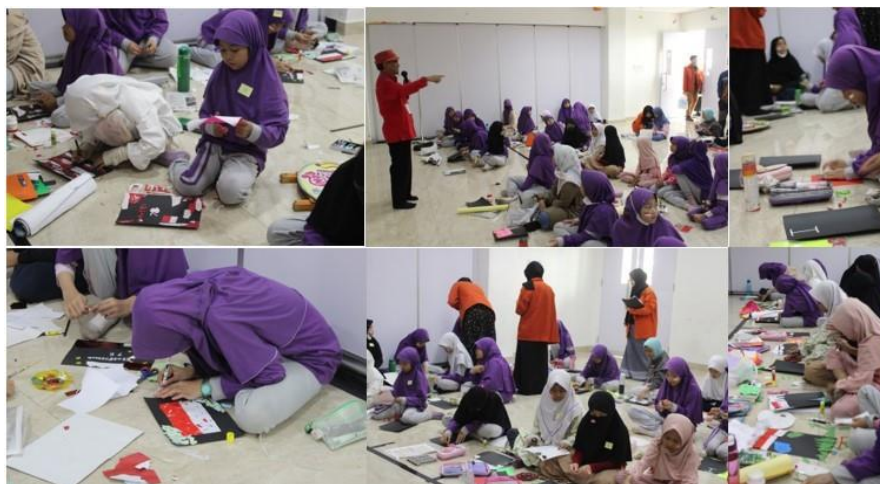
Gambar 3.4 Lomba Membuat Kolase

Lomba mewarnai diikuti oleh kelas 1 – 3, peserta telah dihimbau untuk membawa peralatan sendiri seperti alat lukis atau mewarnai, dan meja lipat sebagai alas untuk mewarnai. Sesuai dengan standar lomba mewarnai tingkat SD, panitia telah menyiapkan kertas gambar berukuran A3 dengan tema hari kemerdekaan.