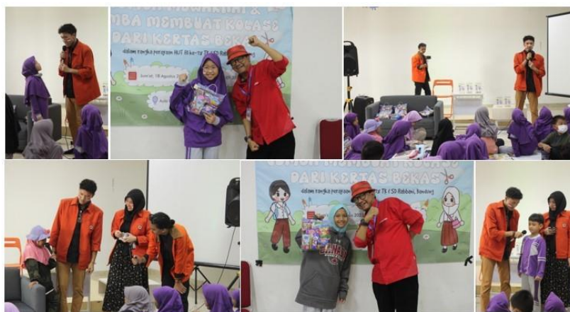
Gambar 3.5 Sesi Kuis

Pada pertengahan dan akhir perlombaan panitia melakukan kuis pertanyaan yang bersangkutan dengan hari kemerdekaan. Bagi beberapa murid yang dapat menjawab dan yang berani untuk mencoba menjawab diberikan hadiah yang telah disiapkan panitia.