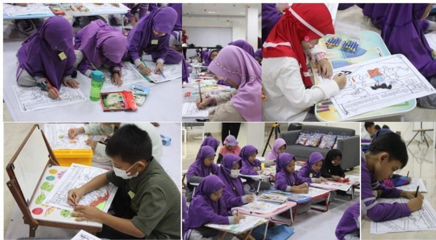
Gambar 3.3 Lomba Mewarnai

Pelaksanaan lomba ini dilaksanakan pada hari Jum'at tanggal 18 Agustus 2023, bertempat di Sekolah Rabbani Bandung yang berlokasi di Jl. Cisaranten Indah No. 5 Sukamiskin, Kota Bandung. Terdapat dua perlombaan yang diadakan, yaitu Lomba Mewarnai untuk kelas 1 – 3 dan Lomba Membuat Kolase untuk kelas 4 – 6.