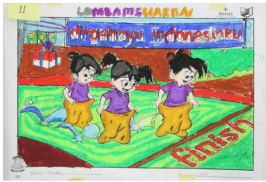
Gambar 4.5 Hasil Karya Juara 1 Lomba Mewarnai : Ilmi