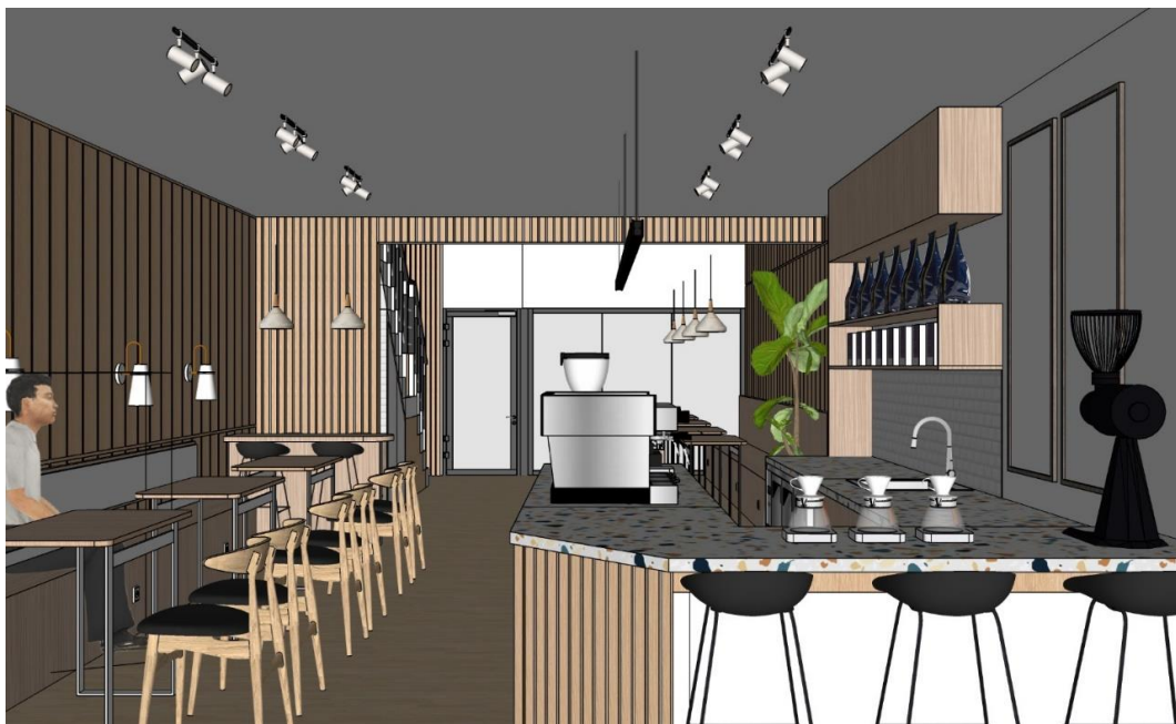
Gambar Perspektif dari arah Depan