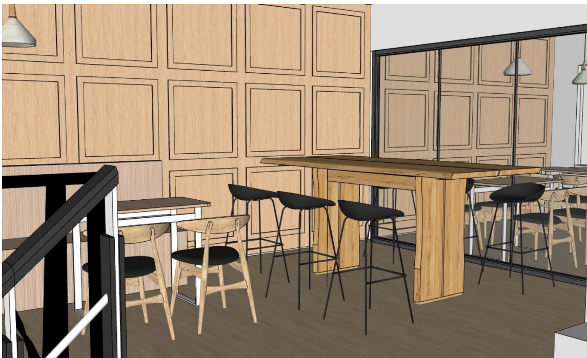
Gambar Perspektif Lantai Atas