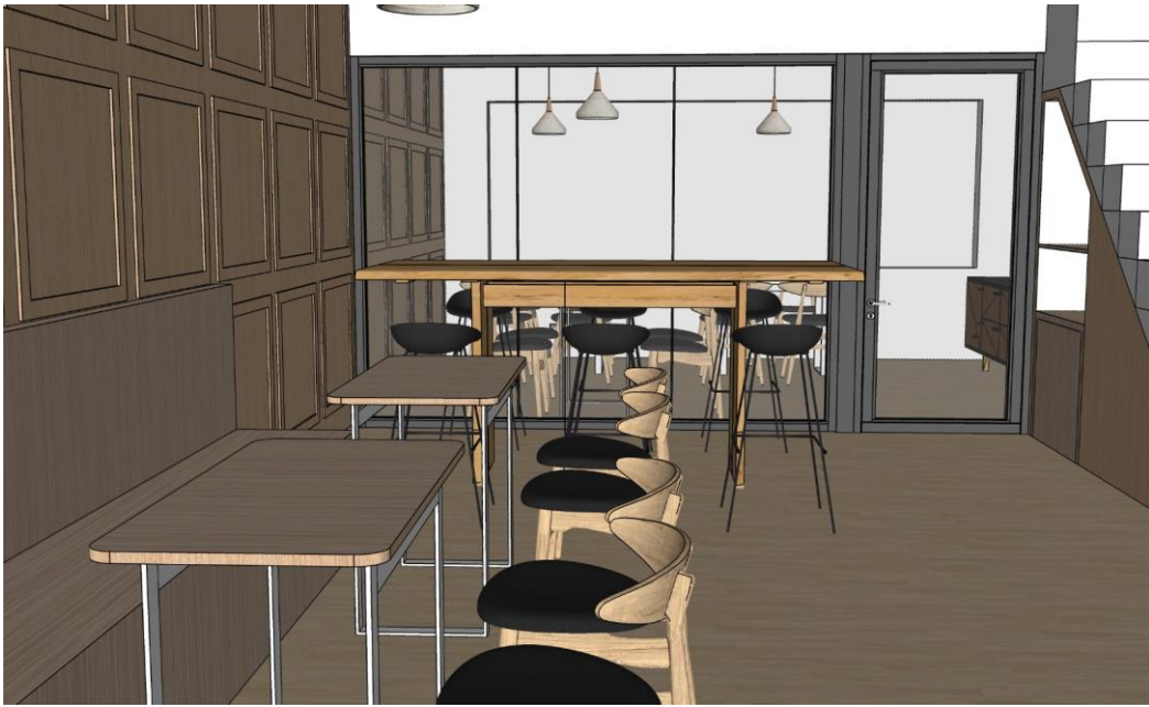
Gambar Perspektif Lantai Atas