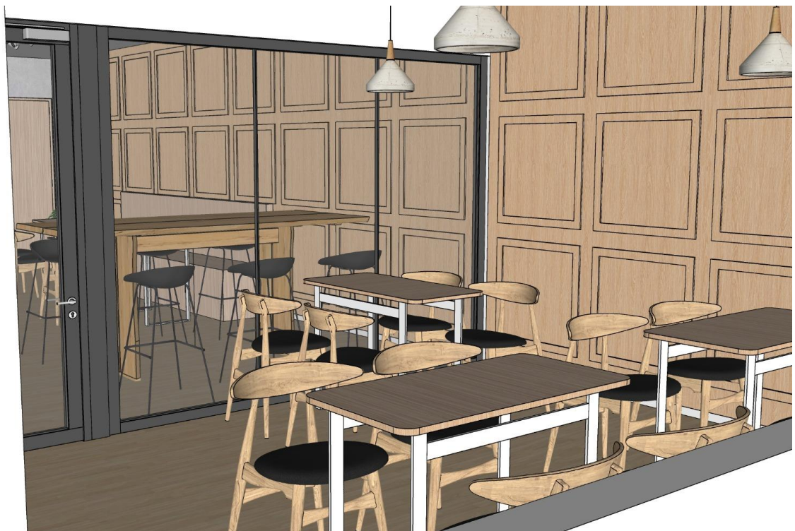
Gambar Perspektif Area Outdoor/Smoking Area