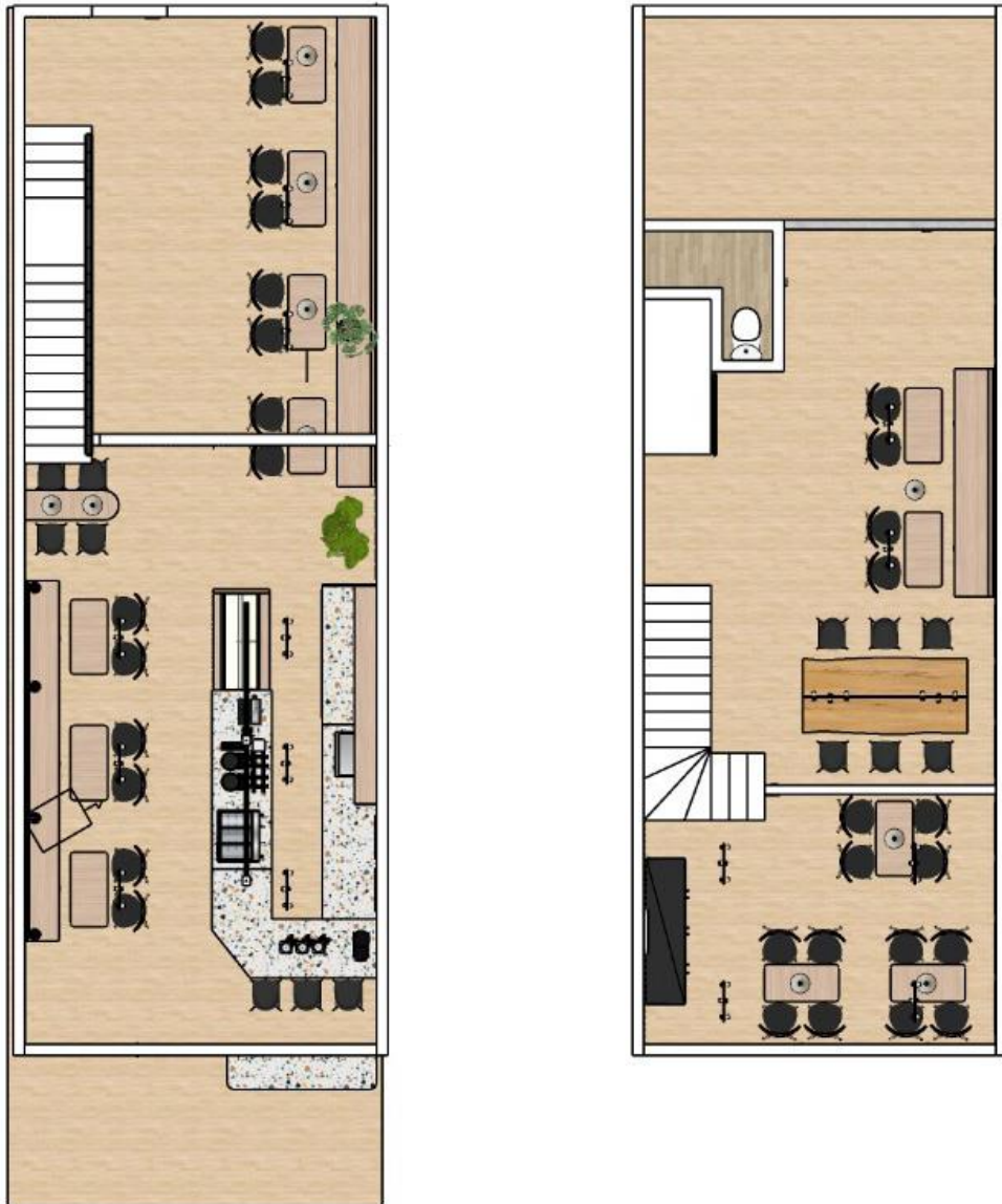
Denah Lantai Dasar dan Lantai Atas

Kapasitas : Lantai Dasar 32 Seat, Lantai Atas 28 Seat