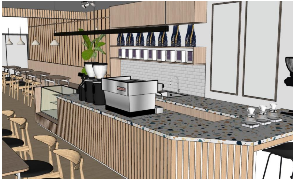
Gambar Perspektif Area Barista