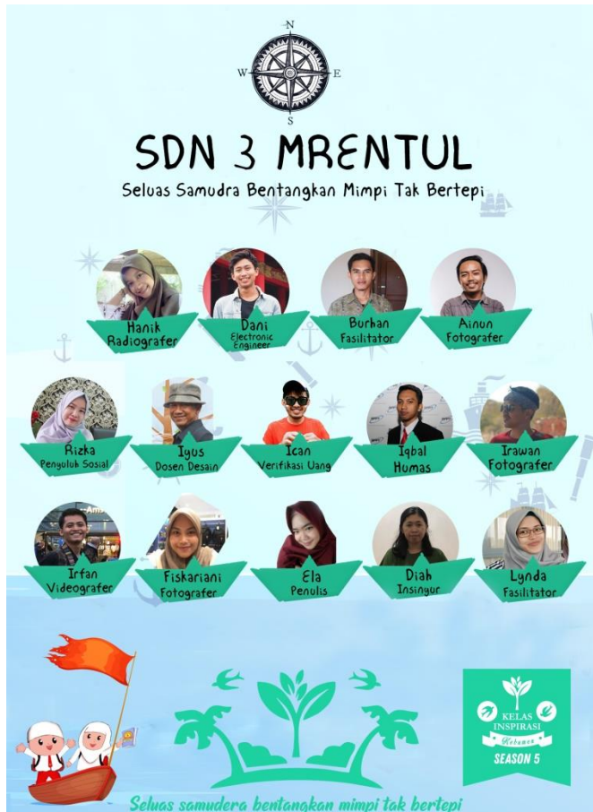
Desain poster pra event