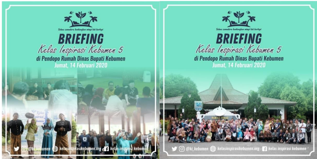
Suasana Briefing dan foto bersama seluruh relawan di pembukaan