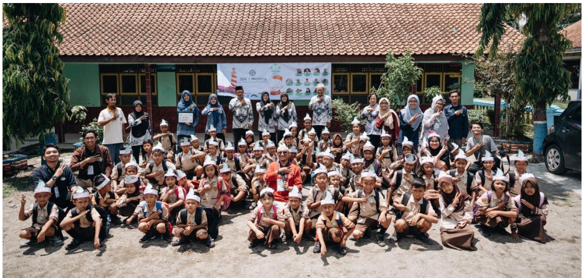
Foto bersama seluruh siswa, relawan dan guru-guru