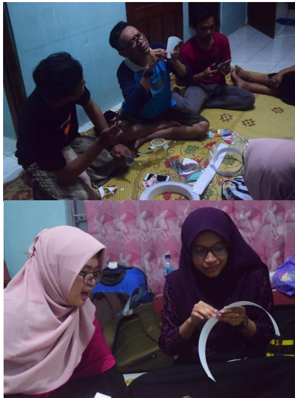
Persiapan di hari Briefing kelompok Mrentul Mantul, atribut-atribut kegiatan disiapkan untuk kegiatan esok harinya di Hari Inspirasi

Setelah dari briefing kita semua menuju lokasi sekolah yang akan kita beri inspirasi. Malam nya kita mempersiapkan atribut yang akan dipakai besok hari di penginapan yang sudah disepakati bersama di salah satu rumah tinggal guru SDN Mrentul 3 yaitu kediaman ibu Endang. Rumah ibu Endang kebetulan letaknya tidak jauh dari lokasi sekolah yang akan kita inspirasikan, jaraknya hanya 300 mtr persis di belakang sekolah namun untuk menuju sekolah kita harus memutar jalan dan pesawahan sekitar jarak 1,5 km.