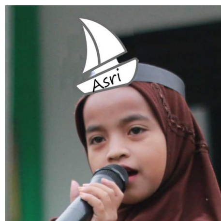
Desain Head Band siswa dan relawan