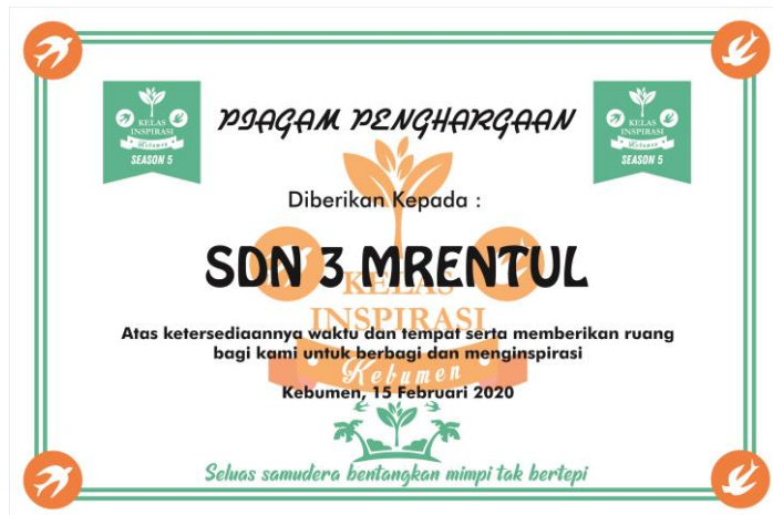
Desain Piagam kenang-kenangan ke sekolah