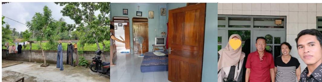
Survey ke lokasi tempat menginap untuk persiapan acara di salah satu rumah guru SDN