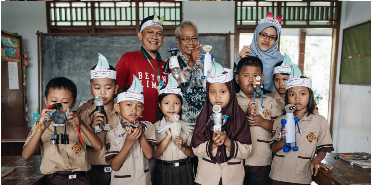
Memperkenalkan prinsip ‘manfaatkan yang ada’ , bahwa membuat karya tidak itu bisa murah , tidak mahal, bahan-bahannya bisa dari sampah yang bisa dijumpai di sekitar mereka