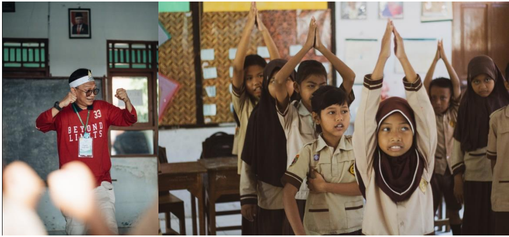
Pemberian ice breaking dan games untuk siswa kls 1 & 2 lebih efektif dan seru.