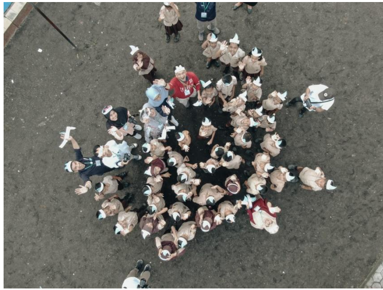
Foto bersama siswa