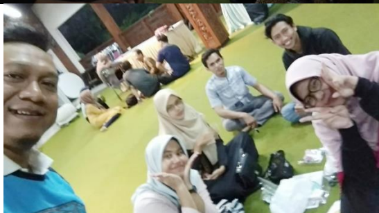
Suasana Briefing kelompok SDN Mrentul 3 (Mrentul mantul)