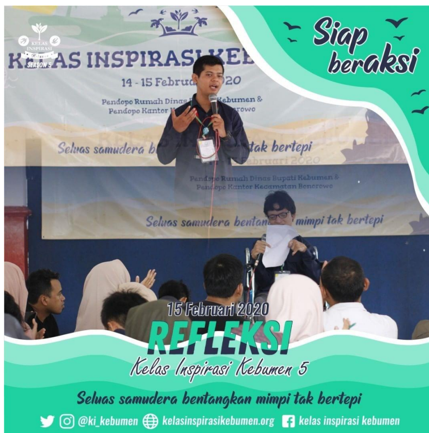
Suasana kegiatan refleksi Kelas Inspirasi Kebumen 5