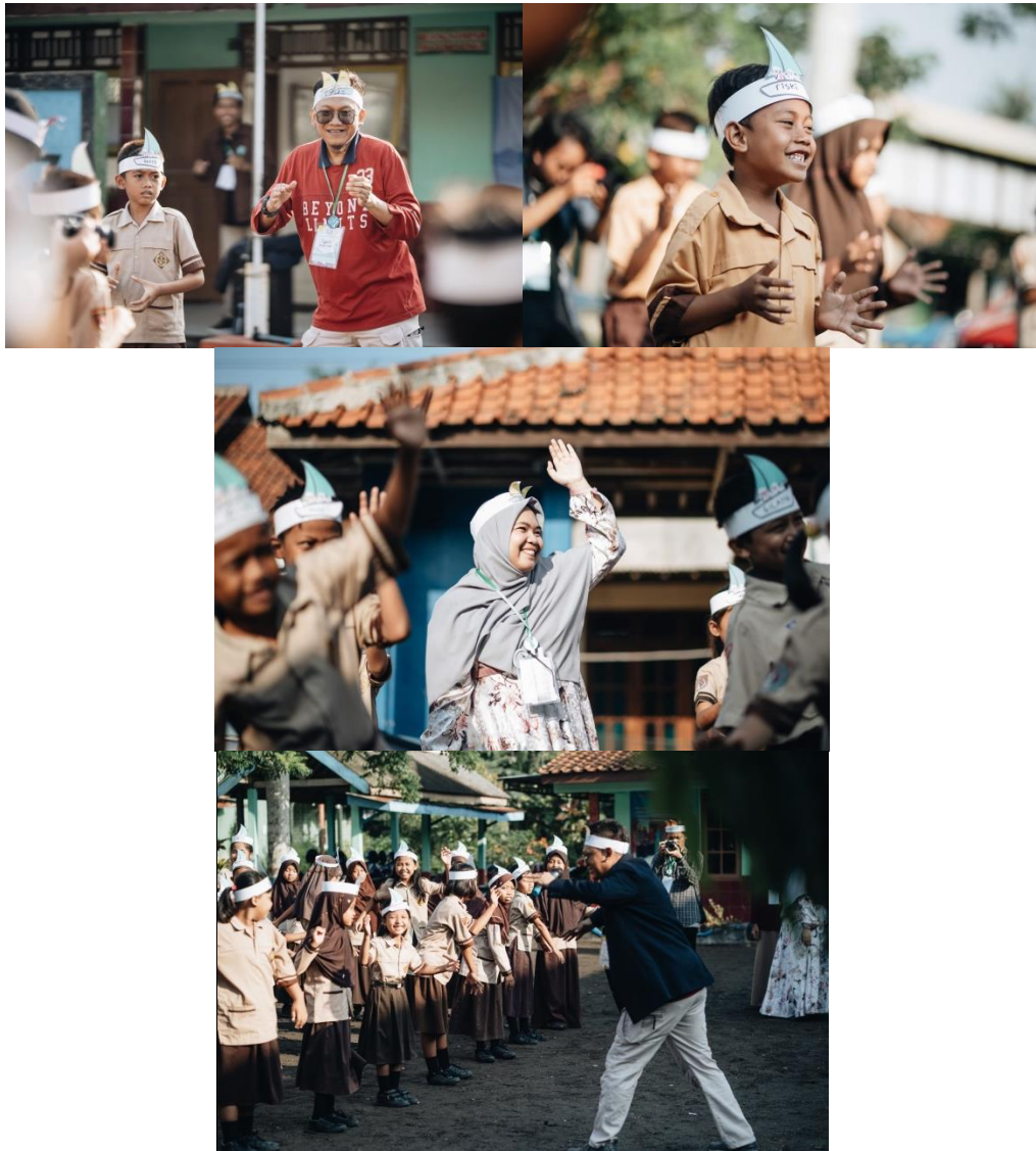
Ice Breaking dan penciptaan suasana sebelum masuk kelas perlu dilakukan untuk memudahkan kita mencairkan suasana dan memecah kebekuan saat memasuki kelas.