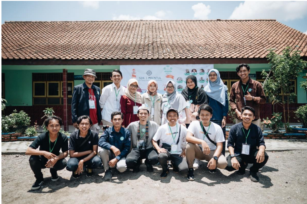
Foto bersama Team Relawan KI Kebumen #5 SDN Mrentul 3 & perwakilan panitia lokal