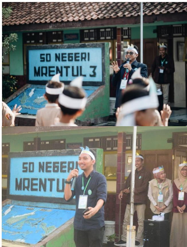
Suasana Opening Kelas Inspirasi Kebumen #5 kelompok Mrentul Mantul