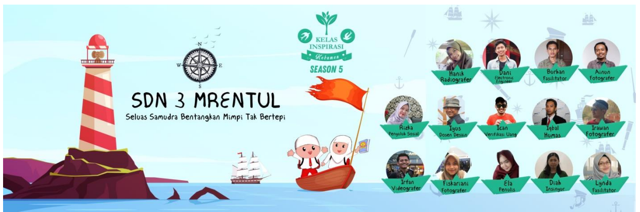
Desain Banner Kegiatan