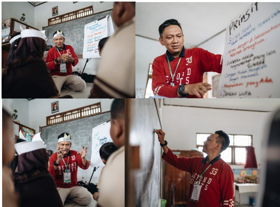
Memperkenalkan profesi dosen dan desainer kepada siswa siswi SD serta menanyakan apa cita cita mereka merupakan tantangan tersendiri