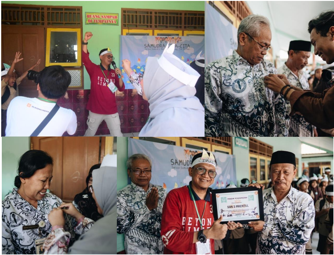
Suasana closing dan pemberian cinderamata kepada sekolah