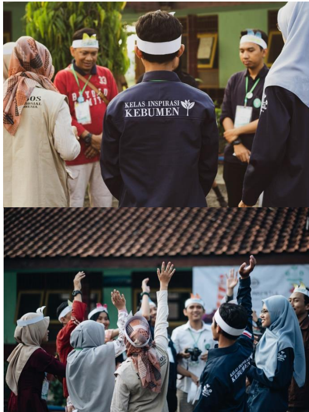
Suasana sebelum Opening Kelas Inspirasi Kebumen #5 kelompok Mrentul Mantul berdoa bersama dan ber'cheer up' pekik semangat kelompok untuk Hari Inspirasi