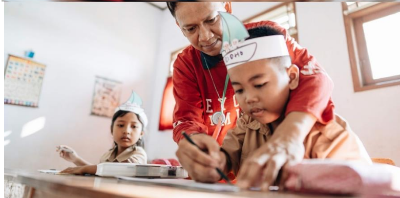
Workshop menggambar kecil-kecilan di Kelas Inspirasi bakat menggambar anak-anak sudah terlihat