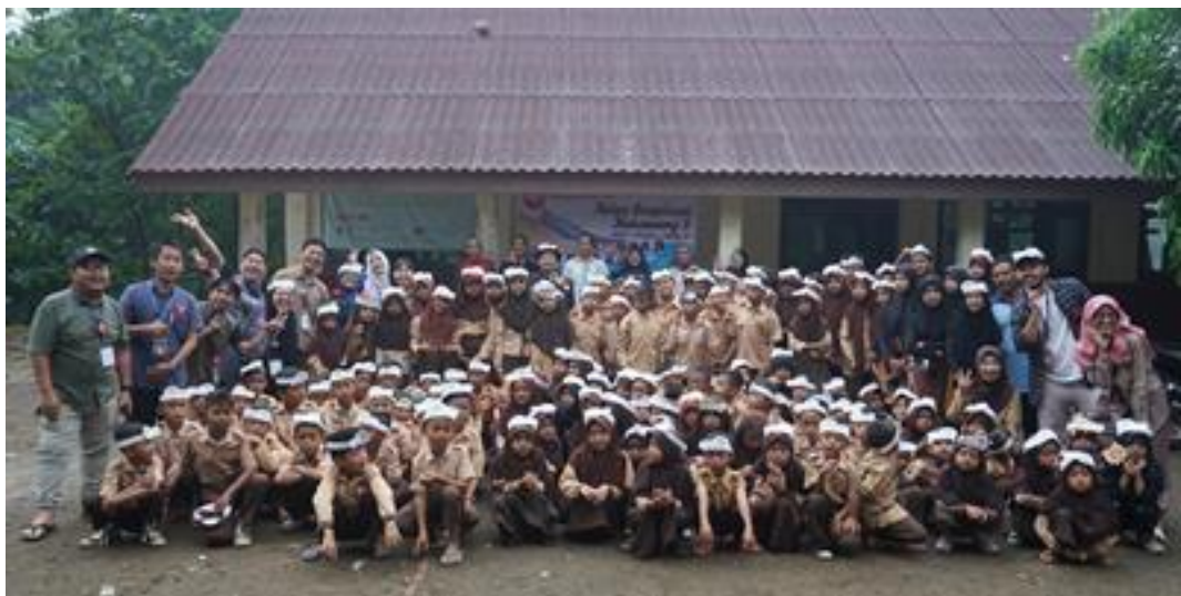
Gambar 23. Foto bersama seluruh siswa, relawan dan guru-guru