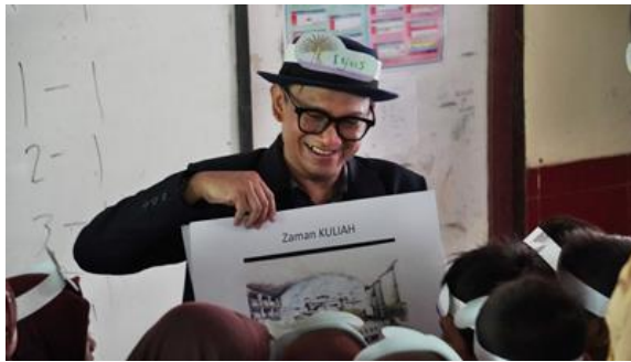
Gambar 16. Memperkenalkan profesi dosen dan desainer kepada siswa siswi SD serta menanyakan apa cita cita mereka merupakan tantangan tersendiri.