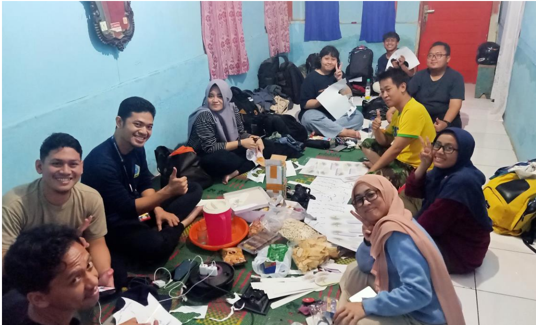
Gambar 11. Persiapan di hari minus 1 Rombel SDN Tegallega 2, atribut-atribut kegiatan disiapkan untuk kegiatan esok harinya di Hari Inspirasi

Setelah menghadiri briefing, Team yang hadir langsung menuju lokasi sekolah yang akan kita beri inspirasi. Malam nya kita mempersiapkan atribut yang akan dipakai besok hari di salah satu rumah guru yang kebetulan lokasinya dekat dengan sekolah.