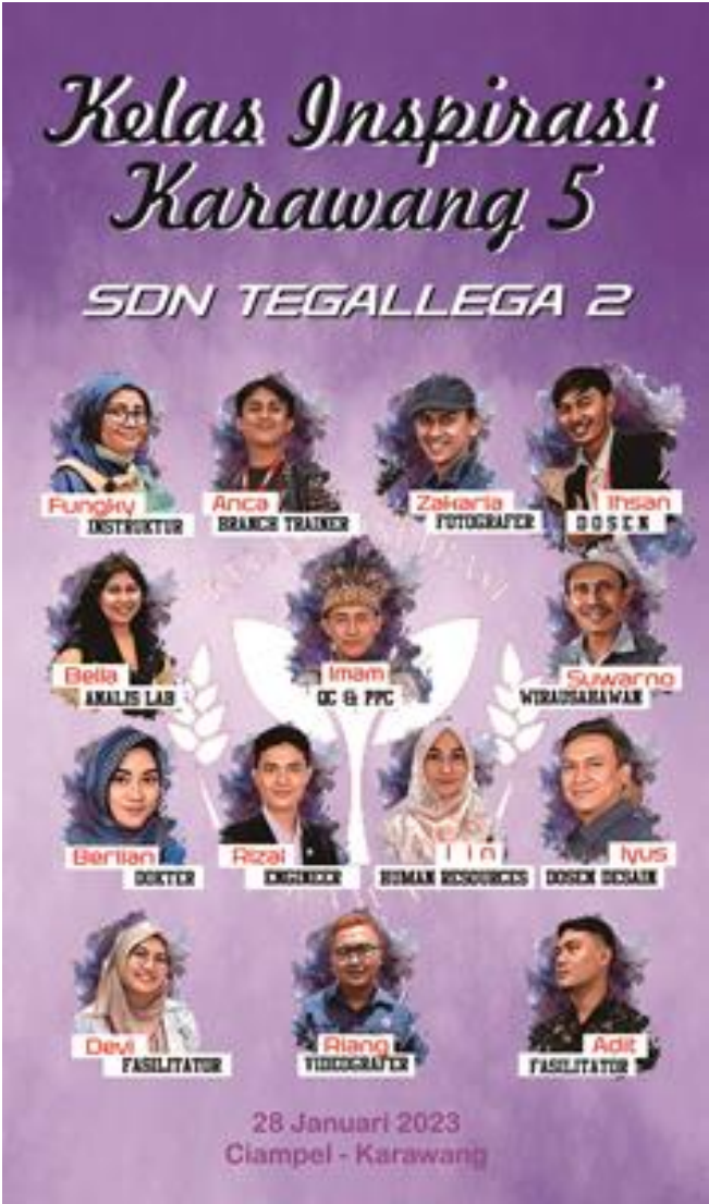
Gambar 2 .Desain poster pra event