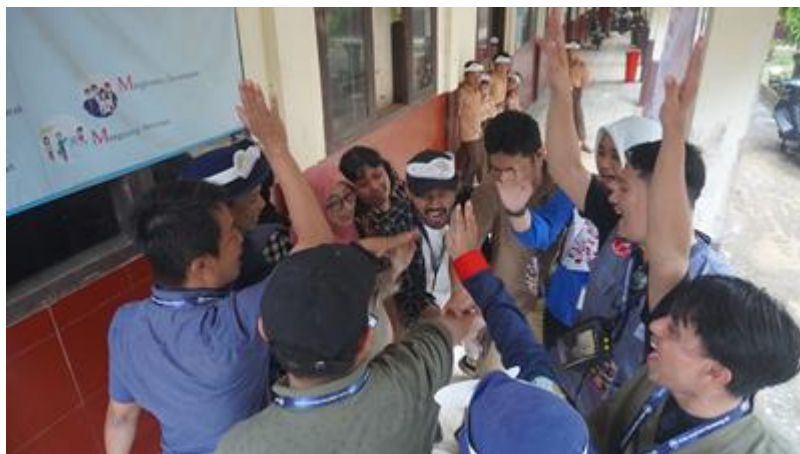
Gambar 12. Sebelum kegiatan , doa bersama dan briefing relawan untuk kesuksesan acara

Hari Inspirasi merupakan hari di mana waktu pelaksanaan seluruh kelompok menyampaikan inspirasi kelas berupa materi profesi nya masing-masing kepada anak-anak SD yang ditempatkan. Pada hari Sabtu , 28 Januari 2023, seluruh Hari Inspirasi “Kelas Inspirasi Karawang #5” serentak dilaksanakan. Di SDN Tegallega 2, Ciampel – Karawang tempat hari insiprasi dilaksanakan tercatat sebanyak 151 siswa yang hadir di acara ini, juga dihadiri oleh hampir seluruh guru-guru yang mendukung dan antusias ingin melihat pelaksanaan Hari Inspirasi.