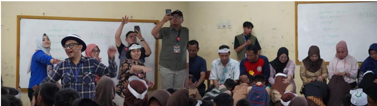
Gambar 21. Suasana penutupan ice breaking dan pembacaan puisi serta salam hormat dari siswa ke guru