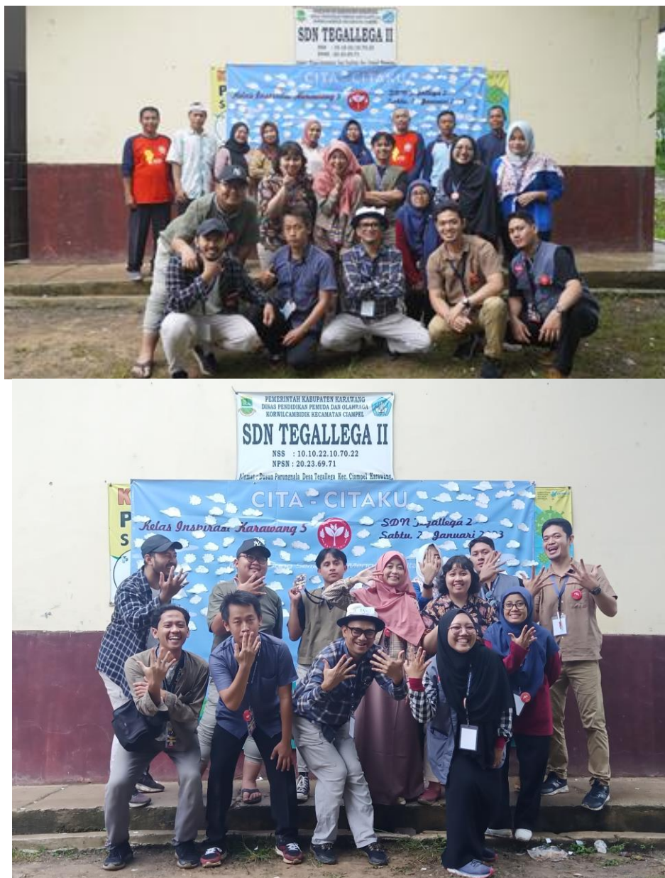
Gambar 24. Foto bersama Team Relawan KI Kelas Inspirasi Karawang 5 SDN Tegallega 2