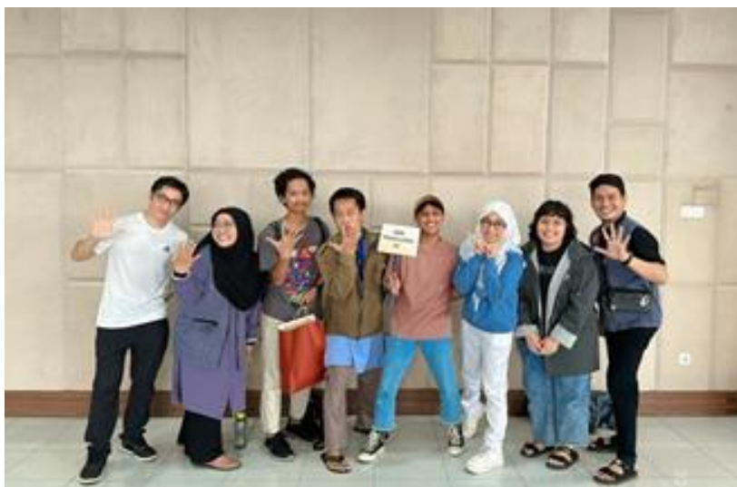
Gambar 10. Suasana Briefing Klarifikasi seluruh relawan

Briefing dilakukan bersama-sama relawan-relawan lainnya dilakukan langsung pada tanggal 22 Januari 2023. Briefing ini dilakukan untuk mempertemukan seluruh relawan dan persiapan jelang hari Inspirasi. Ajang briefing ini juga adalah momen pertama kalinya bertemu langsung seluruh relawan yang biasanya bertemu via virtual grup Whatsapp .