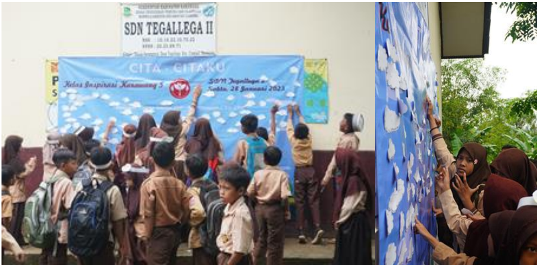
Gambar 20. Penempelan Awan Cita-cita oleh siswa-siswi SDN Tegeallega 2