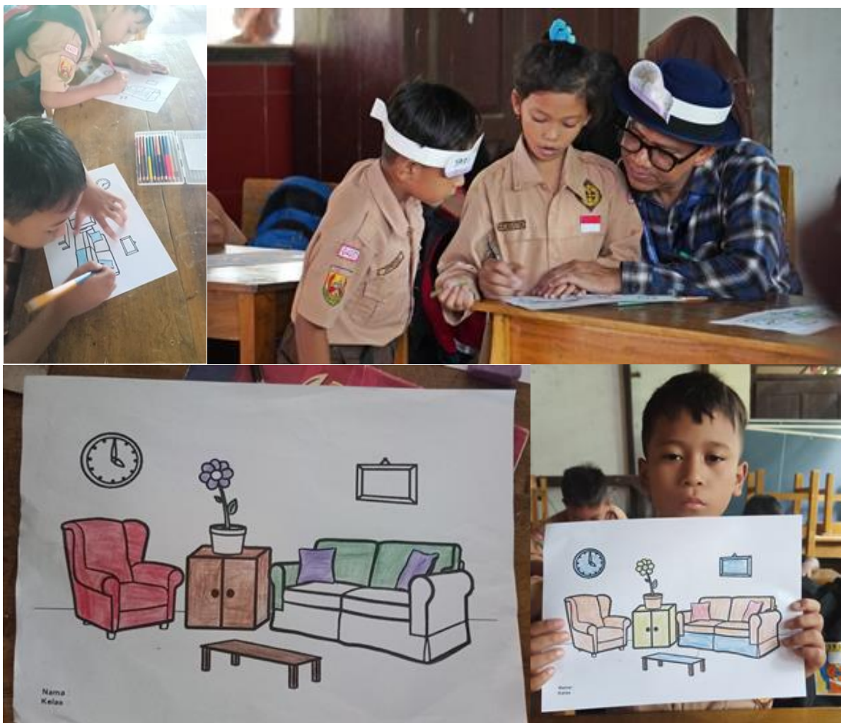
Gambar 18. Workshop mewarnai interior sederhana di Kelas Inspirasi bakat menggambar anak-anak di SDN Tegallega 2sudahterlihat