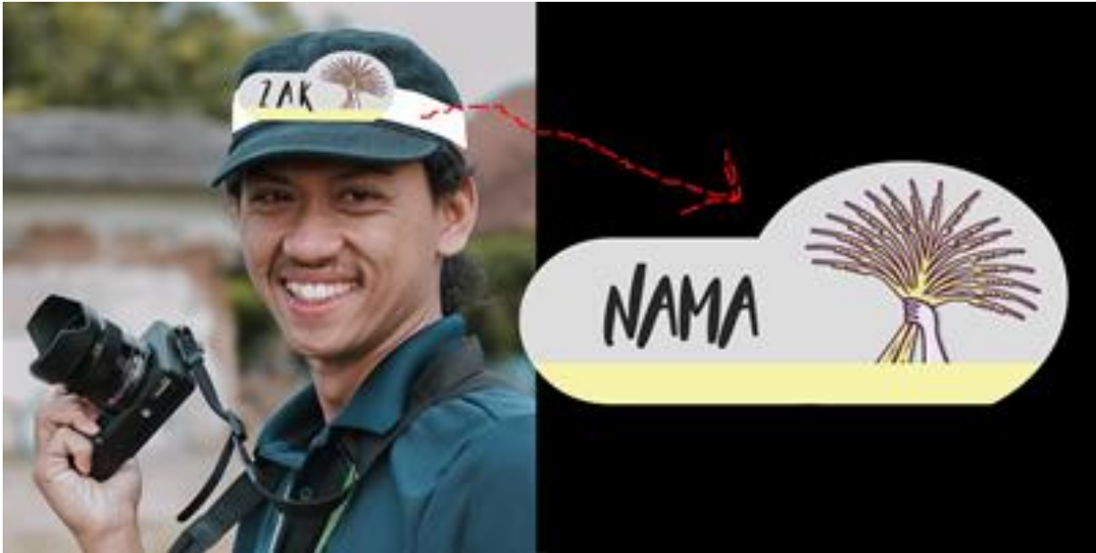
Gambar 3 .Desain Head Band siswa dan relawan