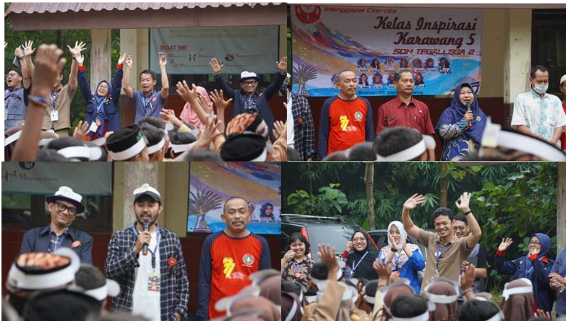
Gambar 14. Suasana Opening Kelas Inspirasi Karawang #5 SDN Tegallaga 2