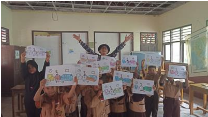
Gambar 19. Foto bersama siswa setelah workshop kilat menggambar