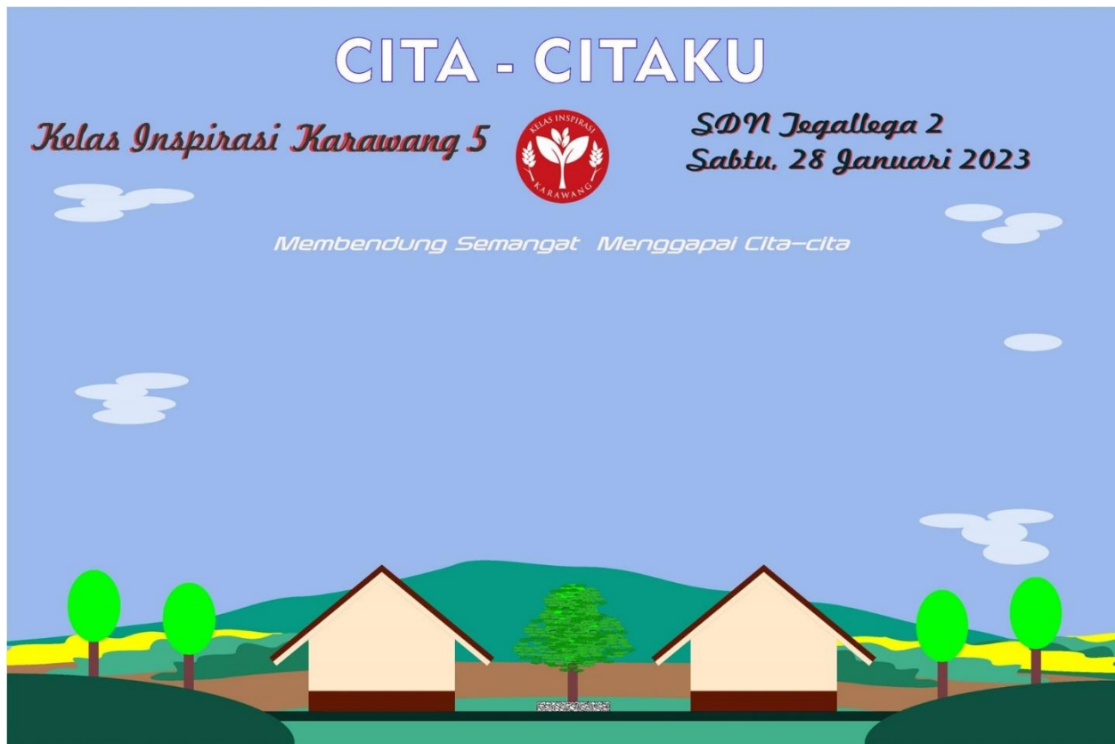
Gambar 7. Desain Banner Penempelan Awan Cita-cita