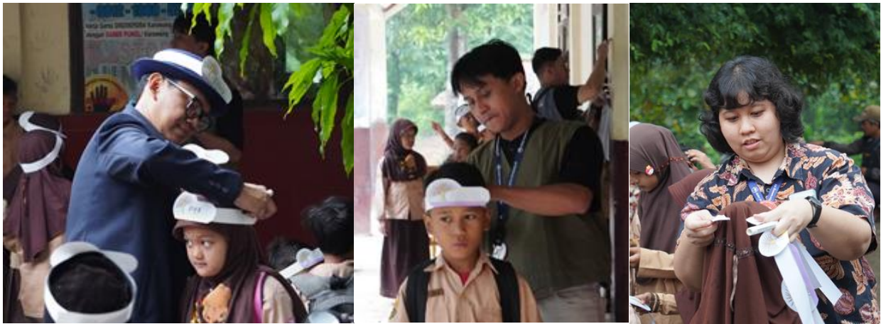
Gambar 13. Sebelum kegiatan siswa diberikan head band sebagai tanda pengenalan di Hari Inspirasi