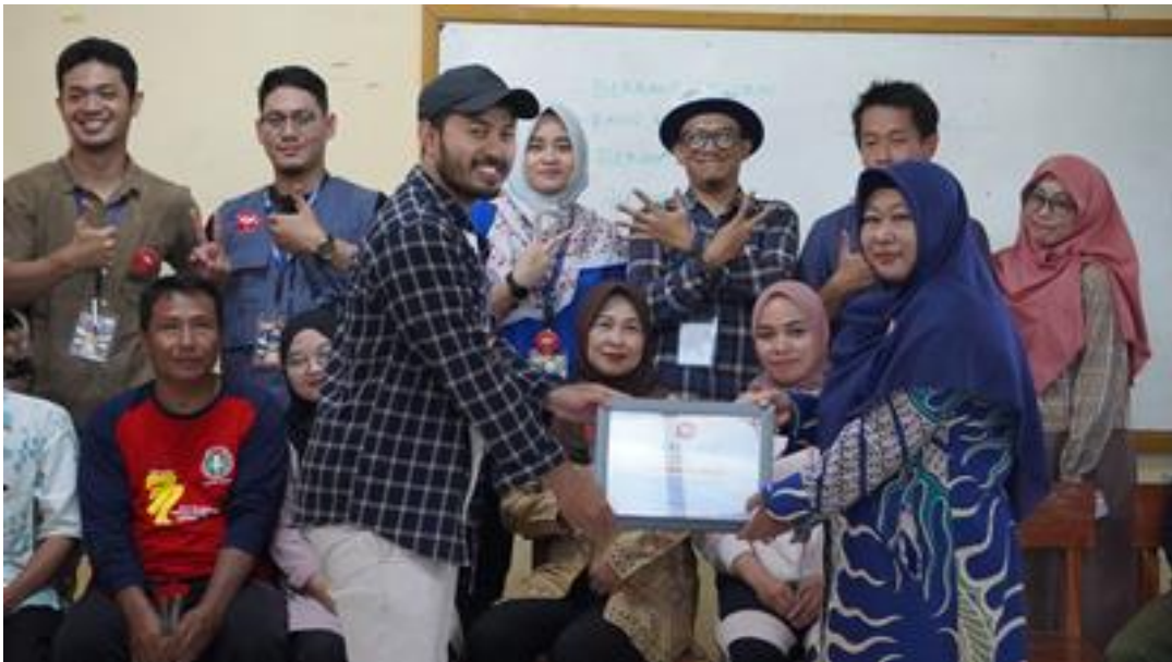
Gambar 22. Pemberian cinderamata kepada sekolah