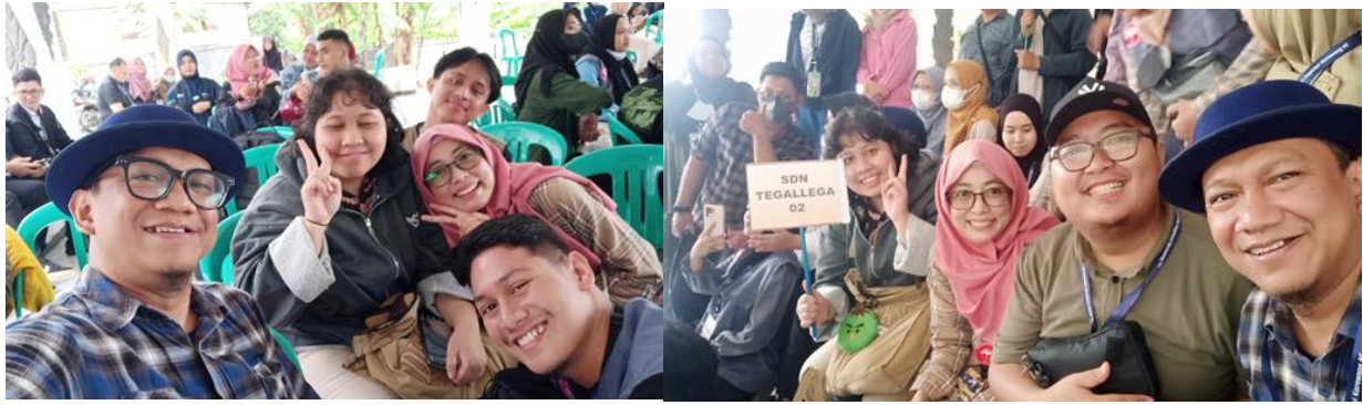
Gambar 24. Suasana kegiatan refleksi Kelas Inspirasi Karawang 5