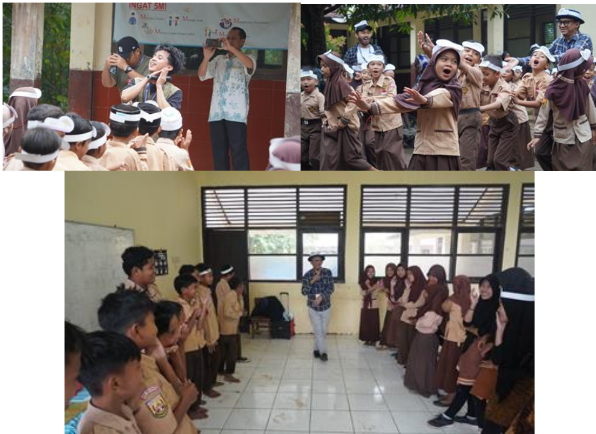
Gambar 15. Ice Breaking dan penciptaan suasana sebelum kegiatan inti untuk mencairkan suasana dan memecah kebekuan saat berikutnya memasuki kelas.