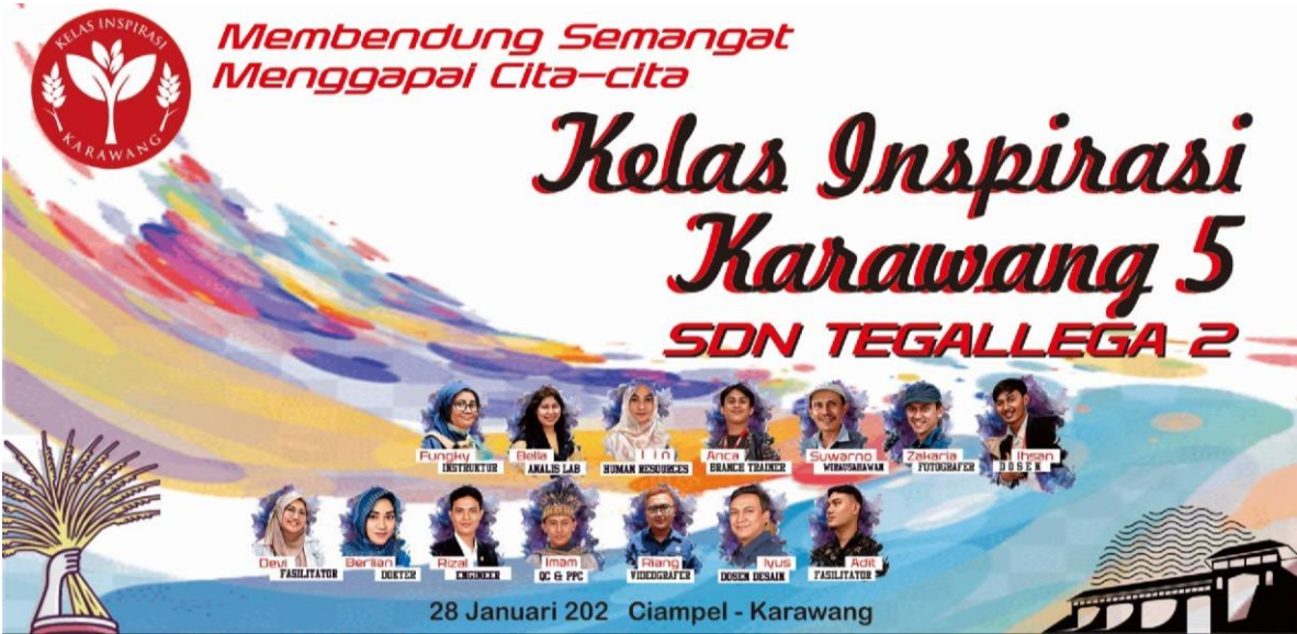
Gambar 6. Desain Banner Kegiatan