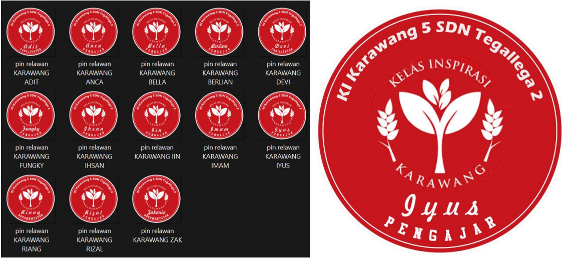
Gambar 5. Desain Pin Relawan