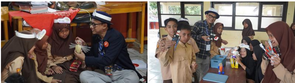
Gambar 17. Memperkenalkan prinsip „memanfaatkan apa yang ada” ,bagaimana membuat karya bisa murah ,tidak mahal, bahan-bahannya bisa dari sampah yang bisa dijumpai di sekitar mereka