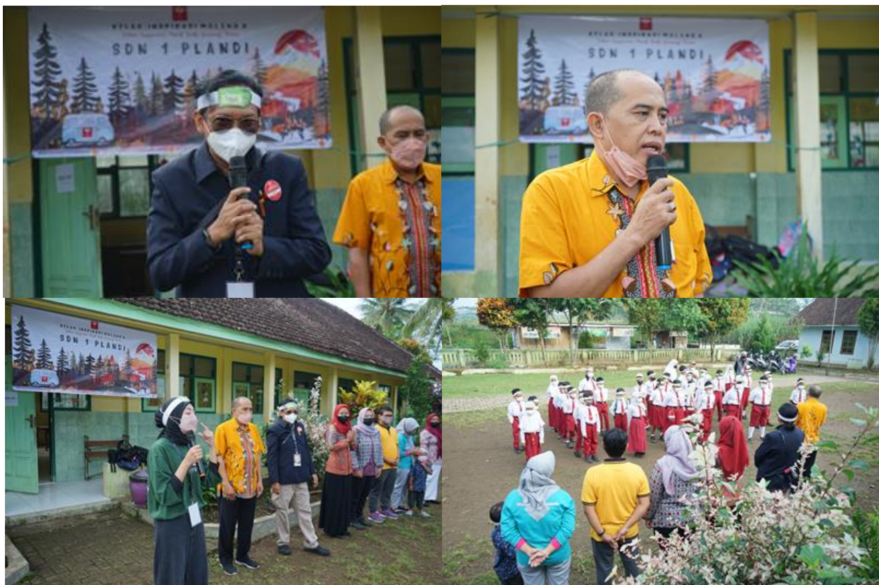
Gambar 15. Suasana Opening Kelas Inspirasi Malang #8 Rombel #140 SDN 1 Plandi