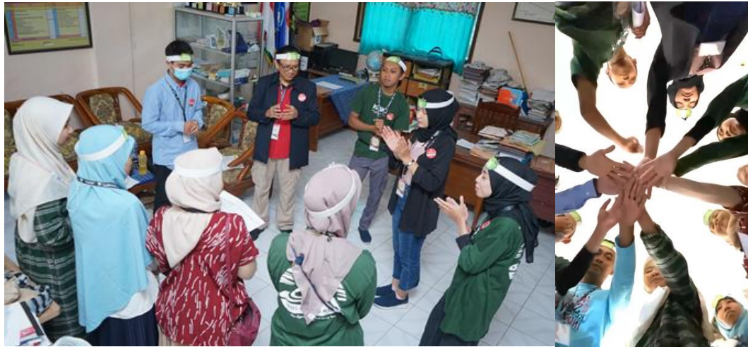
Gambar 13. Suasana sebelum Opening Kelas Inspirasi Malang #8 Rombel #140 SDN 1 Plandi berdoabersama dan ber“cheer up” pekik semangat kelompok untuk Hari Inspirasi

Sebelum acara dimulai , siswa yang hadir diberikan masker , hand sanitizer dan tanda pengenal berupa head band bertuliskan nama mereka yang ditulis oleh kami.