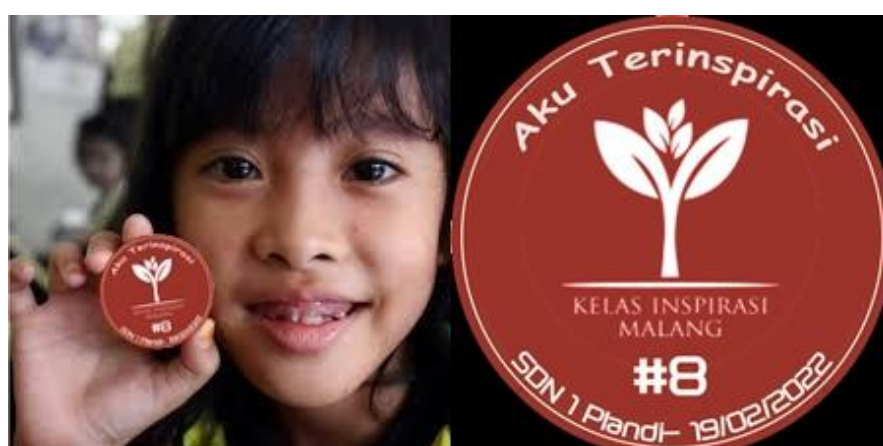
Gambar 3. Desain pin kenang-kenangan untuk siswa dan guru