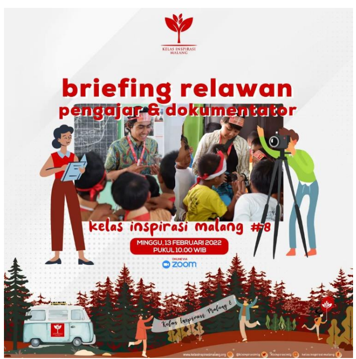
Gambar 8. Suasana Briefing seluruh relawan

Setelah briefing online, masing-masing kelompok melanjutkan lagi persiapan untuk hari Inspirasi yang rencananya akan dilaksanakan tanggal 19 Februari 2022.