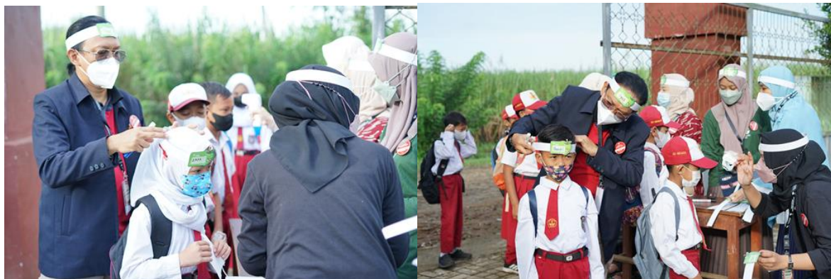
Gambar 14. Suasana Pembagian Head band sebagai tanda pengenal dan peserta Kelas Inspirasi SDN 1 Plandi

Sebelum acara dimulai , siswa yang hadir diberikan masker , hand sanitizer dan tanda pengenal berupa head band bertuliskan nama mereka yang ditulis oleh kami.