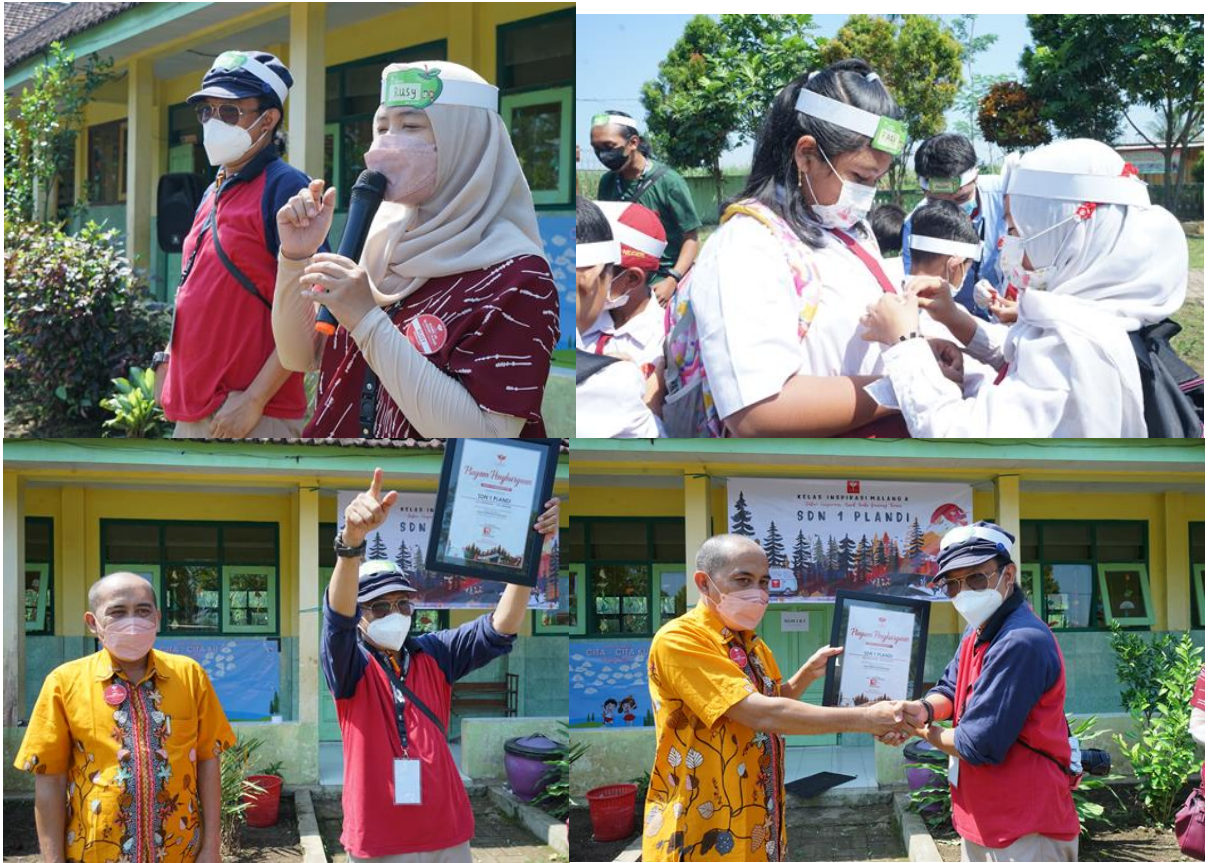
Gambar 20. Suasana closing dan pemberian cinderamata kepada sekolah