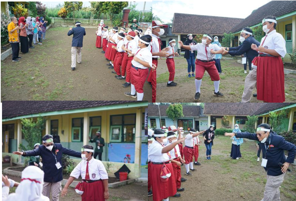
Gambar 16. Ice Breaking dan penciptaan suasana sebelum masuk kelas perlu dilakukan untuk memudahkan kita mencairkan suasana dan memecah kebekuan saat memasuki kelas.