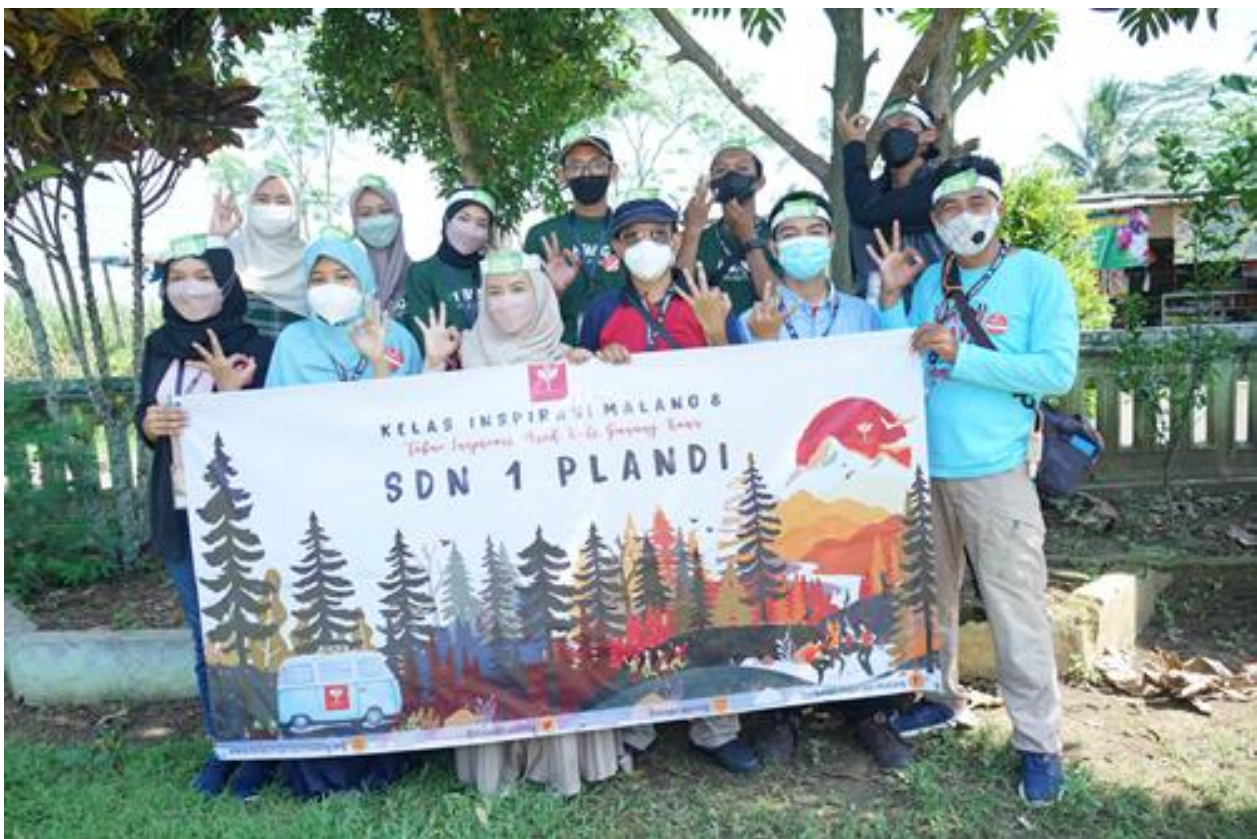
Gambar 23. Foto bersama Team Relawan KI Kelas Inspirasi Malang 8 Rombel #140 SDN 1 Plandi