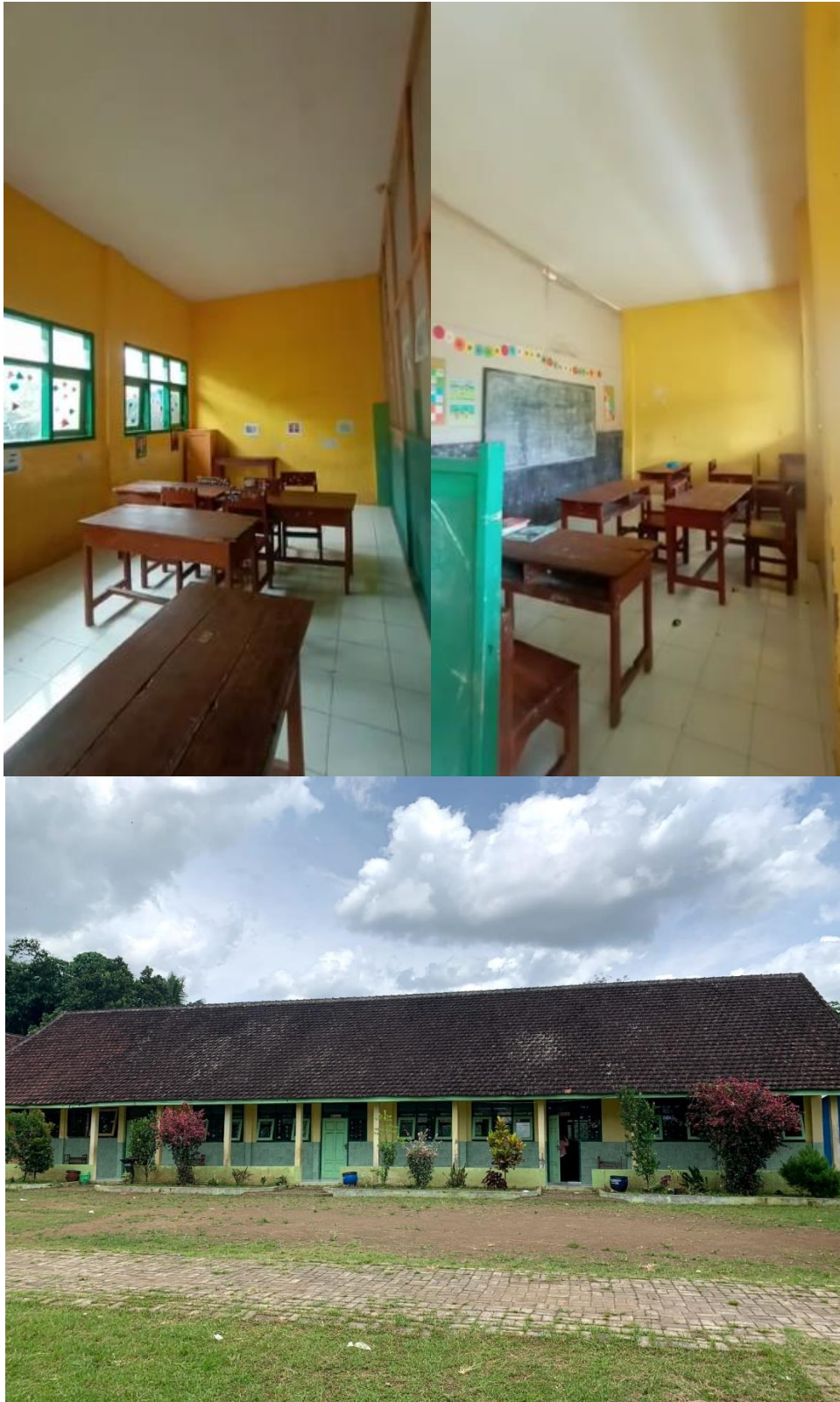
Gambar 6. Survey ke lokasi sekolah SDN 1 Plandi, mengecek kondisi sekolah sebagai data untuk mengkonsep acara pembukaan penutupan dan konsep seluruh acara pada Hari Inspirasi

Dari survey SDN 1 Plandi yang dilakukan pada kisaran waktu tanggal 10 Februari 2022 terdapat data yang bisa diambil Jumlah ruangan kelas 5, Jumlah siswa total 42 orang