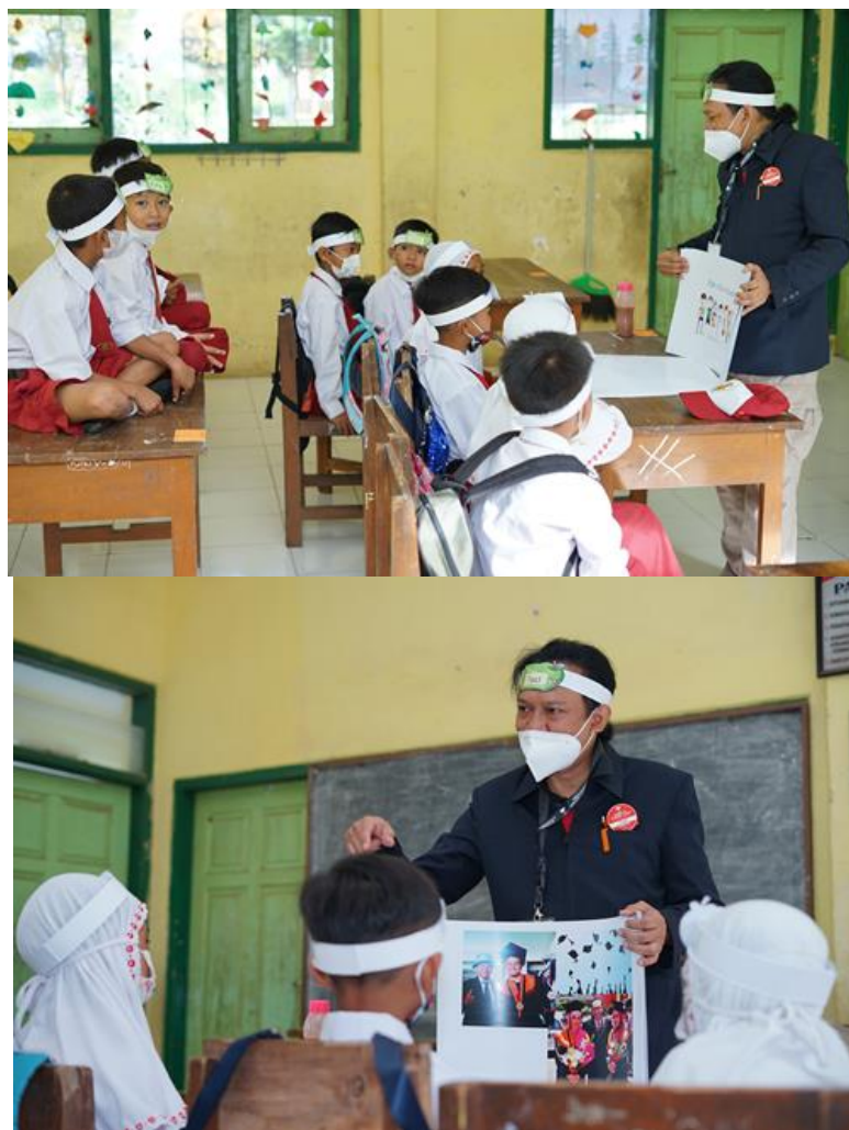
Gambar 17. Memperkenalkan profesi dosen dan desainer kepada siswa siswi SD serta menanyakan apa cita cita mereka merupakan tantangan tersendiri.