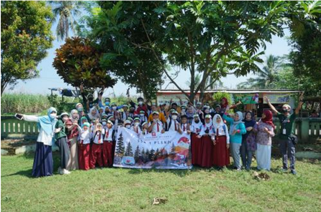
Gambar 22. Foto bersama seluruh siswa, relawan dan guru-guru