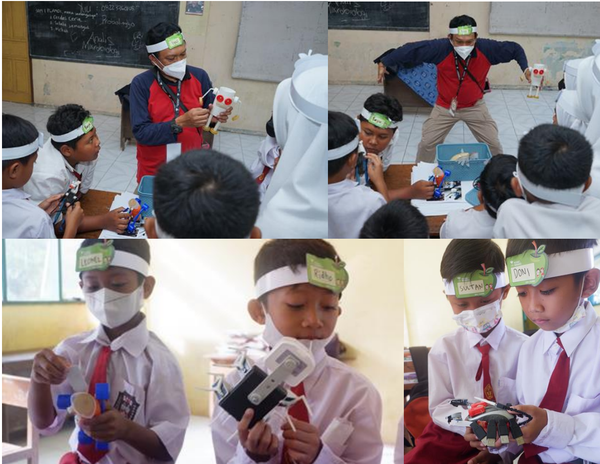
Gambar 18. Memperkenalkan prinsip „manfaatkan yang ada” , bahwa membuat karya tidak itu bisa murah ,tidak mahal, bahan-bahannya bisa dari sampah yang bisa dijumpai di sekitar mereka