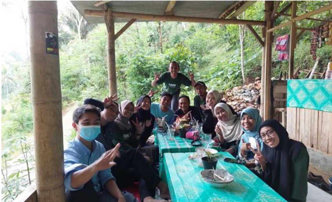
Gambar 24. Suasana kegiatan refleksi Kelas Inspirasi Malang 8 Rombel #140