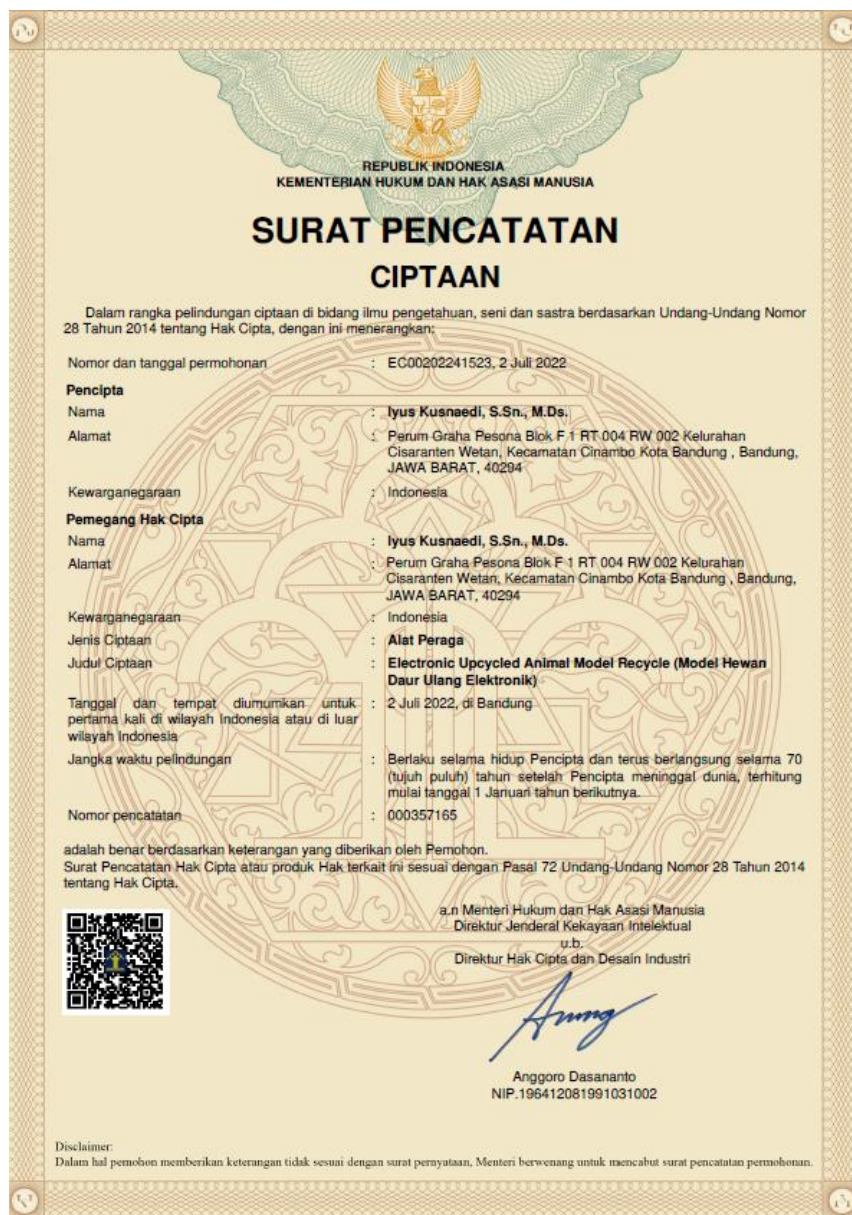
Gambar 25. Surat Pencatatan Penciptaan Alat Peraga

Pada Kelas Inspirasi kali ini bisa mengajukan E-Haki berupa Alat peraga dan sudah terbit per tanggal 2 Juli 2022, berikut bukti Sertifikat Hak Cipta nya :