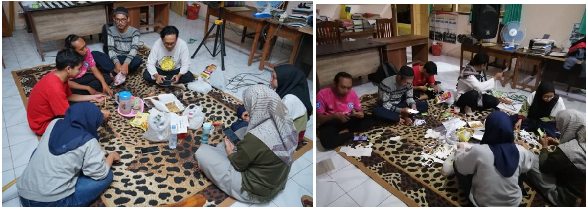
Gambar 12. Persiapan di hari minus 1 Rombel #140 SDN 1 Plandi, atribut-atribut kegiatan disiapkan untuk kegiatan esok harinya di Hari Inspirasi

Pada H minus satu, relawan dari luar kota mulai berdatangan ke Malang. Rombel #140 . Sebagian langsung menuju lokasi sekola yang akan kita beri inspirasi. Malam nya kita mempersiapkan atribut yang akan dipakai besok hari di bangunan sekolah.