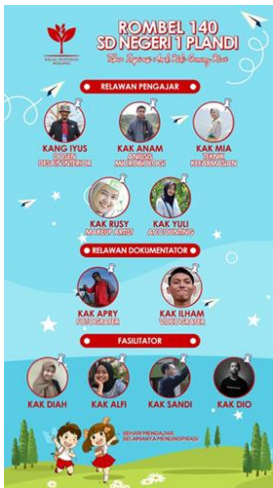
Gambar 1 .Desain poster pra event