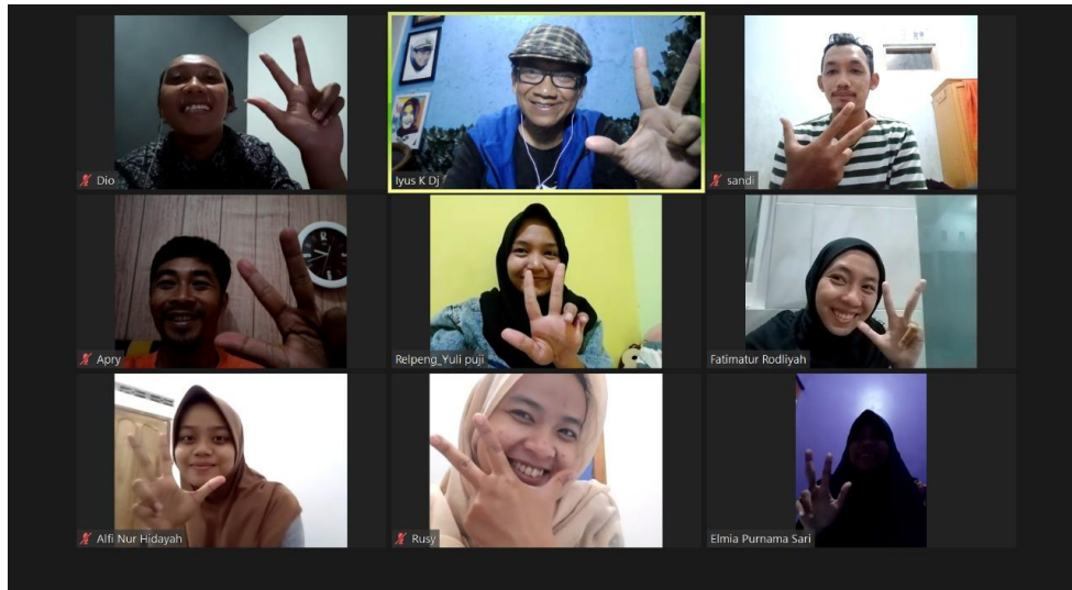
Gambar 11. Suasana Briefing Rombel 140 di zoom meet

Pada H minus satu, relawan dari luar kota mulai berdatangan ke Malang. Rombel #140 . Sebagian langsung menuju lokasi sekola yang akan kita beri inspirasi. Malam nya kita mempersiapkan atribut yang akan dipakai besok hari di bangunan sekolah.