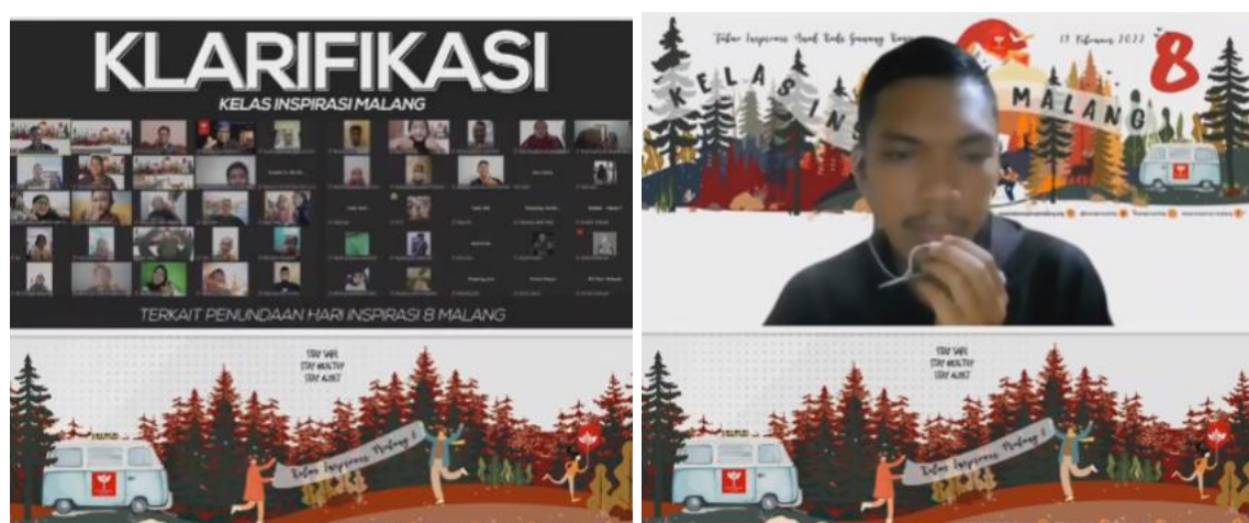
Gambar 10. Suasana Briefing Klarifikasi seluruh relawan