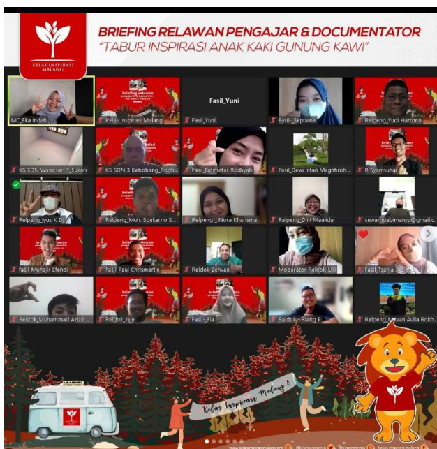
Gambar 9. Suasana Briefing Klarifikasi seluruh relawan