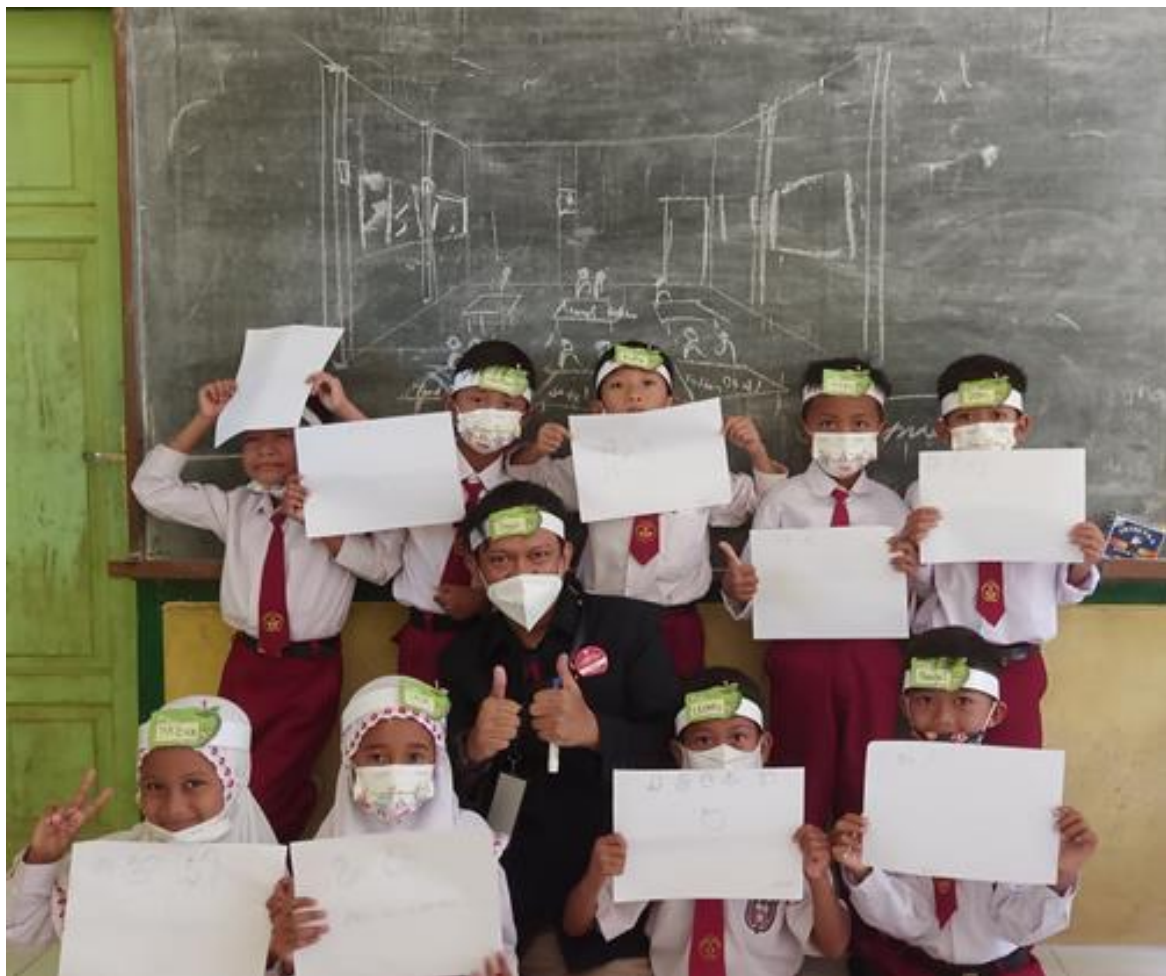
Gambar 21. Foto bersama siswa setelah workshop kilat menggambar