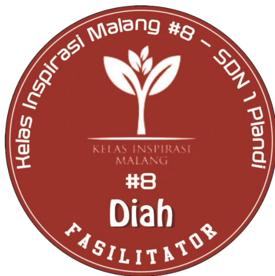
Gambar 4. Desain pin relawan