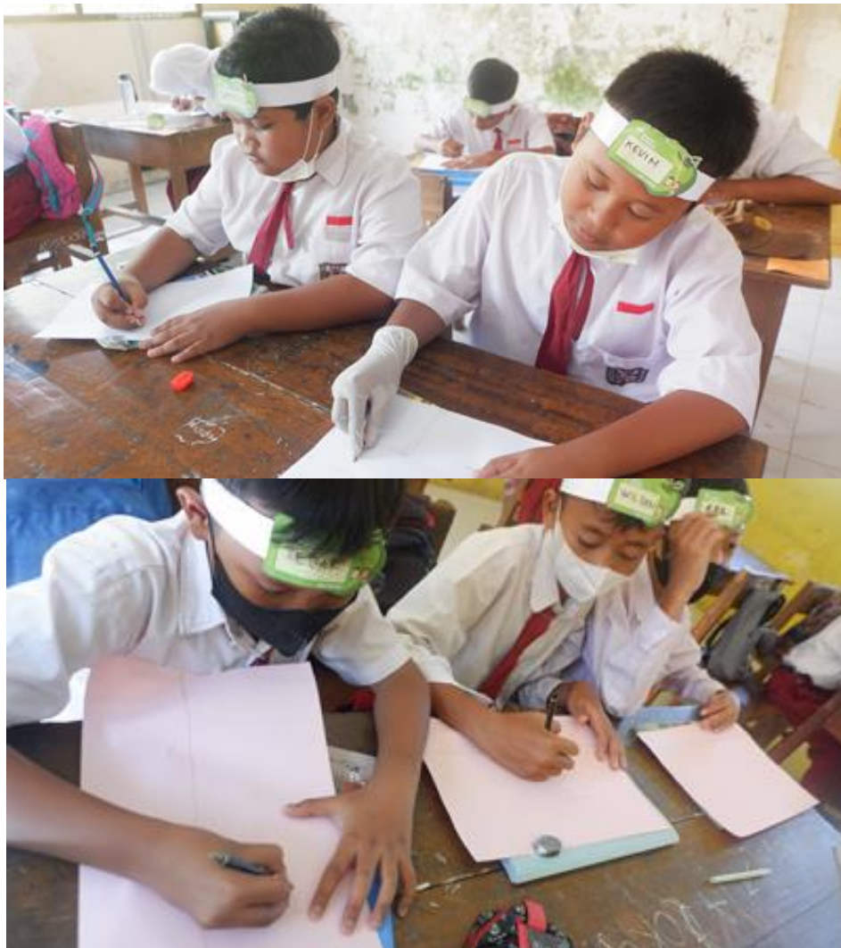
Gambar 19. Workshop menggambar kecil-kecilan di Kelas Inspirasi bakat menggambar anak-anak sudah terlihat