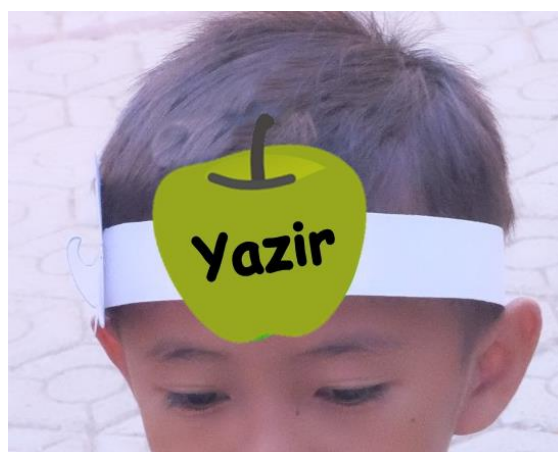
Gambar 2 .Desain Head Band siswa dan relawan