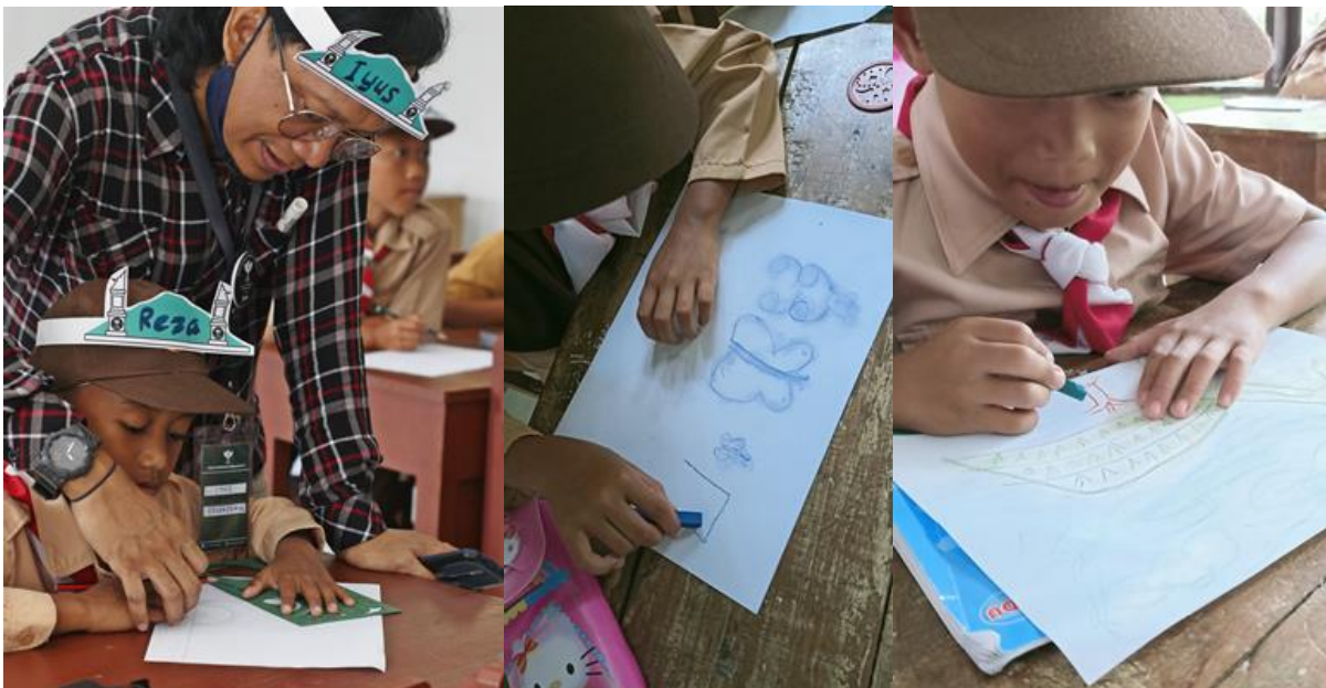
Gambar 18. Workshop menggambar kecil-kecilan di Kelas Inspirasi bakat menggambar anak-anak di SDN 3 Nangewer sudahterlihat