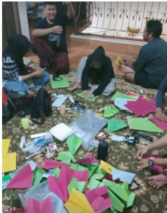
Gambar 12. Persiapan di hari minus 1 Rombel SDN 3 Nangewer, atribut-atribut kegiatan disiapkan untuk kegiatan esok harinya di Hari Inspirasi

Setelah menghadiri briefing, Team yang hadir langsung menuju lokasi sekolah yang akan kita beri inspirasi. Malam nya kita mempersiapkan atribut yang akan dipakai besok hari di salah satu rumah guru yang kebetulan lokasinya dekat dengan sekolah.