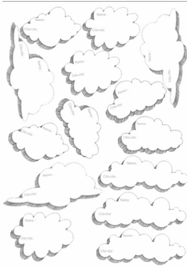
Gambar 4. Desain samudra cita-cita (media untuk menempelkan cita-cita)