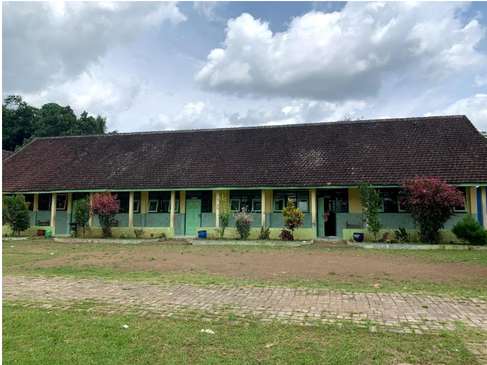
Gambar 6. Survey ke lokasi sekolah SDN 3 Nangewer, mengecek kondisi sekolah sebagai data untuk mengkonsep acara pembukaan penutupan dan konsep seluruh acara pada Hari Inspirasi

Dari survey SDN 3 Nangewer yang dilakukan pada kisaran waktu tanggal 15 Agustus 2022 terdapat data yang bisa diambil Jumlah ruangan kelas 6, Jumlah siswa total 157 orang.