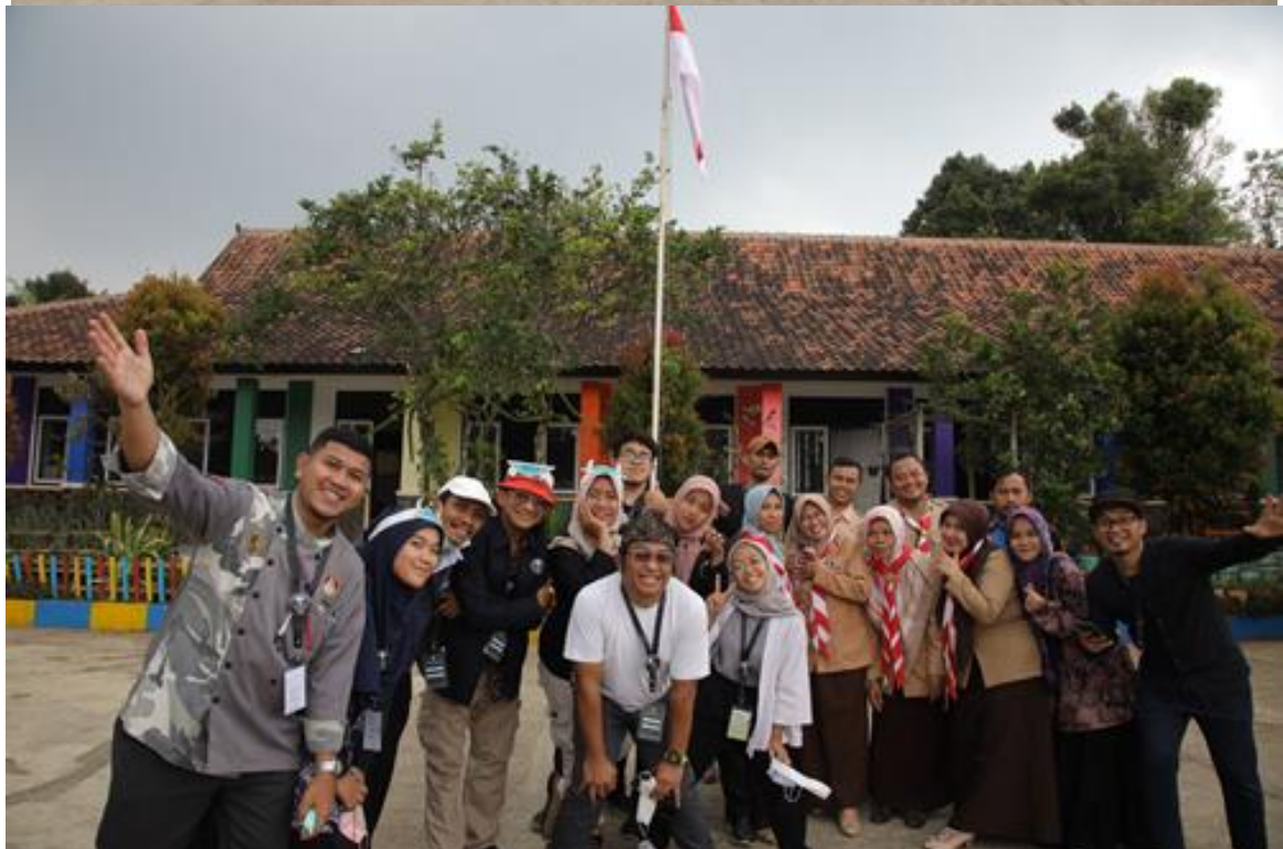
Gambar 24. Foto bersama Team Relawan KI Kelas Inspirasi Purwakarta 2 SDN 3 Nangewer