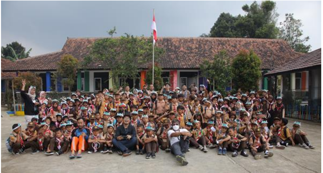
Gambar 23. Foto bersama seluruh siswa, relawan dan guru-guru