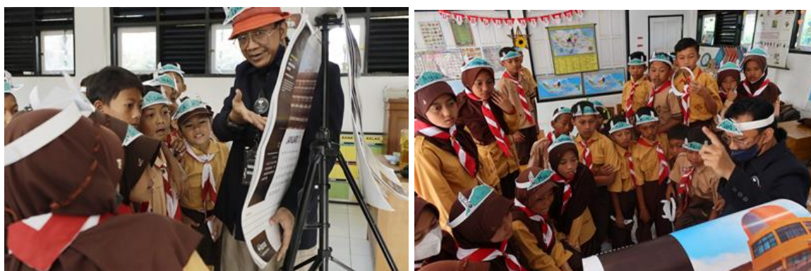
Gambar 16. Memperkenalkan profesi dosen dan desainer kepada siswa siswi SD serta menanyakan apa cita cita mereka merupakan tantangan tersendiri.