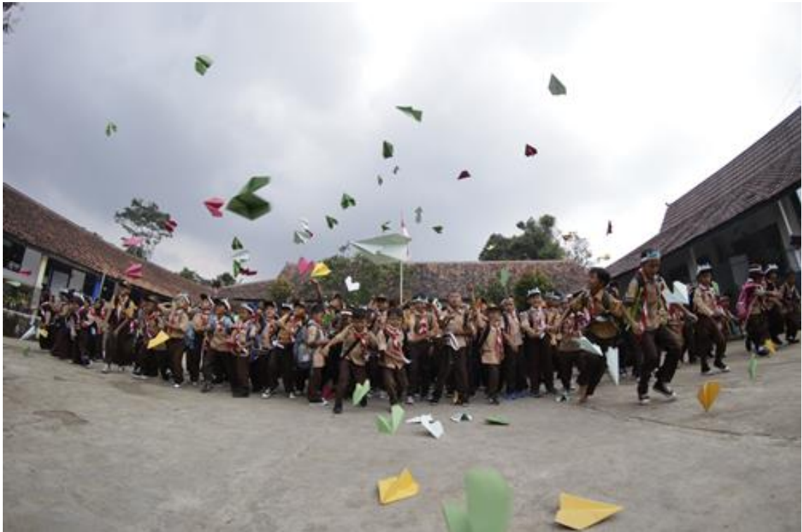
Gambar 21. Suasana penutupan hari inspirasi menerbangkan cita cita sebagai simbol anak-anak menerbangkan cita-citanya