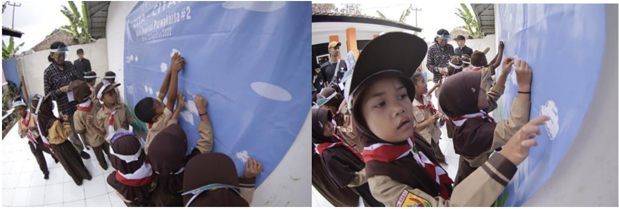
Gambar 20. Penempelan Awan Cita-cita oleh siswa-siswi SDN 3 Nangewer