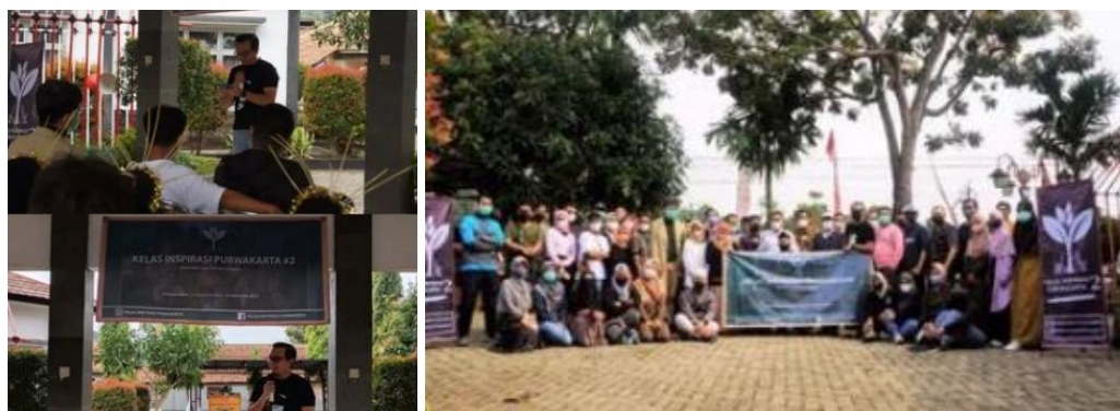
Gambar 9. Suasana Briefing Klarifikasi seluruh relawan

Briefing dilakukan bersama-sama relawan-relawan lainnya dilakukan langsung pada tanggal 21 Agustus 2022. Briefing ini dilakukan untuk mempertemukan seluruh relawan dan persiapan jelang hari Inspirasi. Ajang briefing ini juga adalah momen pertama kalinya bertemu langsung seluruh relawan yang biasanya bertemu via virtual grup Whatsapp .