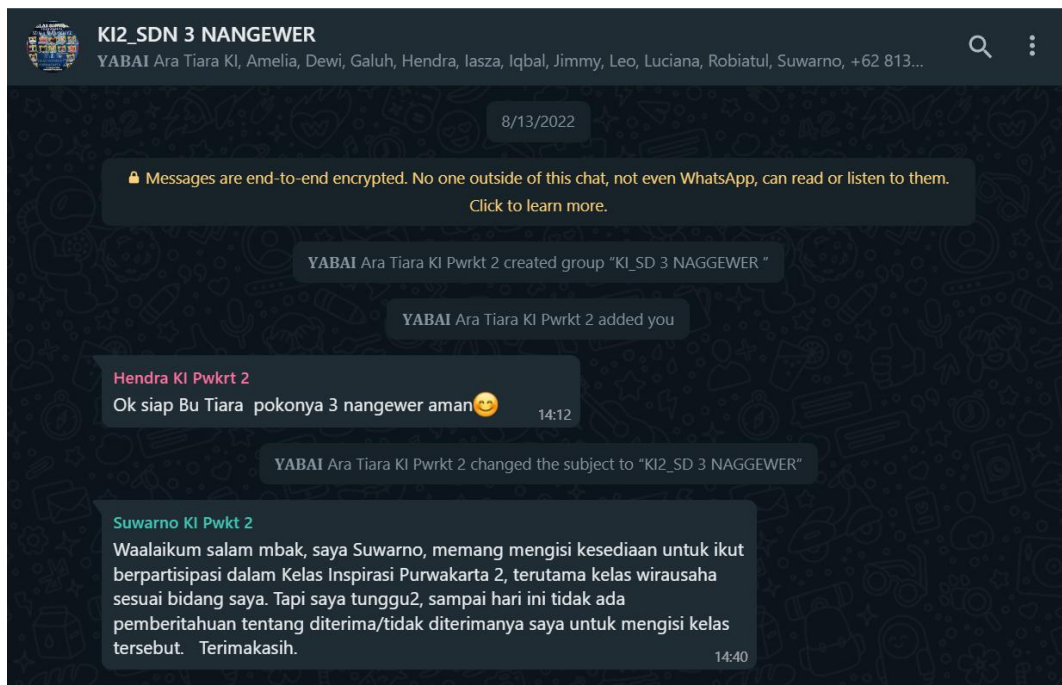
Gambar 1. Chat Grup Whatsapp

Sebelum dilakukan briefing langsung bertemu, terlebih dahulu kita menentukan ketua kelompok. Briefing kelompok dilakukan dalam forum media sosial chat Whatsapp (WA) untuk menentukan beberapa hal terkait persiapan dan struktur organisasi dalam hal menjalankan kelompok ini.