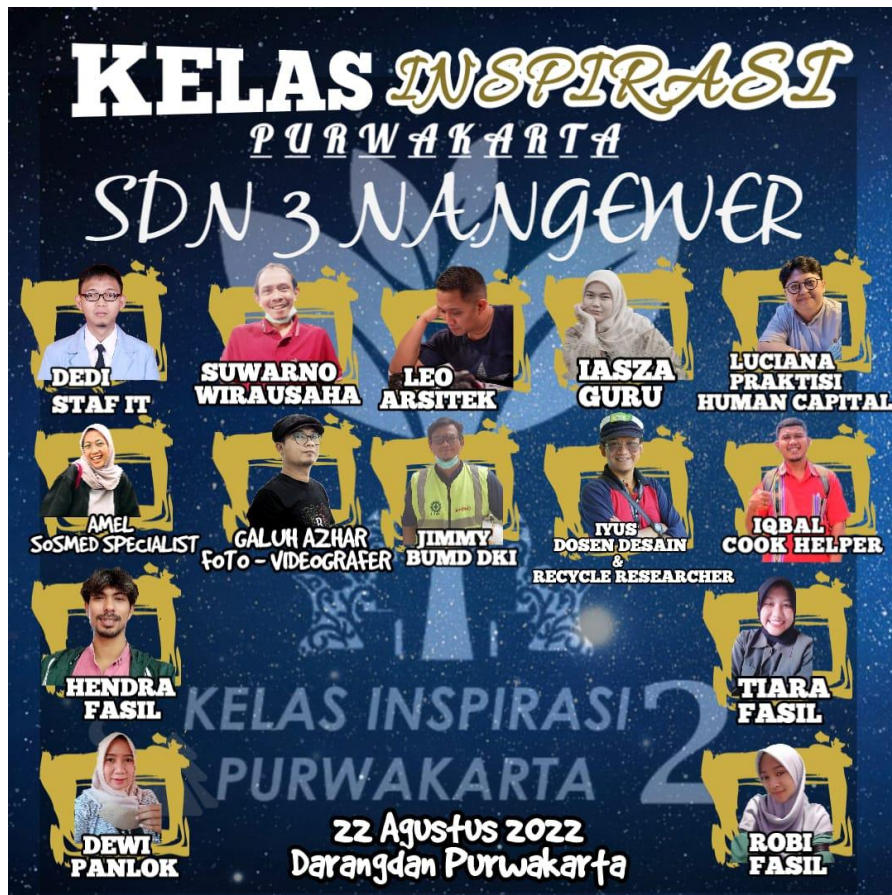
Gambar 2 .Desain poster pra event