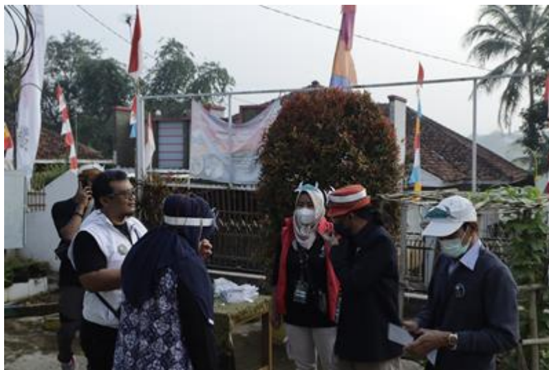
Gambar 13. Briefing Persiapan sebelum melaksanakan Hari Inspirasi

Hari Inspirasi merupakan hari di mana waktu pelaksanaan seluruh kelompok menyampaikan inspirasi kelas berupa materi profesinya masing-masing kepada anak-anak SD yang ditempatkan. Pada hari Senin, 22 Agustus 2022, seluruh Hari Inspirasi "Kelas Inspirasi Purwakarta #2" serentak dilaksanakan. Di SDN 3 Nangewer, Darangdan - Purwakarta tempat hari inspirasi dilaksanakan tercatat sebanyak 151 siswa yang hadir di acara ini, juga dihadiri oleh hampir seluruh guru-guru yang mendukung dan antusias ingin melihat pelaksanaan Hari Inspirasi.