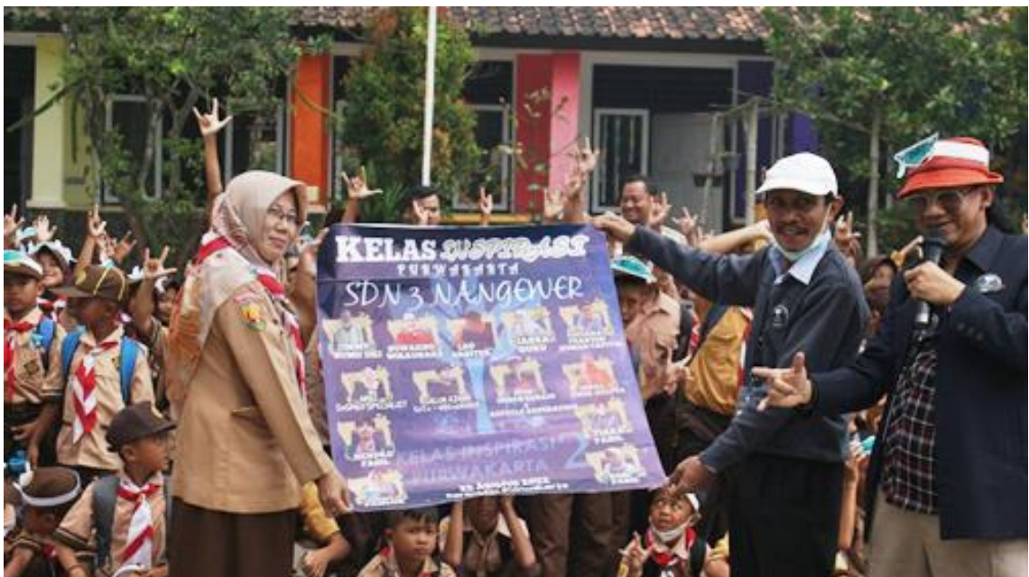
Gambar 22. Pemberian cinderamata kepada sekolah