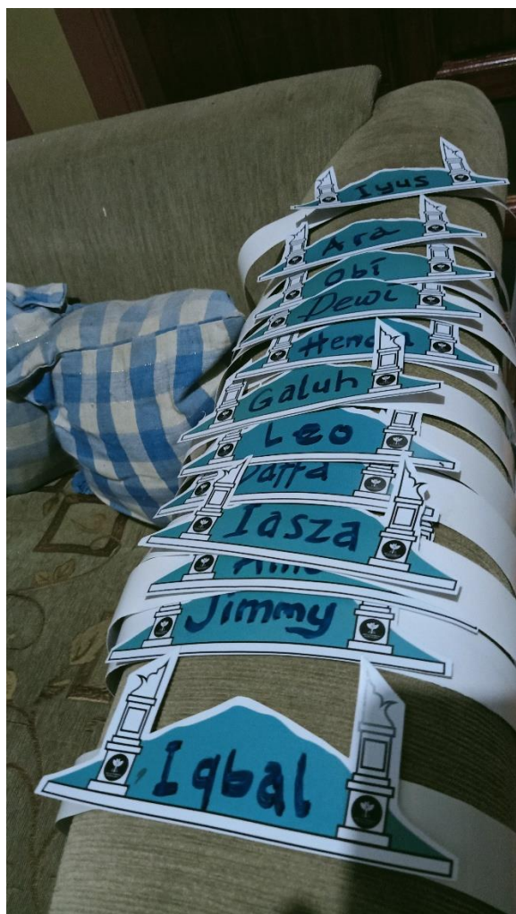
Gambar 3 .Desain Head Band siswa dan relawan