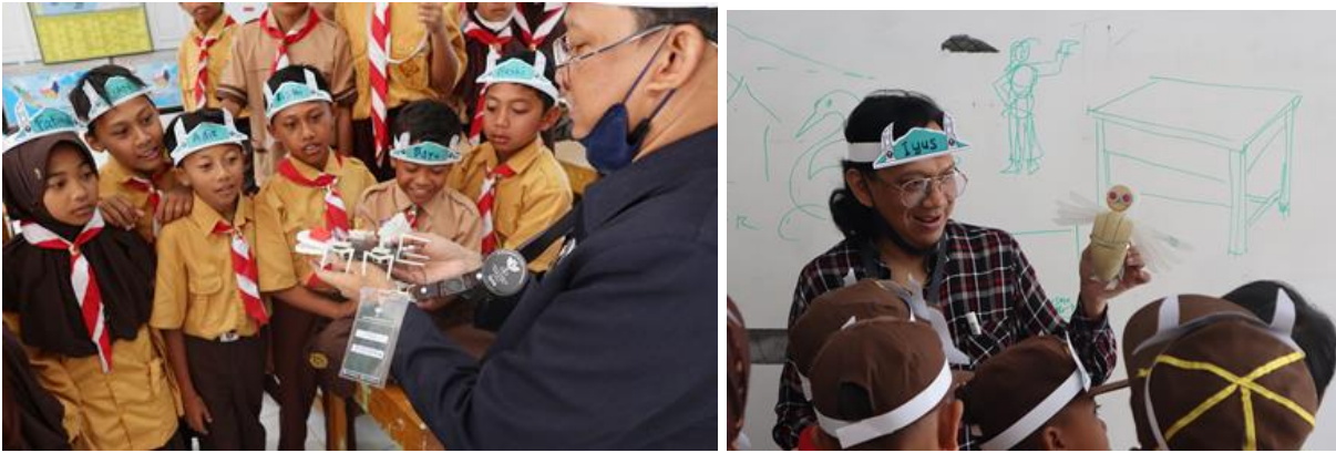
Gambar 17. Memperkenalkan prinsip „memanfaatkan apa yang ada” ,bagaimana membuat karya bisa murah ,tidak mahal, bahan-bahannya bisa dari sampah yang bisa dijumpai di sekitar mereka