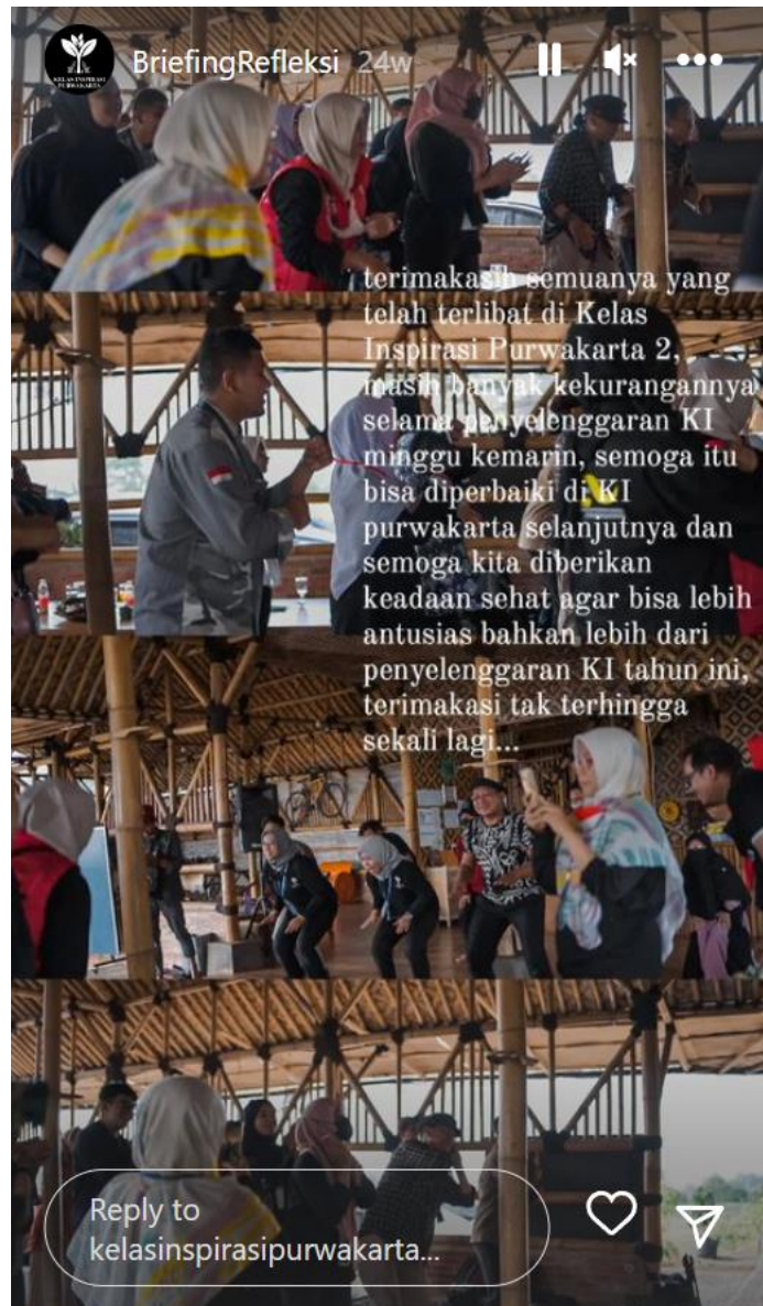
Gambar 24. Suasana kegiatan refleksi Kelas Inspirasi Purwakarta 2

Kegiatan refleksi merupakan kegiatan yang dilakukan setelah pelaksanaan hari inspirasi yang biasanya dilaksanakan di hari yang sama sebagai evaluasi dan ajang sharing kegiatan yang telah dilakukan baik antar individu sebagai relawan juga antar kelompok. Refleksi dilakukan satu jam setelah kegiatan hari inspirasi berlangsung dilaksanakan dengan riang gembira dan sukacita