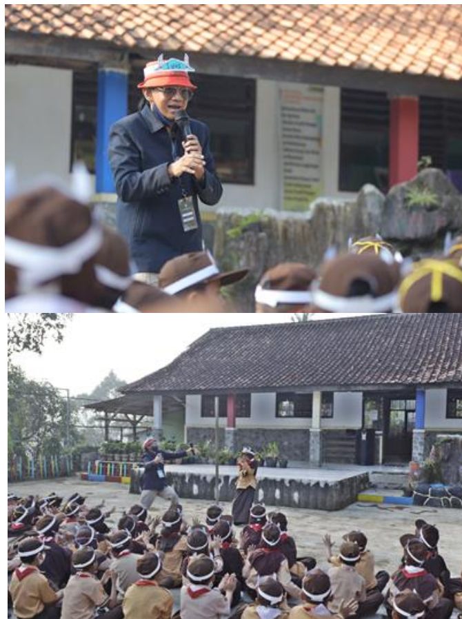
Gambar 15. Ice Breaking dan penciptaan suasana sebelum kegiatan inti untuk mencairkan suasana dan memecah kebekuan saat berikutnya memasuki kelas.