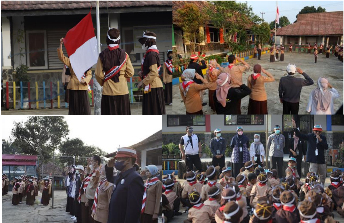
Gambar 14. Suasana Opening Kelas Inspirasi Purwakarta #2 SDN 3 Nangewer