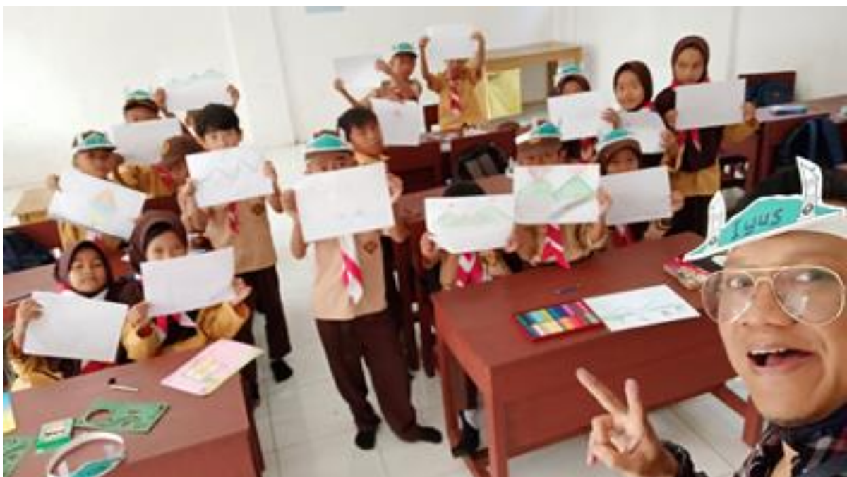
Gambar 19. Foto bersama siswa setelah workshop kilat menggambar