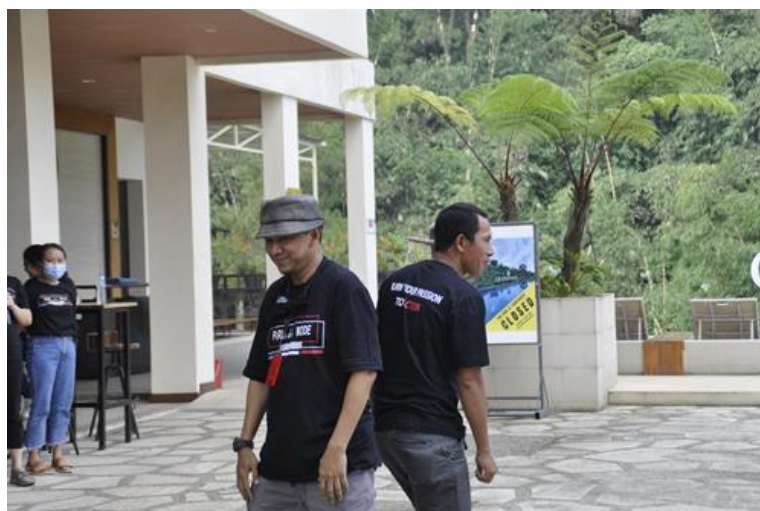
Gambar 5. Fasilitator juga harus terjun langsung interaksi, menjadi contoh dan selalu ikut berkolaborasi dengan peserta.

Keterlibatan tidak hanya dari peserta saja, namun mentor fasilitator juga harus bisa terlibat di acara ini. Dengan terlibat langsung dengan mereka peserta akan menganggap bahwa mentor fasilitator adalah bagian dari tim bukan hanya sebagai instruktur yang biasanya menyuruh-nyuruh saja.