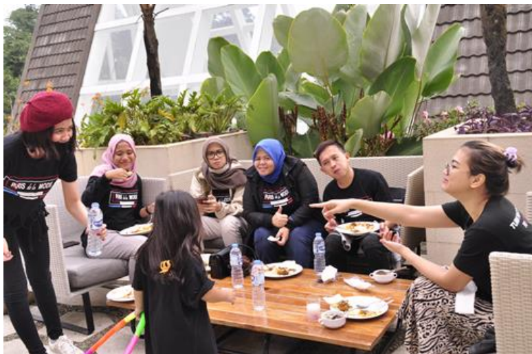
Gambar 19. Sarapan santai sebelum check out

Saat sarapan terlihat peserta sudah mulai bercanda lepas satu sama lain dan lebih nge-blend dibanding saat awal hari I.