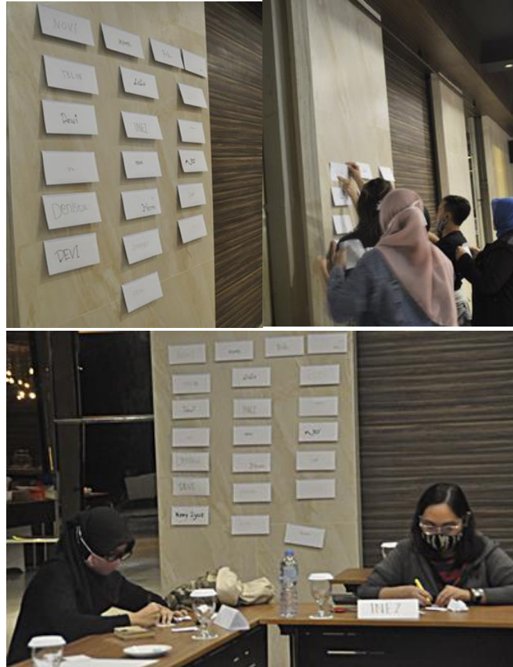
Gambar 6. Sohib and angel , simulasi bagaimana kita mendapat masukan positif dan saran pengembangan untuk kebaikan seseorang, masing2 memberikan feed back kepada peserta lain berupa pujian maupun kritik saran.

Materi pengembangan dari konsep Johari Windows disimulasikan dengan games Sohib and angel , simulasi ini mengajarkan bagaimana kita mendapat masukan positif dan saran pengembangan untuk kebaikan kita dari pendapat orang lain yang melihat kita sehari-hari. Masing-masing peserta memberikan feed back kepada seluruh peserta lain berupa pujian maupun kritik saran. Peserta dengan feed back terbanyak dari peserta lain mendapatkan award dan dibacakan di depan peserta lain saat penutupan.