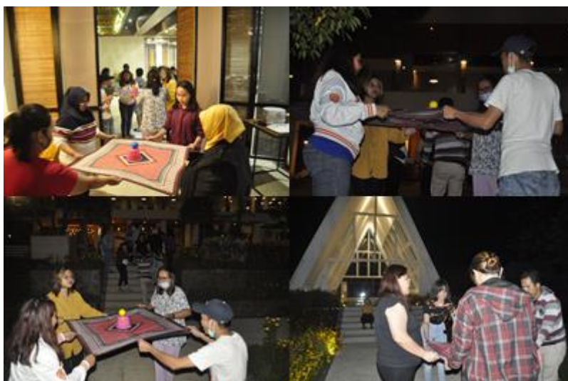
Gambar 15. Games Bring the message

Games ini membangun membutuhkan kerjasama yang tinggi. Di mana satu team harus membawa bola yang diletakan pada ember kecil yang terbalik yang dibawa dengan kain yang dibentangkan oleh empat orang ke satu titik ke titik tuju yang ditentukan. Jika di perjalanan bola itu jatuh , harus diulang dari awal titik keberangkatan. Hal ini men-simulasikan bahwa, pesan yang dibawa untuk disampaikan harus sampai betul ke tempat/ orang yang semestinya disampaikan. Dan kadang pesan / materi/ rahasia ada saja yang ‘bocor’ di tengah jalan. Dan dalam team work, kadang kita dalam tim sebuah institusi/ perusahaan harus bisa menjaga ‘rahasia dapur’ perusahaan.