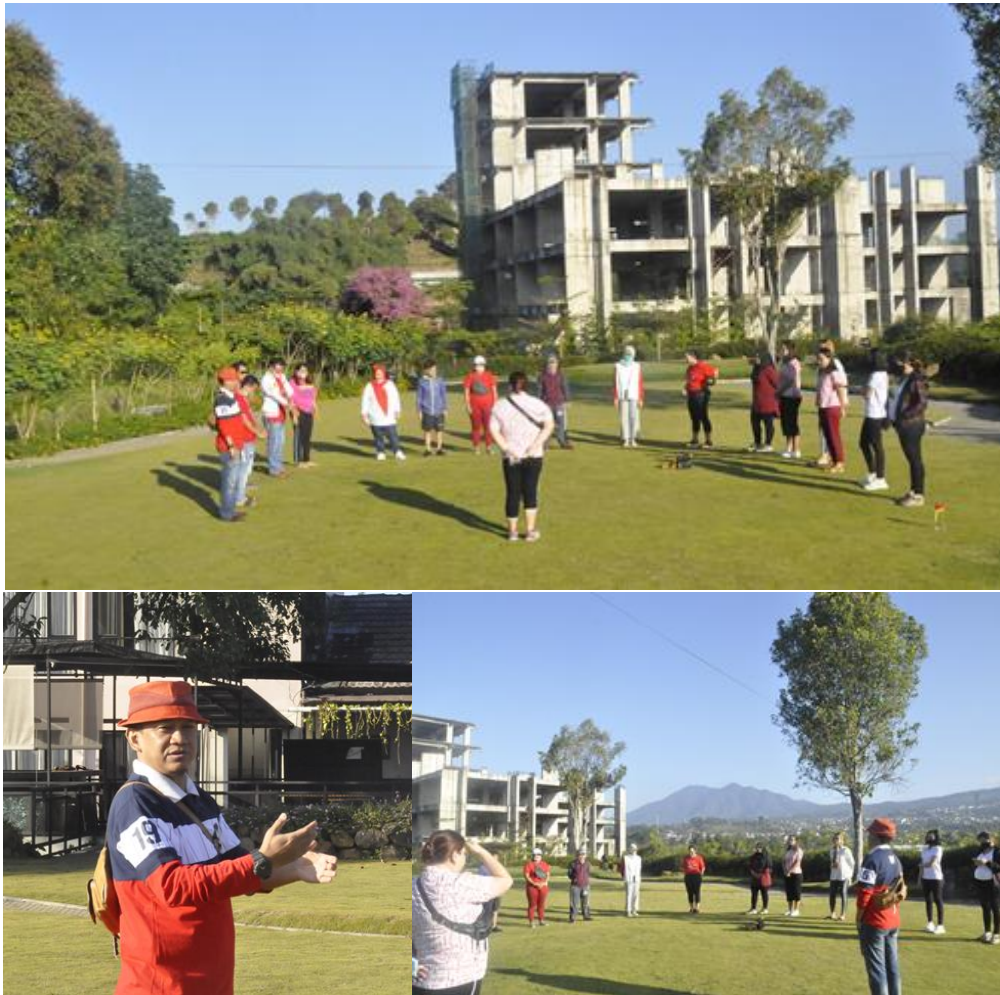
Gambar 9. Upacara Pagi Memperingati HUT RI ke 75