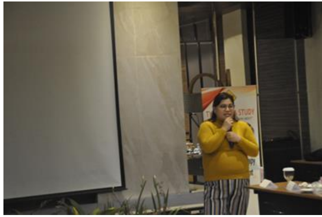
Gambar 20. Penutupan kegiatan oleh Principal.