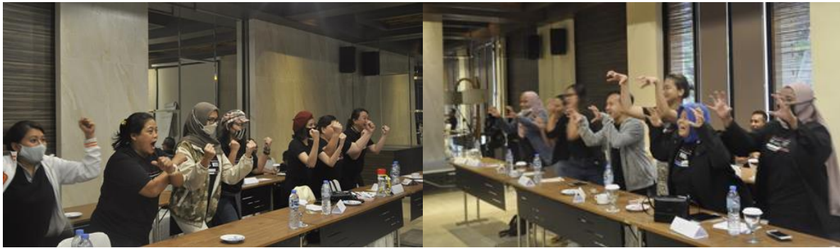
Gambar 7. Simulasi kompetisi antar grup , simulasi bagaimana menguji kekompakan dan berkomunikasi sehingga satu visi dan satu tujuan, simulasi dilakukan dengan peragaan ice breaking 'Hitung Gebrak Meja' & 'Samson Singa Delillah'.

Materi pengembangan Komunikasi lainnya adalah Tuker Kado. Kado harus disediakan oleh masing-masing peserta maupun mentor fasilitator. Seharga kisaran Rp. 40.000 - Rp.50.000. Dikemas dengan kertas kado coklat standar. Dan diambil dengan cara ditutup mata dan apa yang pertama dipegang itulah yang didapatnya. Simulasi ini menyoroti bagaimana menerima dengan ikhlas apa yang kita dapat setelah apa yang kita berikan kepada orang lain.