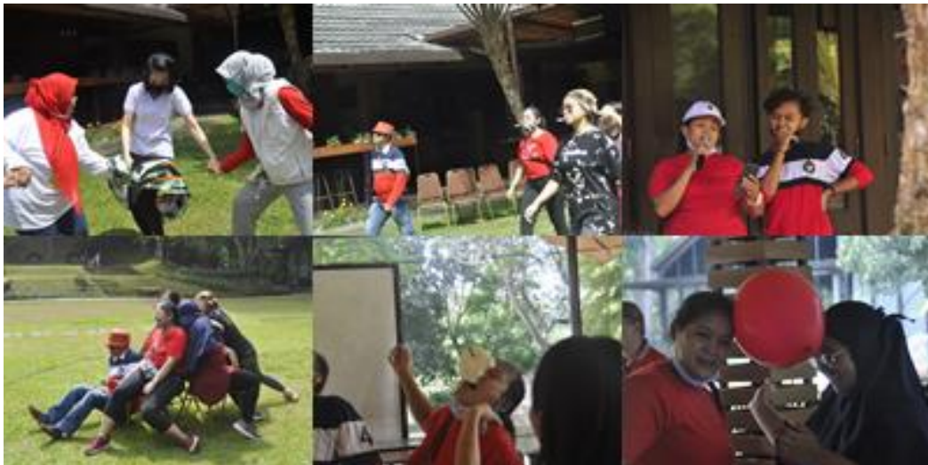
Gambar 11. Lomba 17 Agustus-an

Setelah Senam pagi Bersama seluruh peserta sarapan pagi dan langsung melaksanagn kegiatan Lomba khas 17-an. Berupa Lomba balap kelereng, Lomba makan kerupuk, lomba pecah balon, Lomba Rebut Kursi, Lomba pindah sarung & karaoke bersama. Kegiatan ini diikuti oleh seluruh peserta, baik peserta kegiatan, mentor fasilitator, dokumentator dan juga para principal. Selain memperingati 17 Agustusan, juga mempererat komunikasi dan Kerjasama baik antar peserta juga dengan fasilitator.