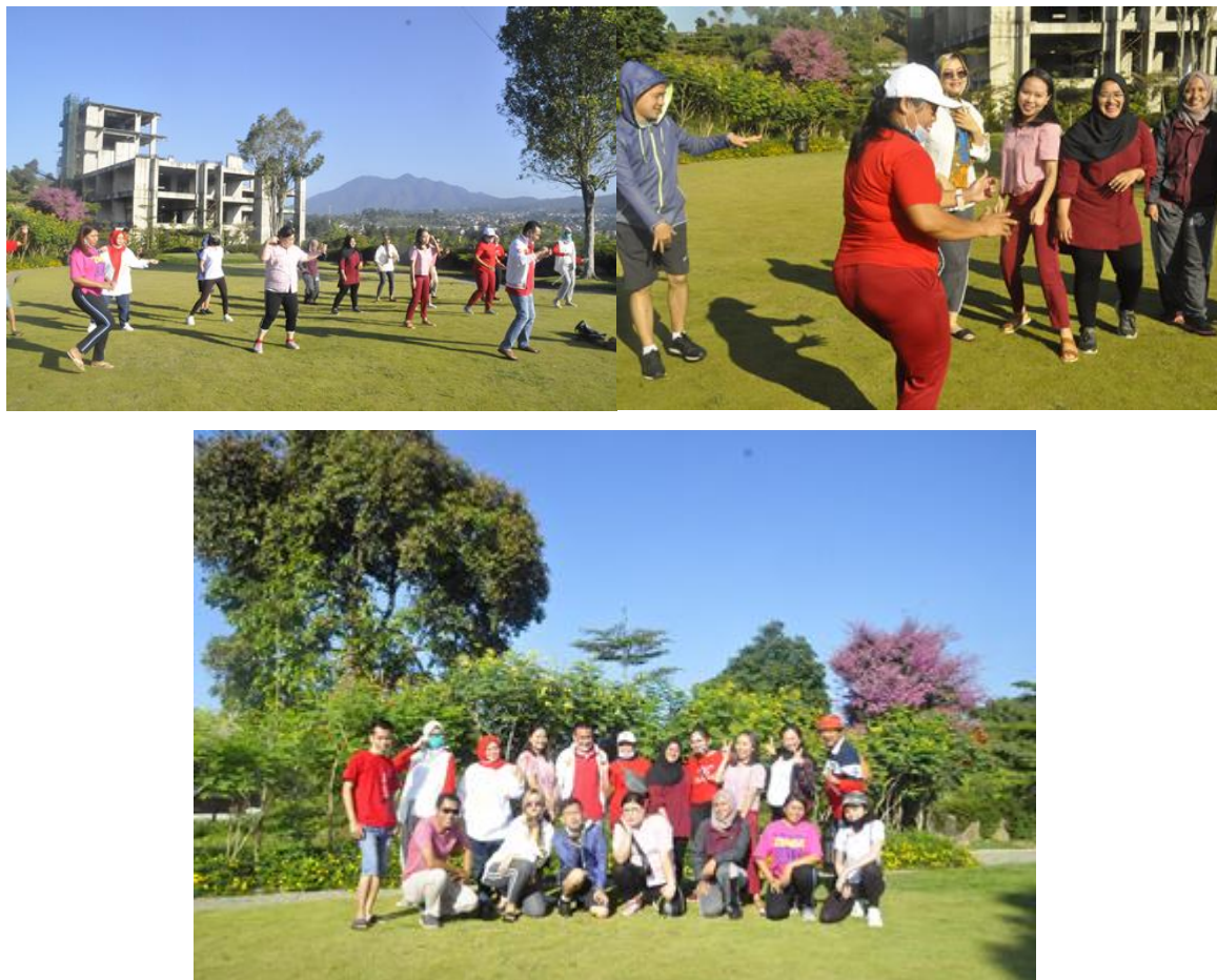
Gambar 10. Senam pagi & Foto Bersama

Setelah Upacara Pagi kegiatan dilanjutkan dengan Senam pagi Bersama. Cuaca cerah area Lembang pagi itu sangat mendukung, yang membuat peserta semua mengikuti kegiatan senang suka cita sehingga senam pagi yang hanya diikuti hanya 20 orang terasa ramai.