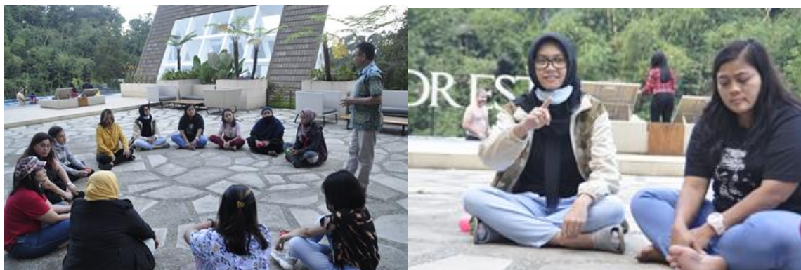
Gambar 14. Review kegiatan , evaluasi hal yang baik dan buruk yang terjadi.

Proses Review, setiap kegiatan hendaknya ada briefing baik sebelum kegiatan mengajar maupun setelahnya. Hal ini dilakukan untuk mengukur sejauh mana apa yang sudah dilakukan oleh team pengajar kepada siswa siswinya.