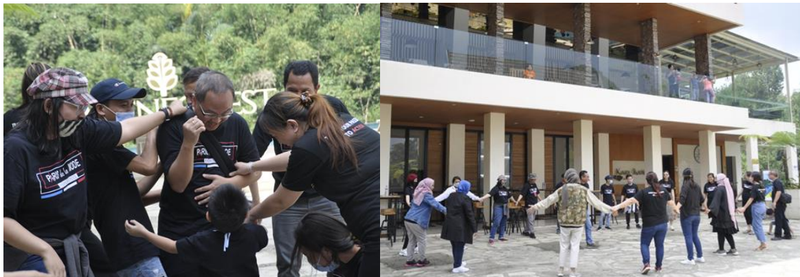
Gambar 4. Interaksi yang melibatkan seluruh peserta sangat dibutuhkan selain bertujuan lebih mengenal lagi satu sama lain antar peserta, dapat membangun suasana gathering dan pelatihan lebih 'cair'

Materi awal yang diberikan dengan ara games dan ice breaking lebih untuk mencaikan Susana dan membangun suasana pelatihan yang lebih rileks santai dan tidak terlalu formal, namun muatannya sangat dalam dan dapat cepat diserap oleh peserta.