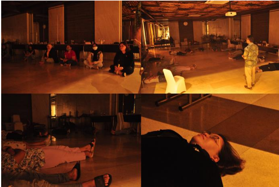
Gambar 16. Renungan

Kegiatan ini bertujuan merenungi apa yang sudah dan apa yang akan dilakukan oleh peserta (pengajar) untuk Paris de la Mode fashion School. Relaksasi setelah semua kegiatan yang dilakukan selama dua hari ini. Kegiatan ini dipandu oleh mentor dengan narasi dan cerita seputar psikologi teamwork , keluarga, anak dengan background instrument yang menyayat hati yang membuat para peserta banyak yang terbawa emosi dan menangis haru.