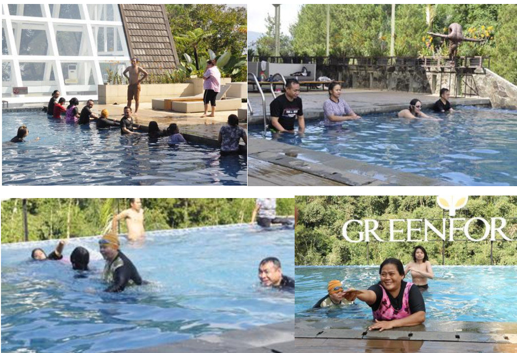
Gambar 12. Lomba Estafet Berenang dan ambil kelereng di air.

Dilakukan sebagai penyegaran setelah kegiatan Lomba-lomba 17-an. Kegiatan ini dilakukan dengan tujuan lebih mempererat teamworking dan sportivitas. Kegiatan berupa Lomba Berenang estafet dan Ambil kelereng di dasar kolam.