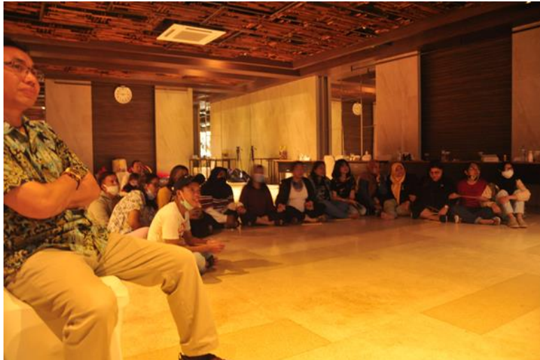
Gambar 18. Menonton slide video show foto-foto dan video kegiatan

Kegiatan ini sebagai ending dari acara pelatihan, mereka menonton slide video show foto-foto dan video kegiatan dari awal mereka datang sampai acara renungan. Bertujuan untuk meresh dan antiklimaks santai sambil tertawa melihat foto2 candid selama kegiatan berlangsung yang diambil tim dokumentator.