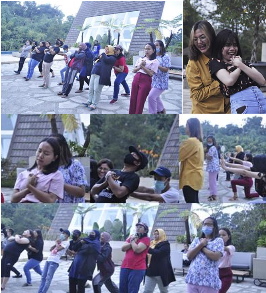
Gambar 15. Games Trust & Fall