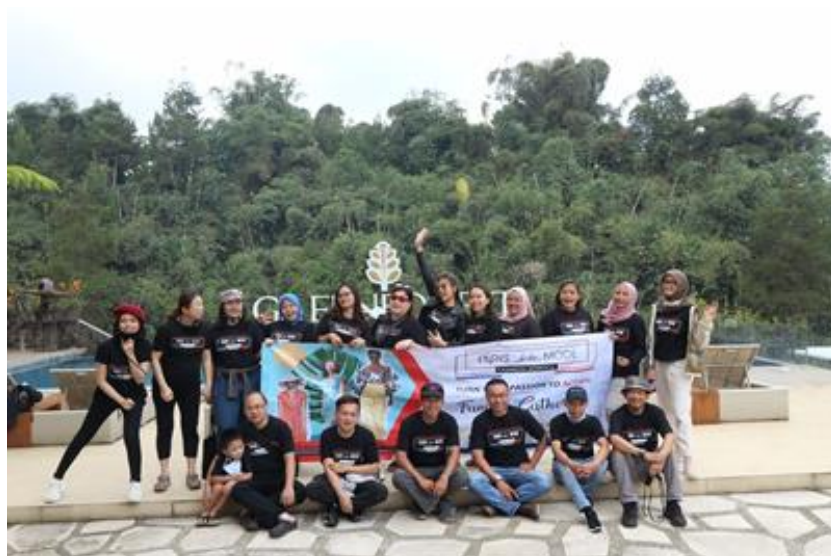
Gambar 2. Foto bersama dari para seluruh peserta dan fasiltator