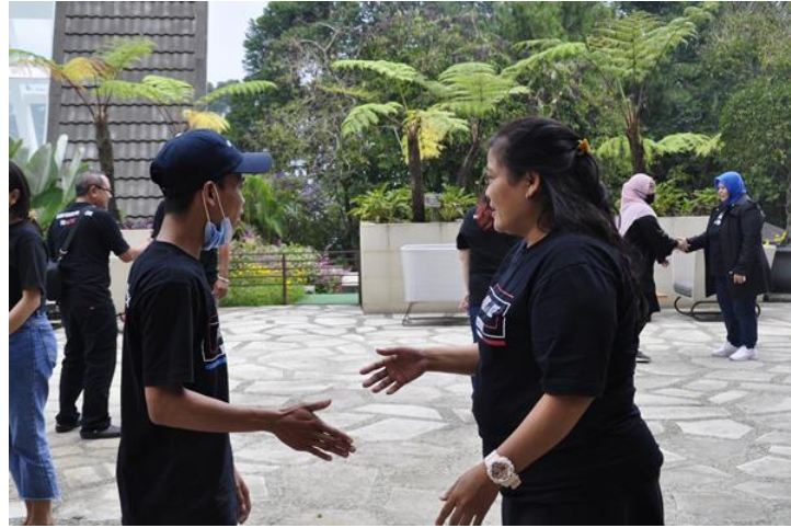
Gambar 3. Ice Breaking 'People to people' yang bertujuan lebih mengenal lagi satu sama lain antar peserta

games diselingi dengan ice breaking dan penayangan video yang berkaitan dengan materi.