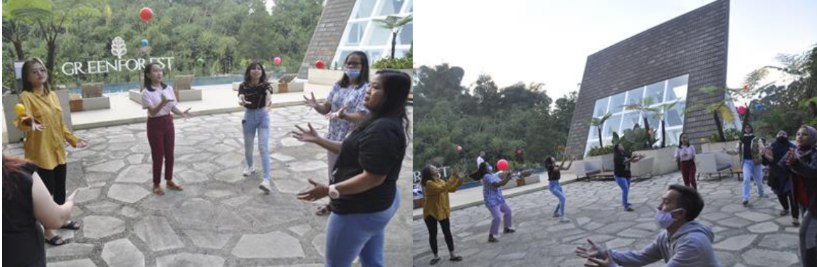
Gambar 13. Games transfer bola yang dilakukan oleh seluruh peserta.

Games transfer bola ini bertujuan untuk meningkatkan skill komunikasi antar para pengajar. Dalam aplikasi sehari-hari, mereka harus peduli terhadap orang lain. Siap memberikan dan menerima informasi dan bisa mentransferkannya secara baik, baik kepada siswa ataupun pengajar yang lain.