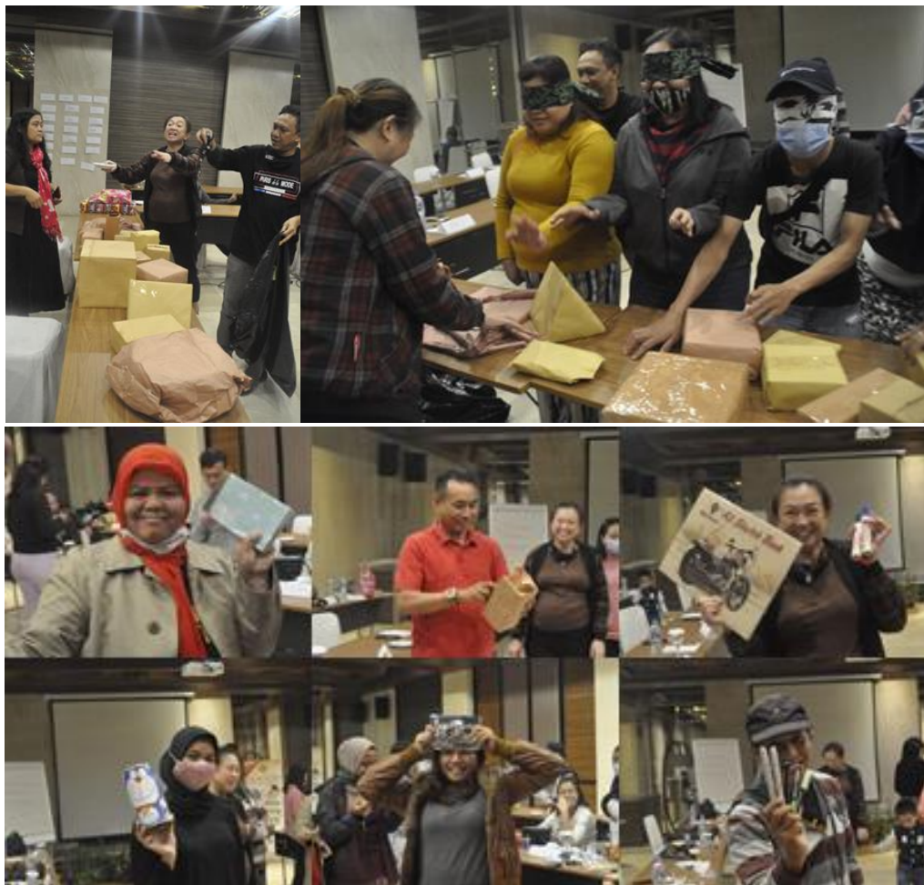
Gambar 8. Games Tuker Kado, Simulasi bagaimana menerima dengan ikhlas setelah apa yang kita berikan kepada orang lain.

Materi pengembangan Komunikasi lainnya adalah Tuker Kado. Kado harus disediakan oleh masing-masing peserta maupun mentor fasilitator. Seharga kisaran Rp. 40.000 - Rp.50.000. Dikemas dengan kertas kado coklat standar. Dan diambil dengan cara ditutup mata dan apa yang pertama dipegang itulah yang didapatnya. Simulasi ini menyoroti bagaimana menerima dengan ikhlas apa yang kita dapat setelah apa yang kita berikan kepada orang lain.