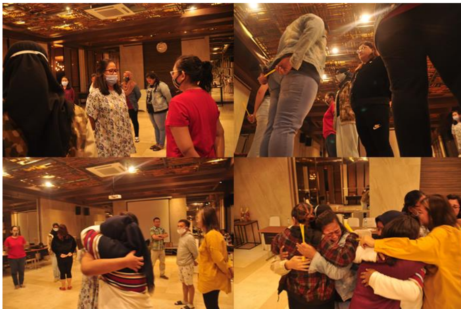
Gambar 17. Saling peluk erat, percaya bahwa mereka bisa untuk memajukan Paris de la Mode school

Kegiatan ini bertujuan untuk saling mengeratkan antar pengajar satu sama lain dan saling mempercayakan apa yang dilakukan antar pengajar untuk kemajuan Paris de la Mode School. Kegiatan saling menatap mata setiap peserta dan dilakukan bergilir dan narasi dibacakan oleh mentor membuat mereka bisa menangis dan saling meminta maaf, berpelukan dan memiliki semangat untuk bisa memajukan Paris de la Mode School.