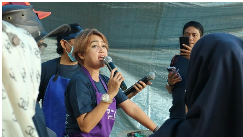
Gambar 11. Refleksi dan evaluasi kegiatan

Setelah seluruh peserta menyelesaikan karya, kegiatan ditutup dengan refleksi, evaluasi, pemberian pin simbolis tanda lulus kegiatan dan foto bersama.