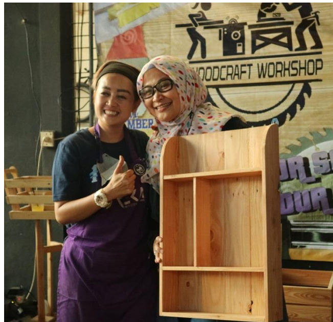
Gambar 10. Salah satu peserta berpose telah menyelesaikan karya bersama fasilitator

Pekerjaan dengan tahapan preparing , marking , cutting , assembly dan finishing dengan menggunakan alat secara tepat membuat proses lancar dan dapat terselesaikan.