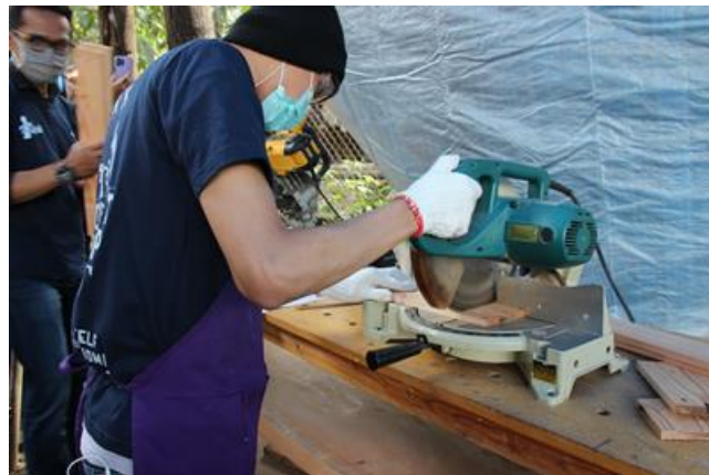
Gambar 4. Peserta Workshop mencoba menggunakan berbagai alat dengan diarahkan fasilitator

Setelah diberikan orientasi pengenalan alat dan bahan, peserta memulai kegiatan workshop. Setiap peserta diberikan empat batang kayu pinus berukuran panjang (p)120 cm, lebar (l) 12 cm dan tebal (t) papan 20 mm, 2 batang kayu pinus berukuran p 75 cm, l 12 cm dan t papan 20 mm dan diberikan keleluasaan menggunakan alat yang disediakan. Peserta memulai kegiatan dimulai dengan beberapa cara, ada yang langsung memulai dengan melatih dulu skill menggunakan alat ( learning by doing ), ada yang mulai dengan design by doing .