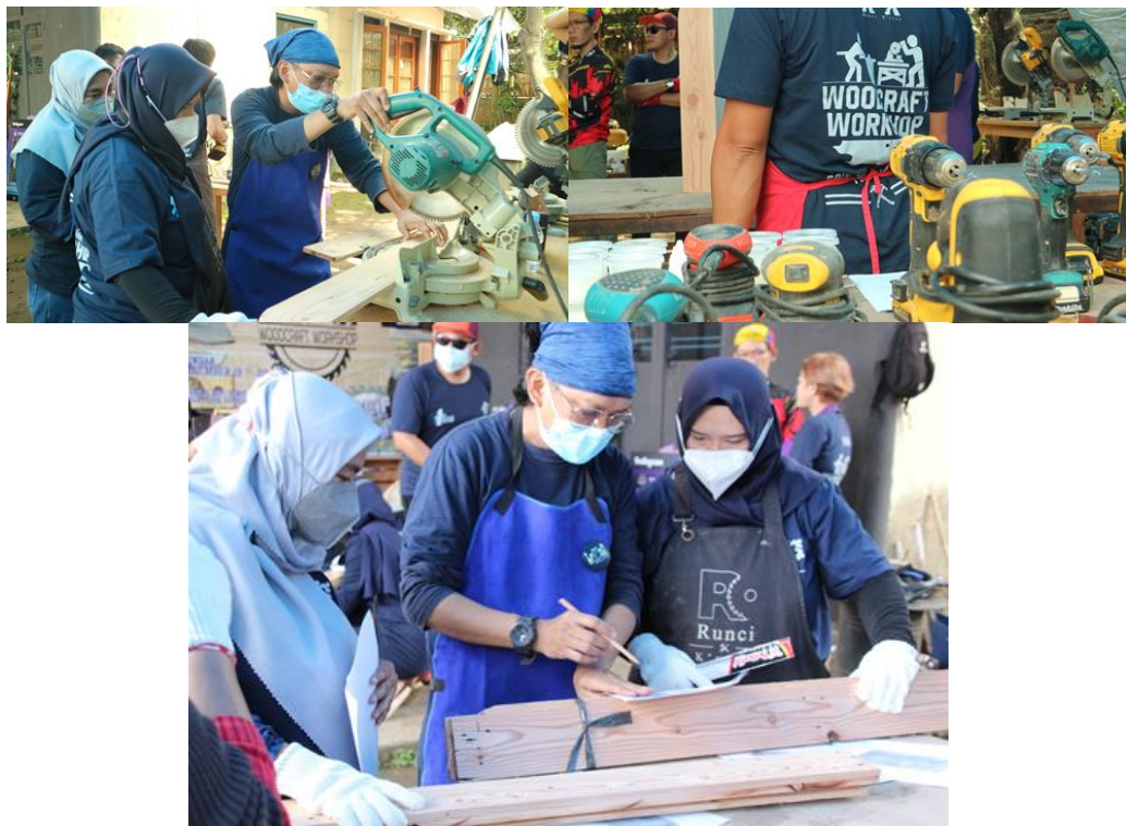
Gambar 3. Pengenalan Alat dan bahan

Setelah diberikan pendahuluan mengenai workshop ini, peserta workshop diberikan orientasi tentang alat-alat yang akan digunakan berikut material apa yang akan dipakai untuk menghasilkan karya. Pemberian materi dilanjutkan dengan tugas yang akan dibuat oleh seluruh peserta. Peserta diberikan tugas yang sama yaitu membuat rak kitchen .