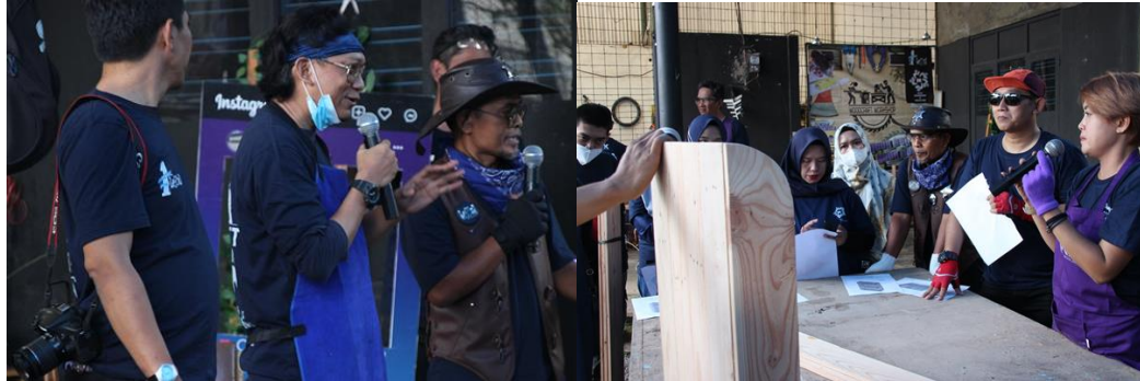
Gambar 2. Pemberian Materi awal

Setelah pembukaan dan penjelasan kegiatan kemudian dilanjutkan dengan materi pengantar sehingga peserta akan lebih memahami apa yang akan dikerjakan.