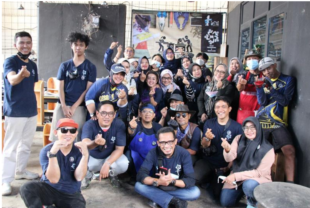
Gambar 13 Foto bersama seluruh peserta dan fasilitator