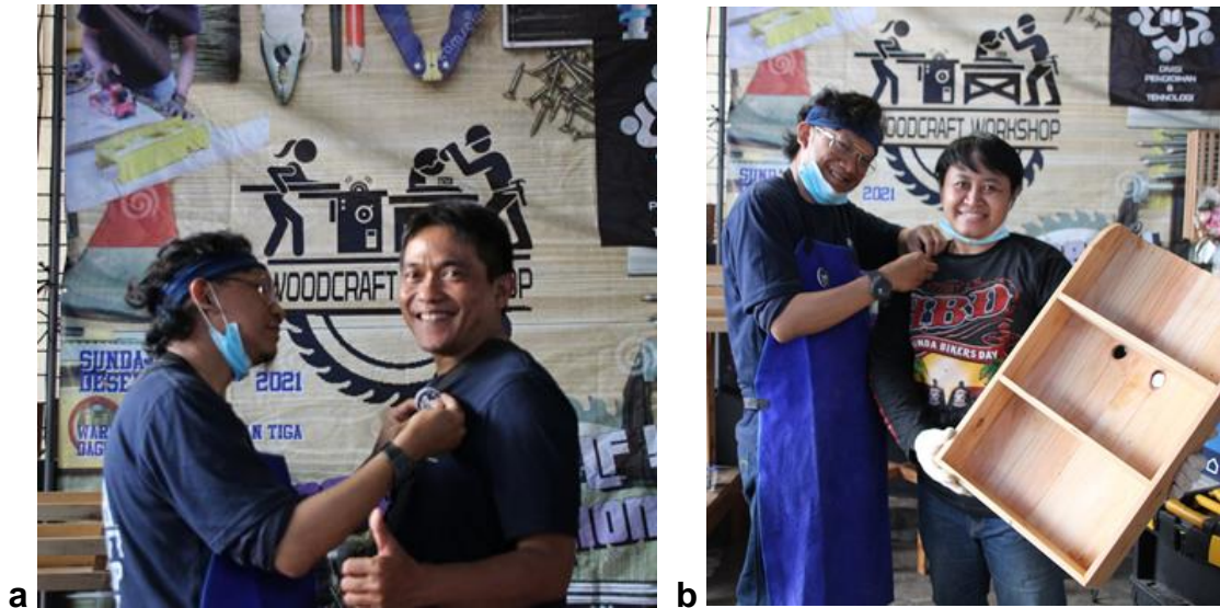
Gambar 12 (a &b). Penyerahan pin tanda lulus kegiatan