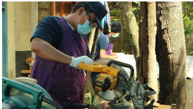
Gambar 7. Peserta Workshop sudah bisa menggunakan alat secara mandiri setelah dipraktekan fasilitator.