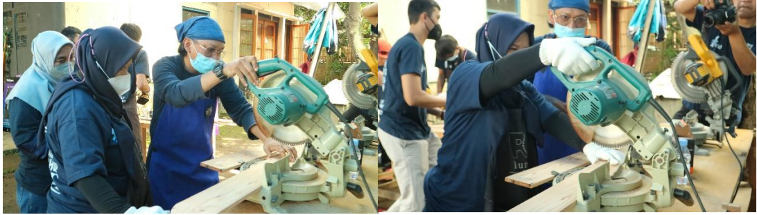
Gambar 6 (a) & (b). Peserta Workshop dicontohkan terlebih dahulu saat akan menggunakan alat.