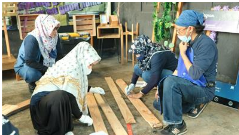
Gambar 5. Peserta Workshop mulai mengukur bahan yang akan dipakai

Setelah diarahkan oleh fasilitator & asisten fasilitator, peserta sudah bisa memulai mandiri membuat karya dari limbah kayu menggunakan alat-alat yang disediakan.