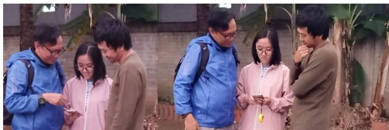
Gambar 3. Proses diskusi tema gambar dengan ketua tim

Setelah itu, anggota tim dan ketua tim berdiskusi untuk menacari referensi desain yang akan diterapkan dan dirancang dalam proses mural di dinding. Setelah proses diskusi akhirnya ditetapkan tema geometris sebagai bentuk yang akan digambar pada dinding. Agar terdapat konsep baru diantara dinsing lain yang memiliki tema abstrak.