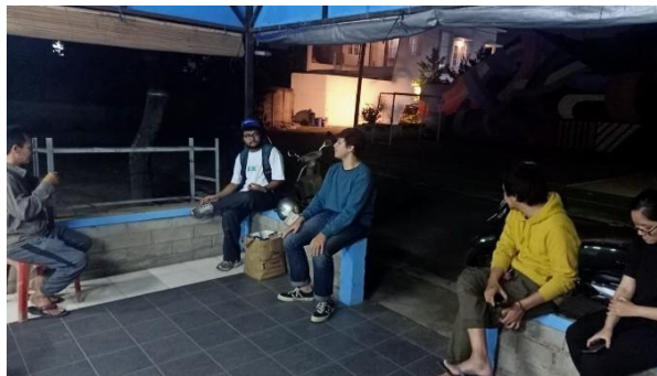
Gambar 9. Diskusi mengenai teknis pengecatan dinding

Setelah selesai sketsa pada dinding kami berbincang dengan salah satu perwakilan warga untuk tahap selanjutnya. Tahap selanjutnya adalah proses pengecatan yang nantinya akan dilakukan bersama dengan warga. Hal yang dibahas mengenai jumlah cat yang nantinya akan digunakan, waktu pelaksanaan dalam proses pengecatan, serta teknis yang nanti akan digunakan selama proses pengecatan tembok.