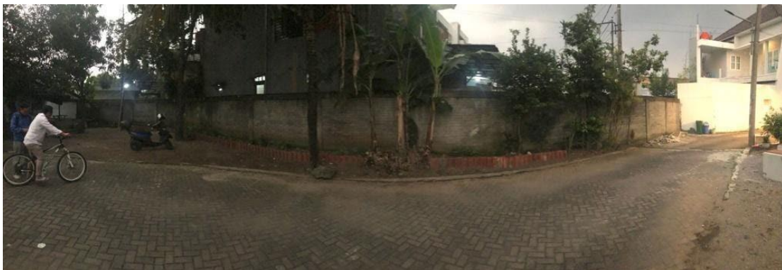
Gambar 1. Kondisi dinding area taman jalan

Perumahan Graha Pesona , RW 02 Kelurahan Cisaranten Wetan, Kecamatan Cinambo Bandung sudah berdiri sejak tahun 2004, berkembang baik secara fisik maupun kegiatannya. Fasilitas pendukung seperti Fasilitas Umum (Fasum) dan Fasilitas Sosial (Fasos) yang awalnya masih dipegang developer diserahkan kepada masyarakat penghuni perumahan mulai tahun 2009. Perkembangan fasilitas yang awalnya dinding kosong pada area taman jalan di area fasilitas olahraga, dikembangkan dan dipercantik agar dapat dipergunakan warga. Melalui perkembangan dengan menambahkan sesuatu yang indah dan instagramable sehingga memberikan pengaruh untuk warga yang memakai fasilitas di area ini.