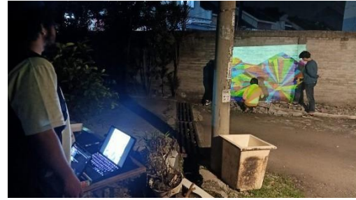
Gambar 8. Proses pemindahan gambar ke dinding

Setelah selesai sketsa pada dinding kami berbincang dengan salah satu perwakilan warga untuk tahap selanjutnya. Tahap selanjutnya adalah proses pengecatan yang nantinya akan dilakukan bersama dengan warga. Hal yang dibahas mengenai jumlah cat yang nantinya akan digunakan, waktu pelaksanaan dalam proses pengecatan, serta teknis yang nanti akan digunakan selama proses pengecatan tembok.