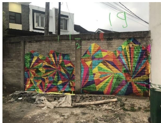
Gambar 7. Contoh desain yang terpilih

Setelah melakukan beberapa perubahan pada desain alternatif yang sudah dibuat akhirnya memutuskan 12 desain yang terpilih untuk menjadi desain pada dinding sesuai dengan bagiannya masing-masing. Dikarena terdapat 12 dinding yang terbagi oleh kolom, sehingga desain yang perlu dibuat secara berurutan agar garis yang diciptakan nantinya akan terkesan menyatu. Gambar yang terpilih dibuat sesuai dengan skala nyata yang terdapat pada dinding melalui proses secara digital seperti gambar yang tertera dibawah ini.