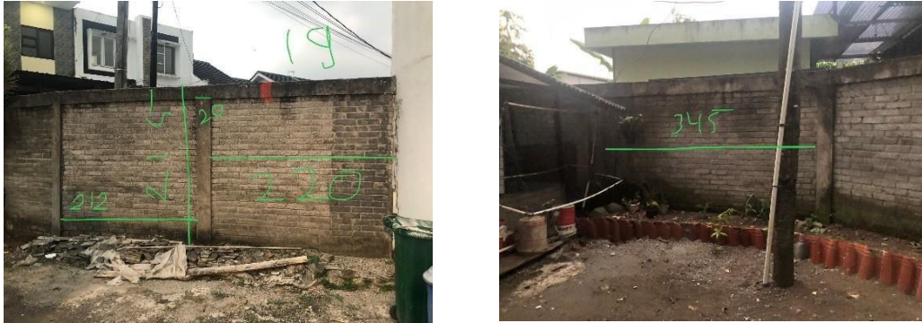
Gambar 4. Hasil pengukuran dinding eksisting

Langkah selanjutnya adalah tahap pembuatan desain mural berdasarkan tema dan data hasil proses pengukuran eksisting yang akan dijadikan sebagai acuan.