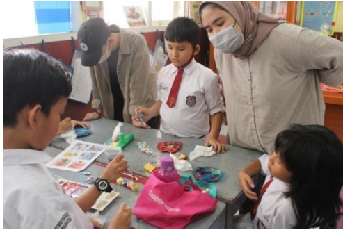
Gambar 12. Mengajarkan pencampuran warna