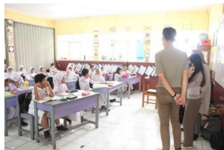
Gambar 3. Pengenalan diri