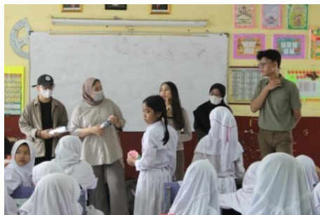
Gambar 2. Tahap Pengenalan diri

Setelah melewati tahapan tersebut, mereka diperbolehkan untuk memulai pengecatan pada pot mini tersebut dengan warna-warna yang dimiliki namun masih dengan bimbingan kami sebagai panitia yang melangsungkan kegiatan tersebut pada tiap kelompoknya. Setelah, kegiatan mengecat pot usai seluruh siswa diharuskan untuk merapihkan kembali meja dan tempat duduk seperti keadaan semula. Kemudian seluruh siswa kami ajak berfoto bersama sebagai dokumentasi kegiatan yang telah terlaksana.