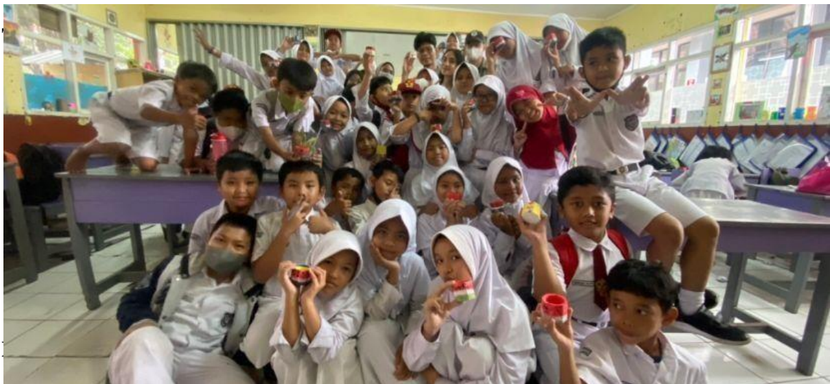
Gambar 1 : Siswa-siswi SDN 151 Suka Senang

Selanjutnya, kami mengajarkan pengaplikasian teori warna tadi ke media berupa pot mini yang merepresentasikan elemen dekorasi interior. Dengan upaya ini, harapan kedepannya, agar semakin banyak masyarakat yang paham dan mengerti tentang apa itu interior.