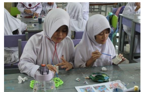
Gambar 15. Mulai mengecat pot