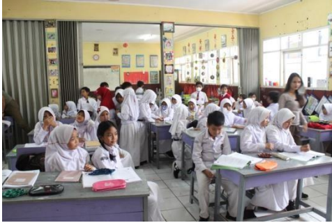
Gambar 4. Mulai mengenalkan warna primer