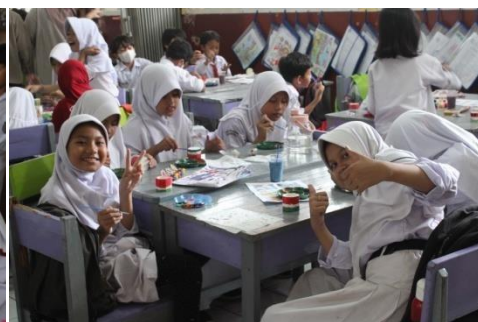
Gambar 19. Sesi foto