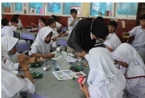
Gambar 18. Kegiatan mengecat pot