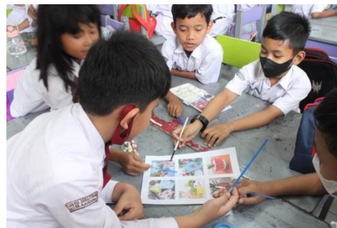
Gambar 9. Merundingkan gambar