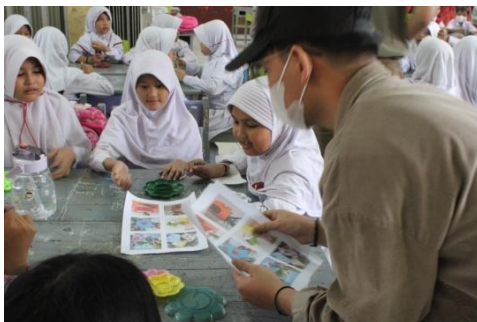
Gambar 8. Membagikan foto referensi gambar