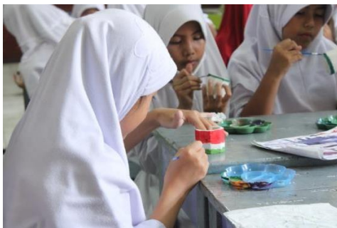
Gambar 16. Kegiatan mengecat pot