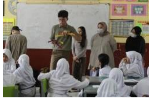
Gambar 5. Tahapan pengenalan warna Sekunder