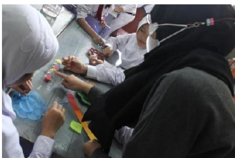
Gambar 10. Mengajarkan pencampuran warna