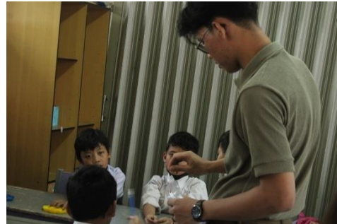
Gambar 7. Membagikan cat dan kuas