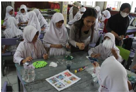
Gambar 14. Mengajarkan pencampuran warna