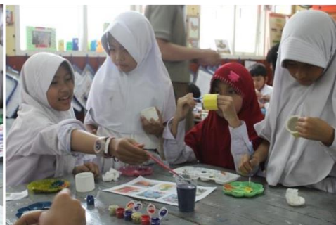
Gambar 17. Kegiatan mengecat pot