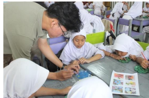
Gambar 11. Mengajarkan pencampuran warna