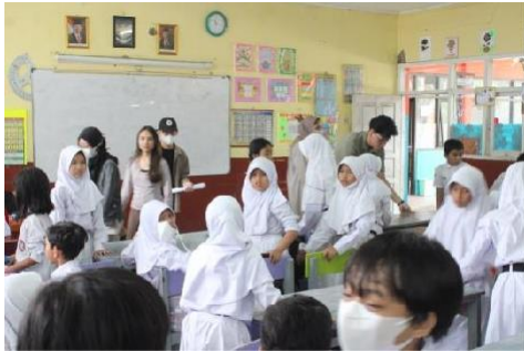
Gambar 6. Pembagian kelompok