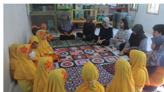
Gambar 1.1 & 1.2 Introduksi, doa bersama serta nyanyian sebelum acara dimulai