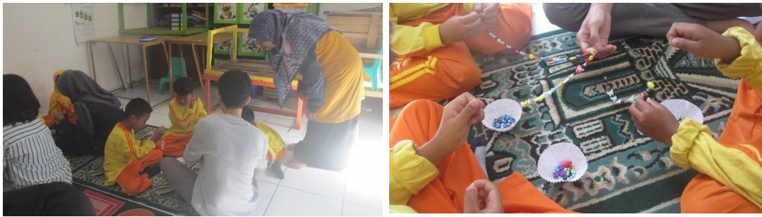
Gambar 1. 12 Kegiatan meronce yang juga diawasi langsung oleh staff pengajar At-Tholibiin

Para staff pengajar At-Tholibiin juga ikut mengawasi berlangsungnya kegiatan ini dari awal sampai akhir. Setelah para peserta usai meronce 2-3 karya, panitia penyelenggara bertugas memberikan kunciian kepada tiap karya agar nantinya bisa digunakan oleh masing-masing peserta. Penyelenggara terus membagi tugas dan peran agar setiap anak dapat menyelesaikan karyanya masing-masing.