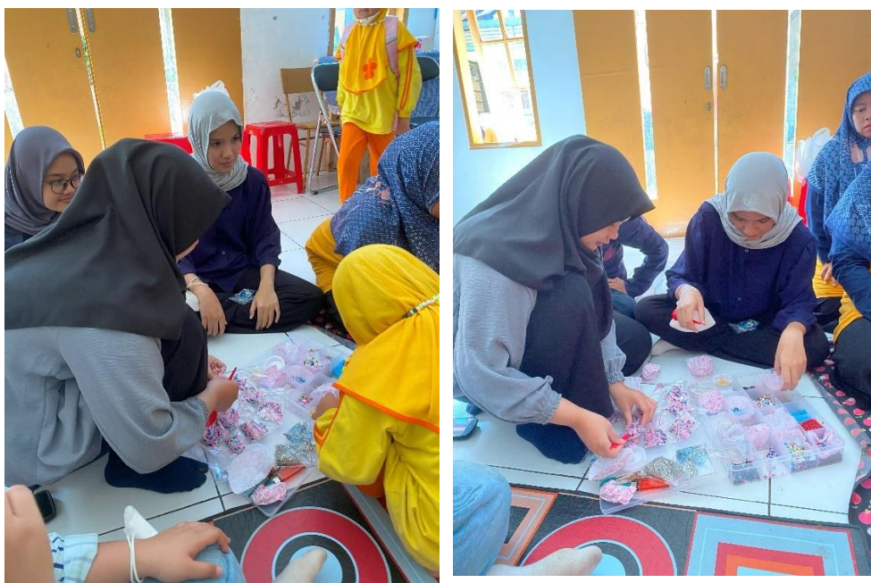
Gambar 1.31 & 1.32 Pembagian sisa manik-manik kepada masing-masing peserta & staff pengajar At-Tholibin