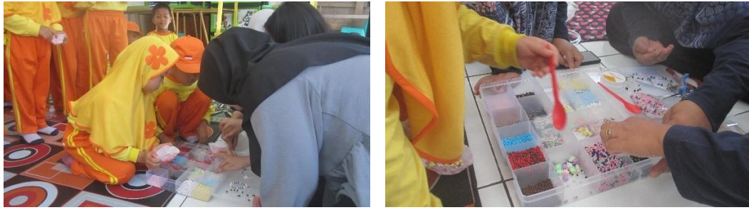
Gambar 1.3 & 1.4 Pembagian bahan manik-manik kepada masing-masing peserta secara tertib