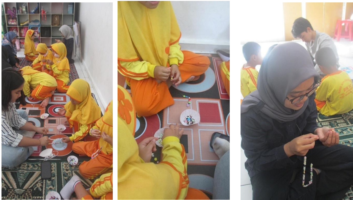
Gambar 1.9, .1.10, & 1.11 Meronce dan pemberian wawasan kepekaan warna kepada tiap anak

Mahasiswa bertugas membimbing dan ikut menertibkan masing-masing kelompok pesertanya, juga membantu agar manik-manik tidak terjatuh selama proses kegiatan. Peran lainnya ialah juga terdapat pada pemberian wawasan secara tidak langsung kepada anak-anak terkait teori kesinambungan dan keselarasan warna. Hal ini diharapkan dapat memicu anak untuk mengolah kreatifitas dalam batasan estetika yang tepat.