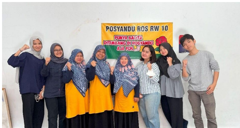
Gambar 1.33 Dokumentasi bersama staff pengajar At-Tholibin