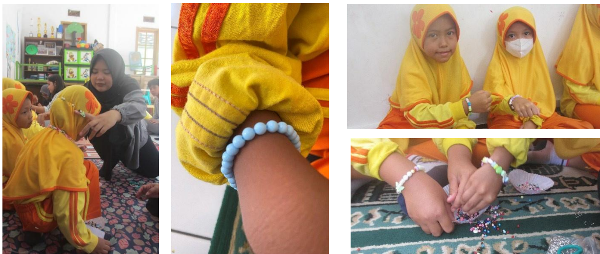
Gambar 1. 13 – 1.16 Proses rampung manik-manik, kunciian dan pemaiaian ke para peserta

Para staff pengajar At-Tholibiin juga ikut mengawasi berlangsungnya kegiatan ini dari awal sampai akhir. Setelah para peserta usai meronce 2-3 karya, panitia penyelenggara bertugas memberikan kunciian kepada tiap karya agar nantinya bisa digunakan oleh masing-masing peserta. Penyelenggara terus membagi tugas dan peran agar setiap anak dapat menyelesaikan karyanya masing-masing.