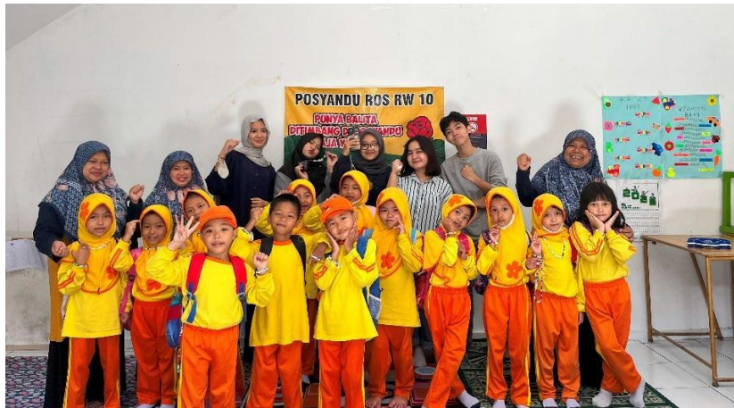
Gambar 1.32 Dokumentasi bersama peserta kegiatan meronce