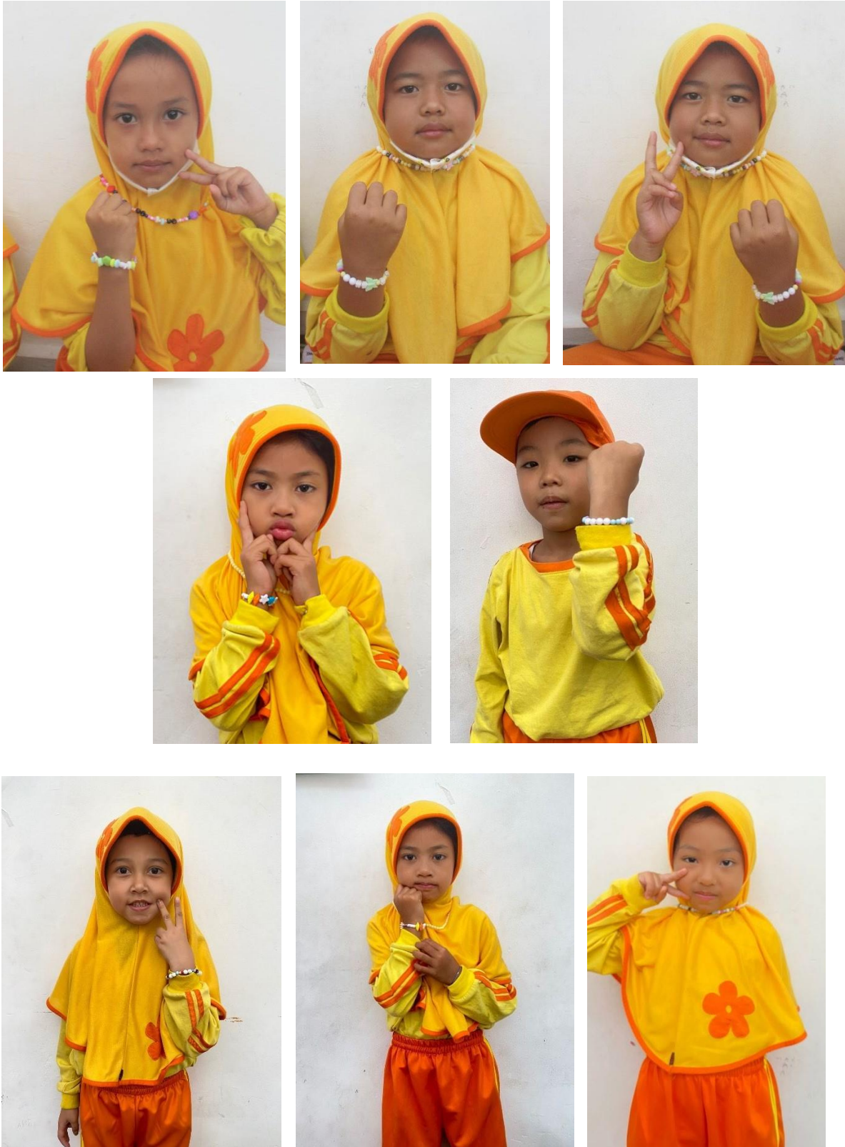
Gambar 1.17 – 1.24 Beberapa hasil dokumentasi peserta beserta karyanya masing-masing

Sesi terakhir, ialah sesi pemotretan untuk masing-masing peserta didik TK/PAUD beserta karyanya yang nantinya baik hasil karya maupun foto akan diberikan kepada orangtua peserta didik, dan dilanjutkan dengan pembagian sisa manik-manik secara tertib lalu doa penutup sebelum acara usai.