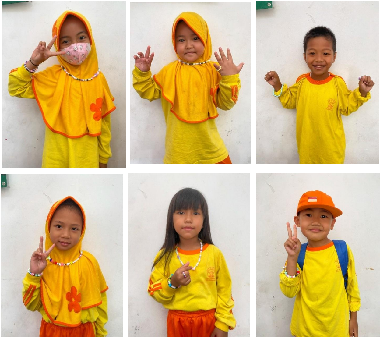
Gambar 1.25 – 1.30 Veveraoa hasil dokumentasi peserta bersama karyanya masing-masing