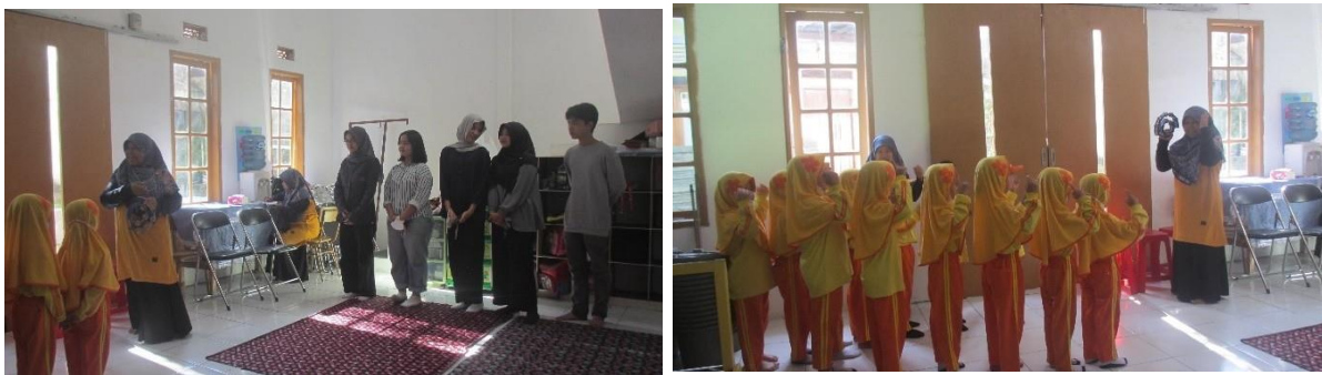
Gambar 1. 5 & 1.6 Pengkondisian interaktif & introduksi mahasiswa kepada peserta kegiatan

Di hari Jumat, 12 Mei 2023 kegiatan berlangsung. Kegiatan diawali dengan pengkondisian oleh Kepala Sekolah & 2 staff pengajar At-Tholibiin untuk menertibkan anak-anak, dengan metode yang interaktif sekaligus tertib. Lalu setelah itu, introduksi dari pihak Desain Interior Penyelenggara (Mahasiswa) dan doa bersama.