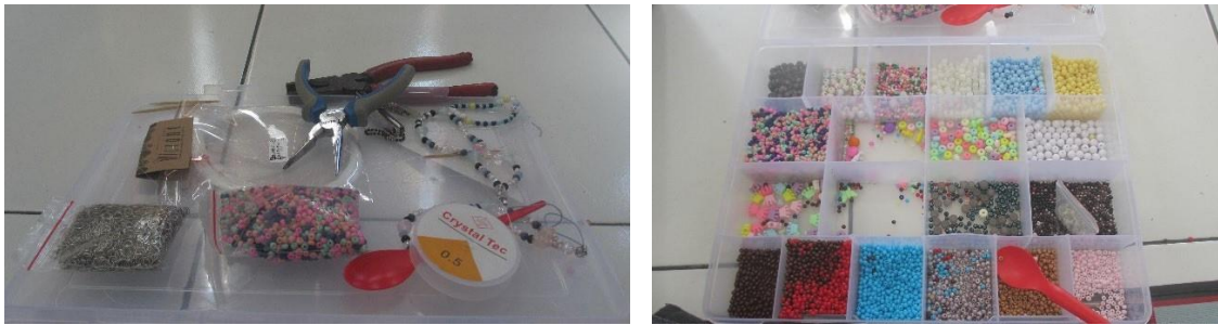
Gambar 1.7 & 1.8 Alat perkakas dan bahan manik-manik yang akan dibagikan secara tertib

Mahasiswa bertugas membimbing dan ikut menertibkan masing-masing kelompok pesertanya, juga membantu agar manik-manik tidak terjatuh selama proses kegiatan. Peran lainnya ialah juga terdapat pada pemberian wawasan secara tidak langsung kepada anak-anak terkait teori kesinambungan dan keselarasan warna. Hal ini diharapkan dapat memicu anak untuk mengolah kreatifitas dalam batasan estetika yang tepat.