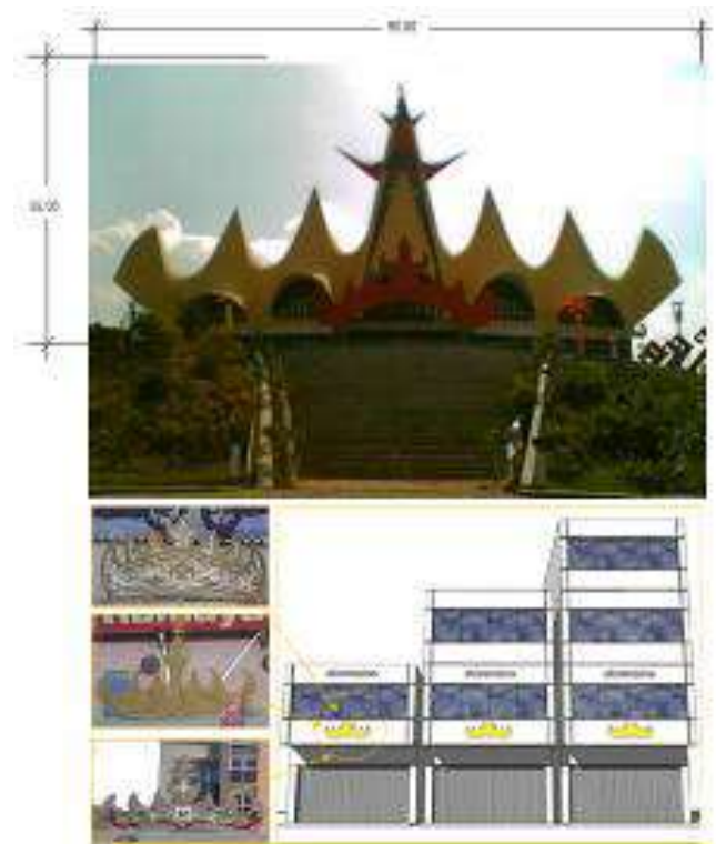
Gambar 4. Menara Siger(atas)- Model Siger sebagai simbol pada bangunan

Maksud dari dilakukannya penelitian ini adalah untuk memperoleh keberagaman kajian dan upaya yang mendukung program pemerintah dalam bentuk usulan model penerapan yang dapat diaplikasikan pemerintah kota Bandar Lampung. Dengan melakukan kajian terhadap tanda budaya masyarakat Lampung dan arsitektur bangunan khas Lampung dan membuat usulan model penerapan tanda siger pada fasade arsitektur yang dapat dipakai pemerintah kota Bandar Lampung dalam melaksanakan program penataan kawasan kota.