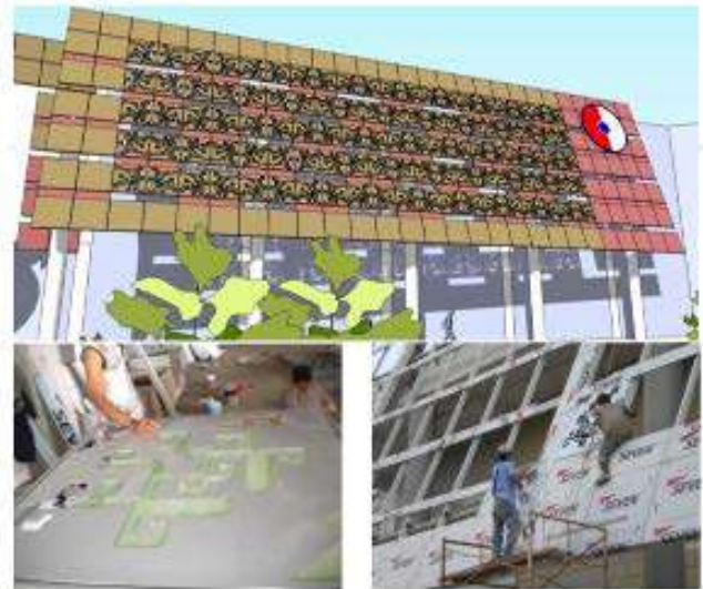
Gambar 8 Eksplorasi model tanda budaya daerah pada bangunan dengan kaidah perancangan arsitektur yang sebenarnya

Temuan terhadap perkembangan arsitektur tradisional Lampung ini, dapat menjadi latar belakang kritik dan kajian lanjutan terhadap ketetapan pemerintah untuk menerapkan konsep Siger pada fasad arsitektur serta relasi antara makna dan pengamatnya.