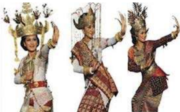
Gambar 2. Siger mahkota adat bagi perempuan dalam adat Lampung (ki-ka): Siger Saibatin, Siger Pepadun, & Siger Tuwah

Fenomena menarik Siger sebagai identitas kedaerahan Lampung, menjadi salah satu elemen akhir yang penting dalam sebuah bangunan publik komersil, dengan material, dimensi, dan corak yang beragam cerminan upaya pelestarian warisan budaya Lampung.