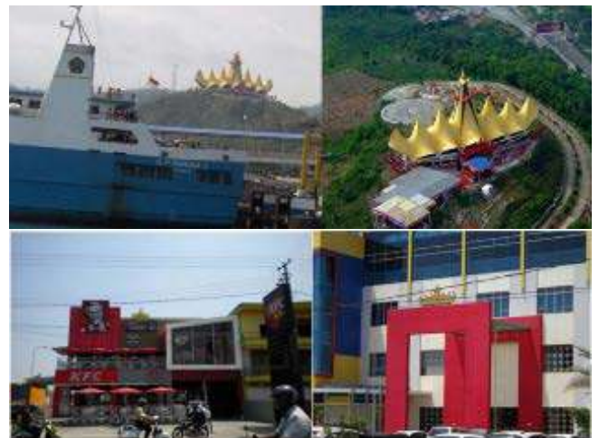
Gambar 3. Menara Siger, Bukit Gamping Lampung (atas), Penerapan Siger pada bangunan di Lampung (bawah)

Siger merupakan sebuah identitas arsitektural yang dapat dijumpai secara utuh sejak kita memasuki Bakauheni, Lampung Timur melalui sebuah mimicri bangunan yang dikenal dengan sebutan 'Menara Siger'. Simbol daerah provinsi serta permulaan titik nol Sumatera. Visualisasi ini masih dapat dijumpai lagi ketika mulai memasuki kota Bandar Lampung, melalui melalui penerapan tanda siger pada setiap fasad bangunan dan sudut jalan primer dan sekunder dalam sebuah kawasan kota.