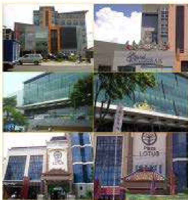
Gambar 6. Pemasangan Siger pada Fassade bangunan sebelum dan setelah keluarnya peraturan.

Pada tahap ini dapat dilakukan identifikasi penerapan berdasarkan kategori pelaksanaannya, sebagai berikut: (1) Kategori A, tipe bangunan yang seluruh struktur dan elemen bangunannya menerapkan aspek arsitektur tradisional Lampung; (2) Kategori B, tipe bangunan yang menerapkan sebagian dari elemen arsitektur tradisional Lampung, pada eksterior maupun interiornya. (3) Kategori C, tipe bangunan yang menerapkan hanya satu tanda kedaerahan Lampung pada fasad bangunan.