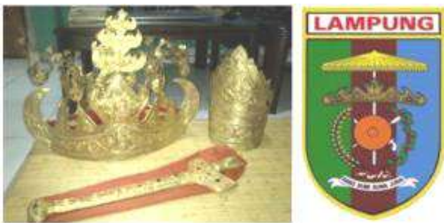
Gambar 1. Siger sebagai perangkat pakaian tradisional Lampung dan Lambang Pemprov Lampung, (sumber : observasi lapangan)

Di dalam lingkup adat istiadat daerah masyarakat Lampung, Siger juga adalah sebuah simbol berbentuk mahkota, yang sering dipakai dalam upacara perkawinan tradisional oleh pengantin wanita. Siger digunakan sebagai simbol feminitas mereka, yang melambangkan keagungan adat budaya dan representasi atas tingkat kehidupan yang terhormat (Gambar 1 dan 2).