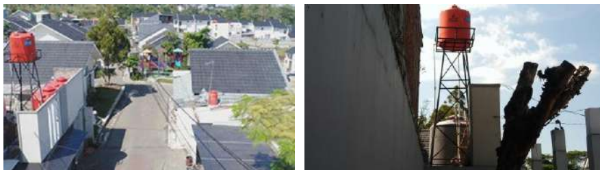
(a) View toren air kolektif dari atas (b) View toren kolektif dari bawah