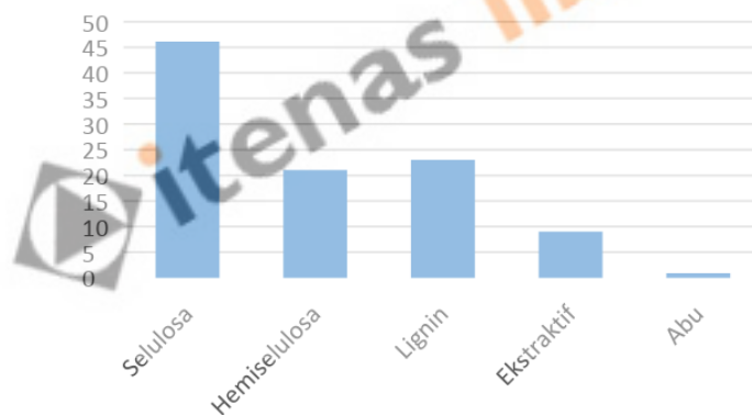
Gambar 1. Prosentase Komponen Primer dan Sekunder pada Kayu

Limbah serutan kayu yang dihasilkan dapat merusak lingkungan bila tidak dimanfaatkan dengan baik. Pada industri besar, limbah serutan kayu gergajian dimanfaatkan sebagai briketarang dan dijual komersial. Namun untuk industri kecil yang jumlahnya ribuan unit dan tersebar di pedesaan, limbah serutan kayu masih belum dimanfaatkan secara optimal. Ditinjau dari komponen penyusunnya limbah serutan kayu dapat dimanfaatkan seperti bahan bakar dan arang aktif. Komponen primer dari kayu adalah selulosa (40-50%), hemiselulosa (15-34%) dan lignin (17-35%) sedangkan sisanya adalah komponen sekunder dari kayu yang terdiri dari ekstraktif (1-10%) dan abu (< 1%) [1], seperti yang ditunjukkan pada Tabel 1.