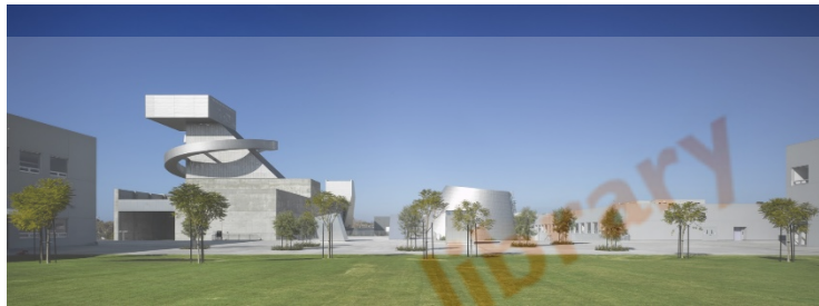
Gambar 1.2 Ramon c cartines School of visual & performing Arts