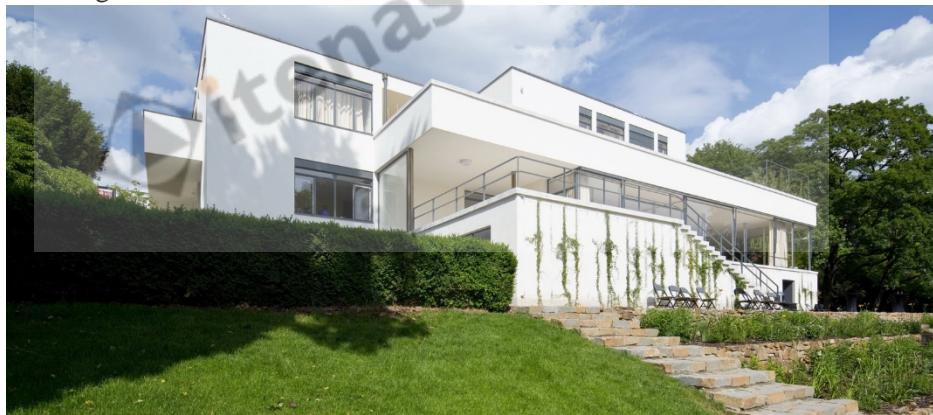
Gambar 1.6 Villa tugendhat