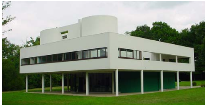
Gambar 1.5 Villa sayoye