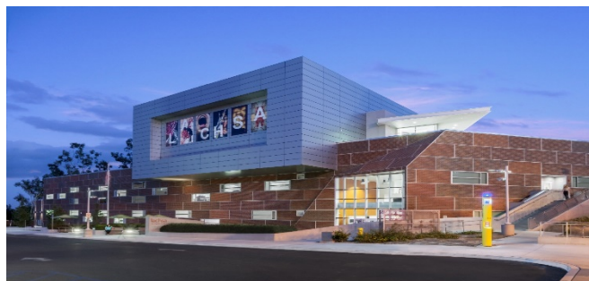
Gambar 1.1 Los Angeles Country High School Of Art