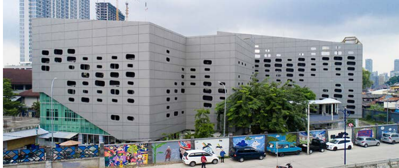
Gambar 1.3 Institut kesenian Jakarta