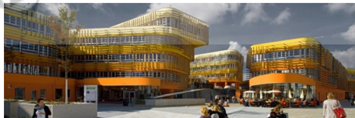
Gambar 2.13 Lasalle College of The Arts

Bangunan ini mengusung tema kontemporer, dibangun oleh Crab Studio pada tahun 2013 yang berlokasi di Vienna, Austria. Crab Studio merancang bangunan ini berdasarkan keyakinan kuat Cook dan Robotham (berdasarkan bertahun-tahun sebagai guru Universitas) bahwa gedung perguruan tinggi yang hidup dan sukses harus memiliki ruang internal yang murah hati dan menarik yang bukan hanya ruang seminar atau kantor, tetapi tempat untuk 'nongkrong' dan mungkin mendorong mahasiswa untuk tinggal di sekitar setelah kelas. Di luarnya adalah lapisan kisi-kisi kayu alami yang sebagian berhubungan dengan peneduh matahari dan merespons hutan yang mengelilingi kampus. Berikut Gambar 2.6 merupakan bangunan MC1. Departments of Law and Central Administration di Vienna.