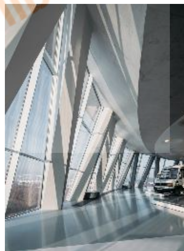
Gambar 3.2 Struktur Bangunan