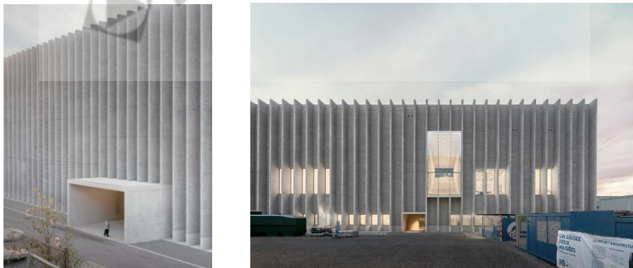
Gambar 3.3 Fassade Bangunan

Terletak di pusat kota, proyek ini mengusulkan rencana induk untuk tiga museum utama kota: Museum Seni Rupa MCB-A, Museum Desain Kontemporer dan Seni Terapan MUDAC dan Museum Fotografi Musée de l'Elysée. Museum Seni Rupa, yang terbesar dari tiga museum, membawa dan mengungkapkan memori situs tersebut, mengembangkan kondisi industri sebelumnya dari situs tersebut dengan bentuk pragmatis, geometri yang keras, dan garis-garis keras dan tajam.